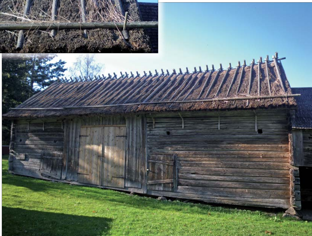
Loge B23 där ryggningen är nästan borta samt detalj på den magra ryggningen.