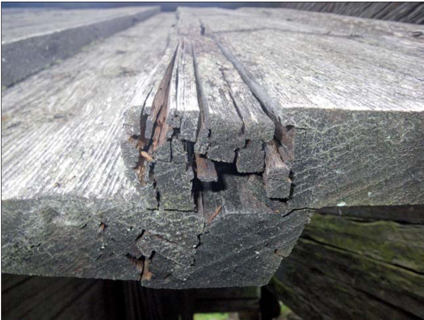
Virket är rötskadat.