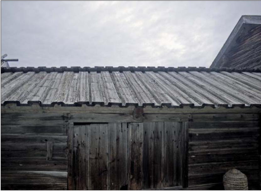
Brädtaket på visthusboden A4 före renovering.