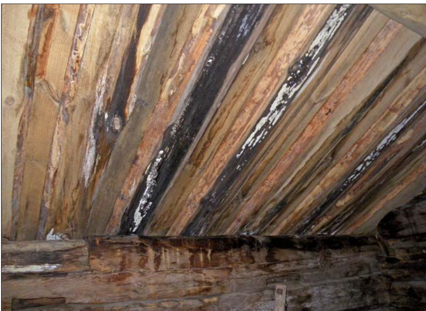
Rötskadorna har lett till svamp- angrepp på insidan av taket.