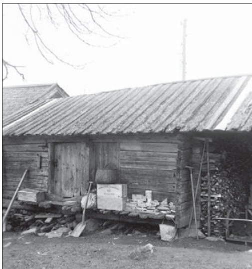
Foto från 1946 som legat till grund för renoveringen av brädtaket.

Enligt ett foto från 1946 taget av fotografen A C Hultgren visar att visthusboden A4 inte hade dennock som tillkom vid omläggningen år 2000. Fotot har fått vara vägledande vid omläggningen och taket har fått tillbaka sitt utseende med en brädnock. I samband med Smedstorpsdagen den 18 augusti 2012 demonstrerade en av takläggarna hur man lägger ett brädtak och vikten av att använda virke av bra kvalitet.