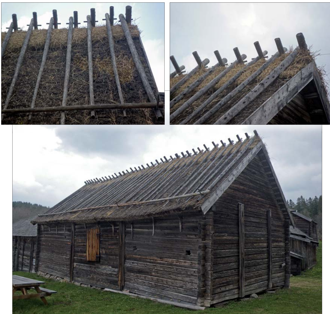
Efter genomfört arbete med ny rygging.

Stegen har nytillverkats av kluven gran och pinnarna är av naturvuxen gran. Varannan pinne är kilad med en liten kil av ek för att hålla pinnarna i spänn så att de inte glider ur. Två nya pinnar sitter på plats i de gamla hålen i väggen så att stegen lutar lite och vatten kan rinna av.