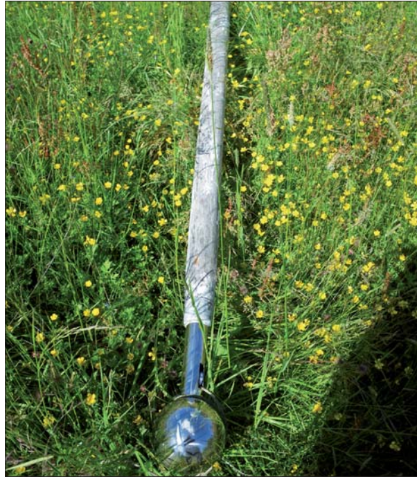
Ovan. Skador på det pappspända taket. Nyttillverkad hålkärsläst. T h. Flaggstängen före renskrapning.