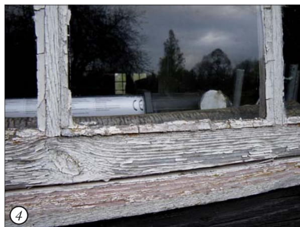
1. Bågottenstycke i Röda stugan.