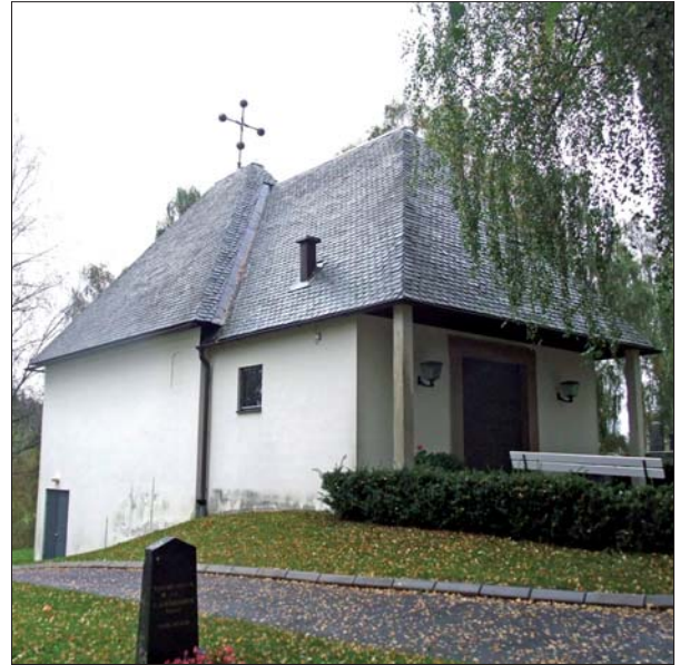
Gravkapellet i Gusum uppvisar stora likheter med gravkapellet i Törnevalla. Gusums gravkapell byggdes till 1982.