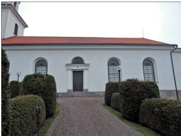
Det utvändiga arbetet på kyrkan gällde den södra sidan.

Kyrkan: Åtgärderna har gällt kyrkans södra långsida och övergången till det absidformade koret. Putsskador i takfoten lagades med luftkalk. Fasaderna var sedan tidigare avfärgade med en silikatfärg och nu avfärgades hela södra fasaden med Keim Purkristalat, kulör 9870, en bruten vit kulör.