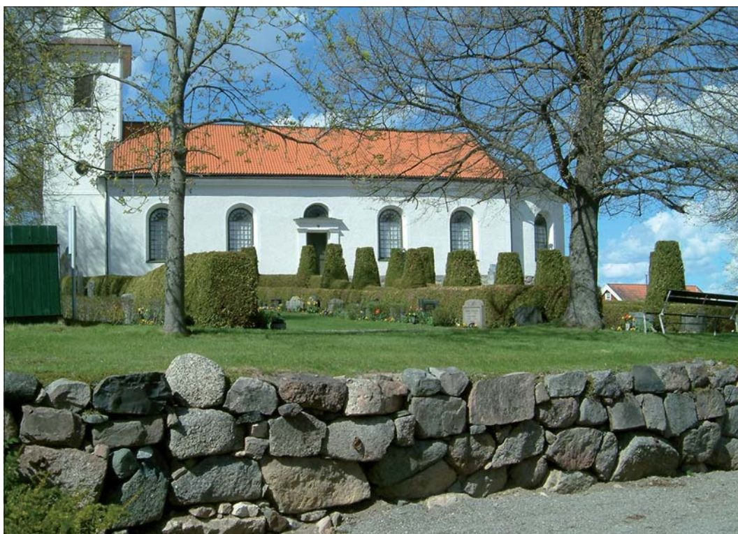
Törnevalla kyrka från sydväst. Foto 2005.

Söder om kyrkogården, strax utanför muren, står gravkapellet. Det är byggt på 1950-talet efter ritningar av arkitekt Bertil Thafvelin. Gravkapellet är mycket likt gravkapellet på Gums kyrkogård i Valdemarsviks kommun. Det uppfördes 1941 efter ritningar av arkitekt Kurt von Schmalensee. Bertil Thafvelin och Kurt von Schmalensee arbetade senare tillsammans med renoveringen av Törnevalla kyrka 1969-70. Gravkapellet har spritputsade fasader, slätputsade omfattningar och knutar avfärgade i brutet vitt, valmat sadeltak täckt med falsad, svartmålad plåt och en dubbelport mot öster klädd med nitade plåtar. Utanför porten finns en mindre broläggning av kalksten som ligger under skydd av taket som är utdraget något och vilar på fyra enkla träpelare. I norr och söder finns fönster med dekorativ träspröjs.