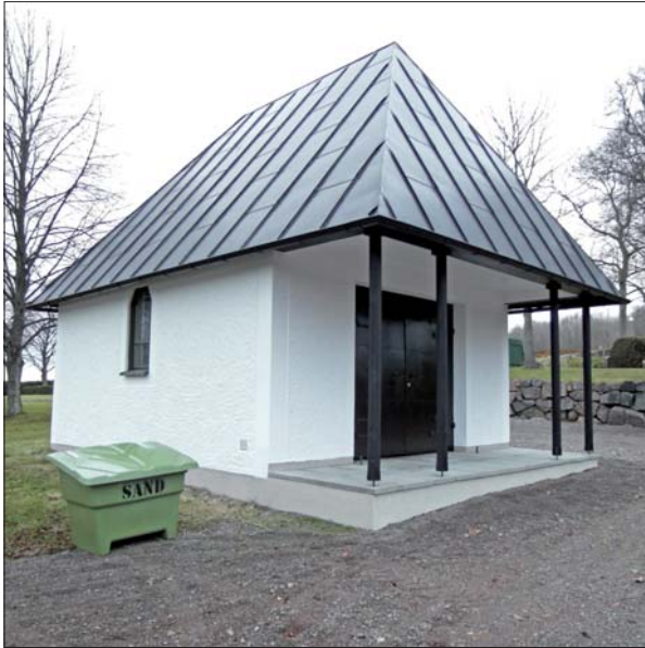
Gravkapellet från sydöst.