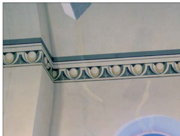
Kulörskillnad på invändig lagning.