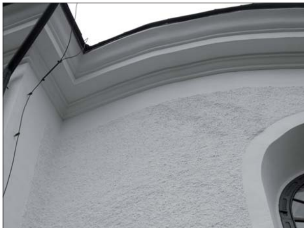
Lagad putsskada i övergången långhus/kor.

En del av putsskadorna berodde troligen på att takplåten varit fellagd. Vid något tillfälle har ståndrännan förstärkts med ytterligare en plåt, som skruvats fast med farmarskruv. Dessutom är taksprånget mycket kort och skyddar inte takfoten lika mycket som t ex på kyrkans norra sida. Den felaktiga konstruktionen revs bort och ersattes med en ny fotränna och fotplåt i Hardcoat. Taksprånget gjordes något mer utskjutande.