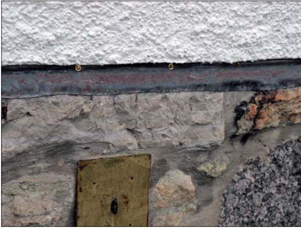
Blyplåtens fästning förstärktes med extra mässingskruvor.