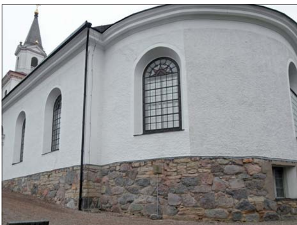
Den äldre och den nya avfärgningen möts i en skarp gräns på korväggen.

När byggnadsställningarna vid kyrkans södra långsida var nermonterade visade det sig att den nya avfärgningen avvek tämligen mycket från den tidigare kulören. Gränsen hamnade en bit in på det absidformade koret. Samma avvikelse var inte lika märkbar i anslutning till kyrkans västfasad. Ingen diskussion om kulören ägde rum. Kulörskillnaden mellan den nyavfärgade södra sidan och kyrkan i övrigt måste åtgärdas. Förslagsvis målas södra sidan om till våren. Ett alternativ som behöver diskuteras med Länsstyrelsen kan vara att måla korabilden enligt den ”nya” kulören och eventuellt få en mindre synlig övergång på kyrkans norra sida. När det gäller interiören är det redan beslutat att entreprenören målar om lagningarna.