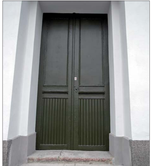
Fönster och dörr på södra sidan målades med Ottosson linoljefärg.

Inne i kyrkorummet lagades sprickorna över de två östligaste långhusfönstren med luftkalk och lagningarna avfärgades med Gotlandskalk. Färgen avviker dock från omgivande väggar och kommer att färgas om. Vid västra gaveln har en rits tagits upp i anslutningen valvtak/tornvägg för att minska sprickbildningen i detta väggparti.