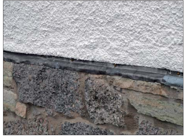
På en mindre sträcka, byttes plåten till ny blyplåt.

Kyrkans frilagda sockel utgörs av fogad gråsten och kalksten. Sockeln är avtäckad med en fastskruvad blyplåt. Plåten hade nu bitvis lossnat från fasaden och fästes på några ställen med extra mässingskruvor och på ett parti ersattes den äldre plåtavtäckningen med en ny blyplåt.