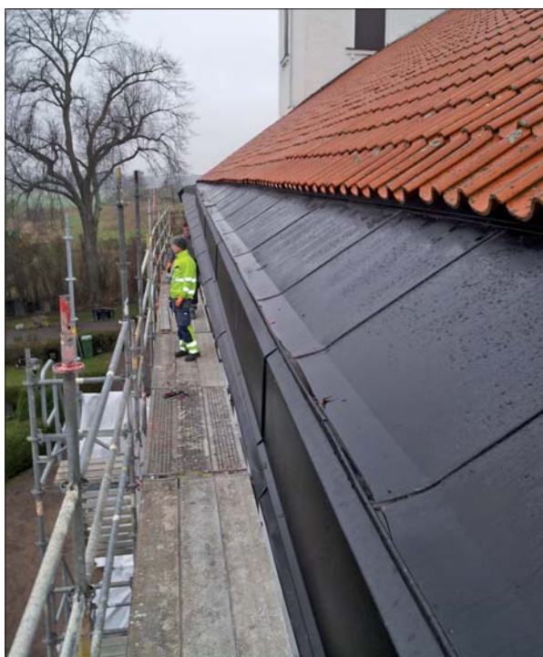
De två fotografierna visar den nyttillverkade ståndrännan.