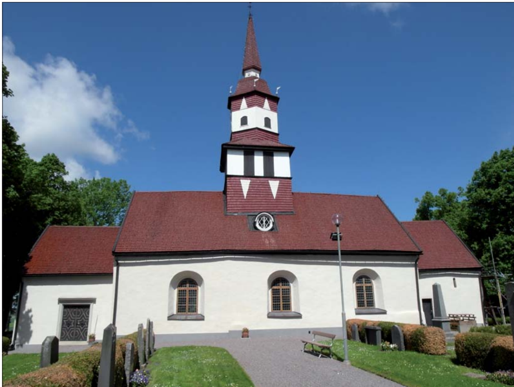
Kyrkan från söder, efter avfärgning men innan fönstren har målats.