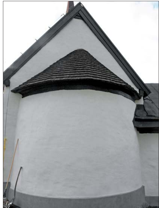
Absiden efter avfärgning.