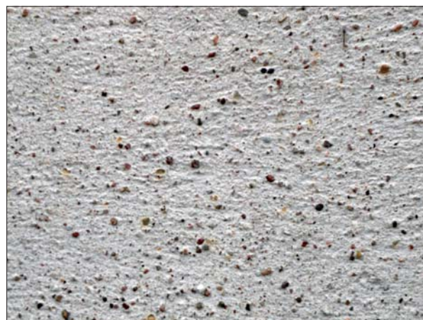
Befintlig fasadputs, troligen från 1959/60.

År 1959/60 gjordes en omputsning av fasaden med nedknackning av befintlig puts, som enligt en beskrivning av byggnadsingenjör Ture Jangvik var en spritputs. Det är inte helt klarlagt om det rör sig om total nerknackning, eller nerknackning av enstaka partier. Under spritputsen fanns en äldre, grov puts och underst satt ett mellanting mellan puts och fogstrykning. Sockeln var täckt av pågjuten cement. Ture Jangvik avsåg att ta bort cementsockeln, men efter att ha knackat bort delar av sockeln beslutades det att låta den vara kvar och istället laga den. Besiktningen visade att det inte fanns någon speciellt utformad sockel under cementen, utan väggens murverk fortsatte ner under mark. Han bedömde även murverket som trasigt.