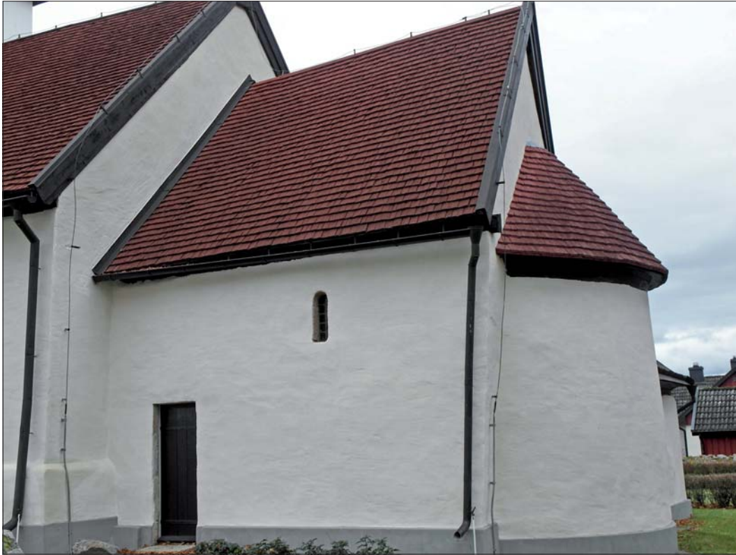
Nytjärade tak. Tjärnan är pigmenterad med Falu ljus.