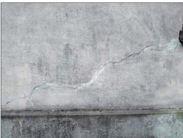
Spricka i norra fasaden.