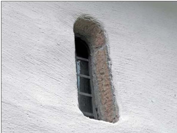
Del av den södra korfasaden med medeltida öppning efter avfärgning.