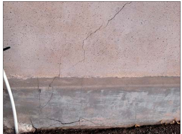
Spricka i fasaden och den pågjutna sockeln.