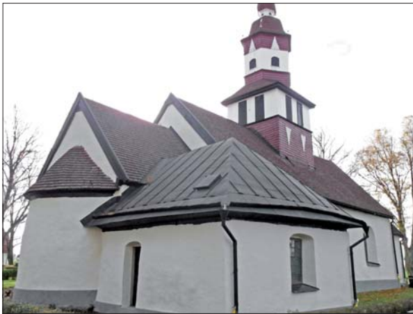
Kyrkan från nordöst efter avfärgning. Spåntaken är ännu inte tjärade.