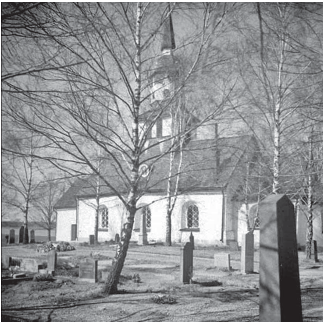
Björkebergs kyrka från sydöst. Troligen är bilden tagen något innan man bytte fönsterbågarna från andra delen av 1800-talet till dagens bågar. Foto 1945, Östergötlands museum.

Björkebergs kyrka är uppförd i sten omkring sekelskiftet 1200 med rektangulärt långhus, smälare absidkor, sakristia i norr och spåntäckta takfall. Långhuset har under 1700-talet förlängts åt väster, fått förstörade fönster samt försetts med en spåntäckt takryttare målad i vitt och rött. Denna restes på 1760-talet med Petter Frimodig som byggmästare, känd för flera tornbyggnader i länet. I väster finns ett reveterat, timrat vapenhus. Långhusets fönsteröppningar är rundbågiga med träbågar och blyspröjsat färgat antikglas. Samtliga fönster i långhuset blev utbytta 1945. Solbänkarna är kopparklädda. I korets sydvägg finns en medeltida ljusöppning. Huvudingången ligger på vapenhusets södra sida och består av en rektangulär öppning med profilerad gråmålad träomfattning och en rak, svart pardörr med stjärnformade speglar. På korets södra sida finns en smal, rektangulär dörröppning med en rak, tjärad enkeldörr. Sakristian har en stickbågig dörröppning mot öster med en rak, tjärad enkeldörr med diagonalställd panel.