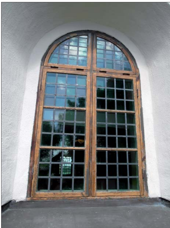
Fönsterbåge innan ommålning.