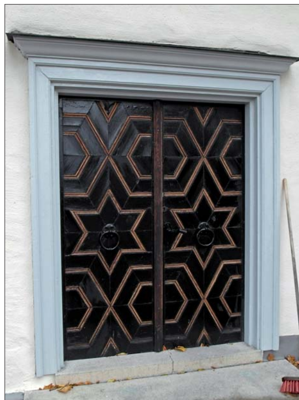
Huvudingångens pardörr är oljad och portalomfattningen målades med täckfärg.

På korabsidens tak lades nya kluvna furuspån från Skänninge kyrkspån. Samtliga takfall och takryttaren har tjärats med tjära, pigmenterad med Falu ljus. Vindskivor har lagats och dessa, liksom takfoten av trä, är tjärade med tjära, pigmenterad med järnoxidsvart. Takryttarens tornprydnader har lagats och målats vita, lika befintligt. Även det runda fönstret i södra takfallet, under takryttaren, har målats vitt. Målning av samtliga snickerier har utförts med Lasol utvändig linoljefärg.