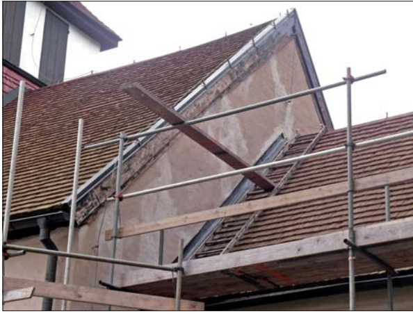
Putsugning på långhusets västra gavel.