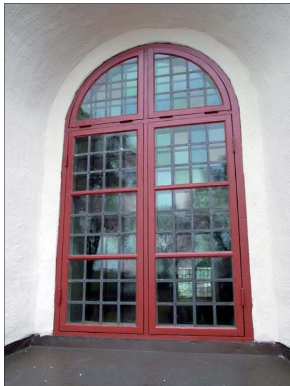
Fönsterbåge efter ommålning.