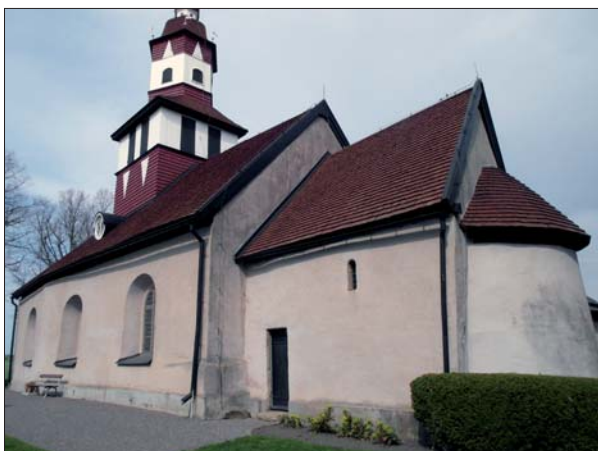
Björkebergs kyrka från sydöst.

Genomgång av åtgärder på plats innan renoveringen påbörjades.