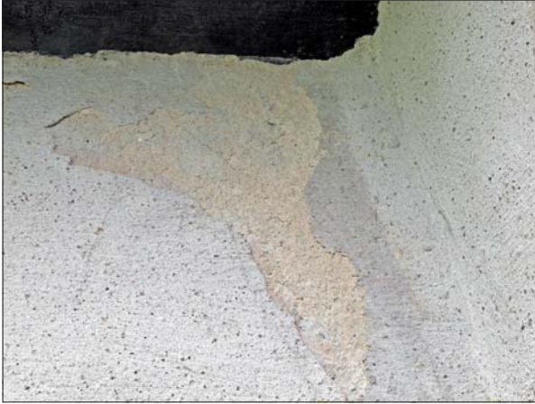
Putsbortfall på norra sidan, anslutningen sakristia/långhus.

Det fanns en del sprickor i fasaderna och putsbortfall, men skadorna bedömdes inte vara så omfattande att det var aktuellt med en omputsning av kyrkan.