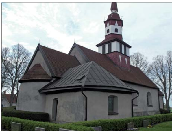
Björkebergs kyrka från nordöst.