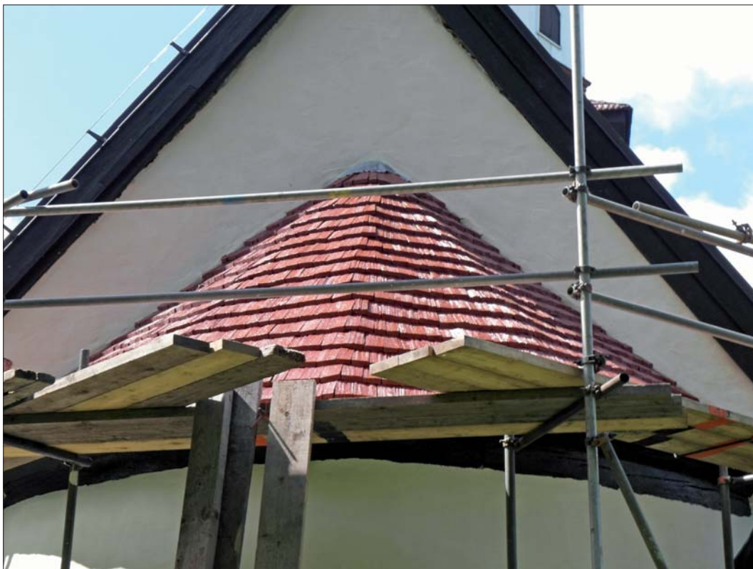
Korabsidens tak fick en ny spåntäckning.