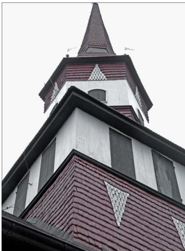
Detalj av takryttaren uppförd av Petter Frimodig på 1760-talet.