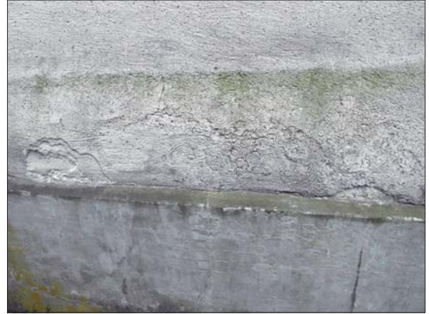
Märklig "formation" i putsen på norra fasaden.