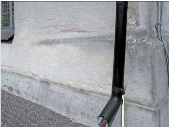
Putsbortfall i långhusets sydöstra del.