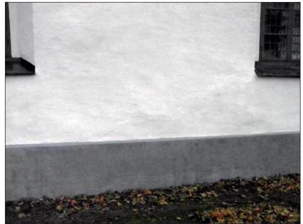
Detalj av fasad och sockel efter avfärgning.