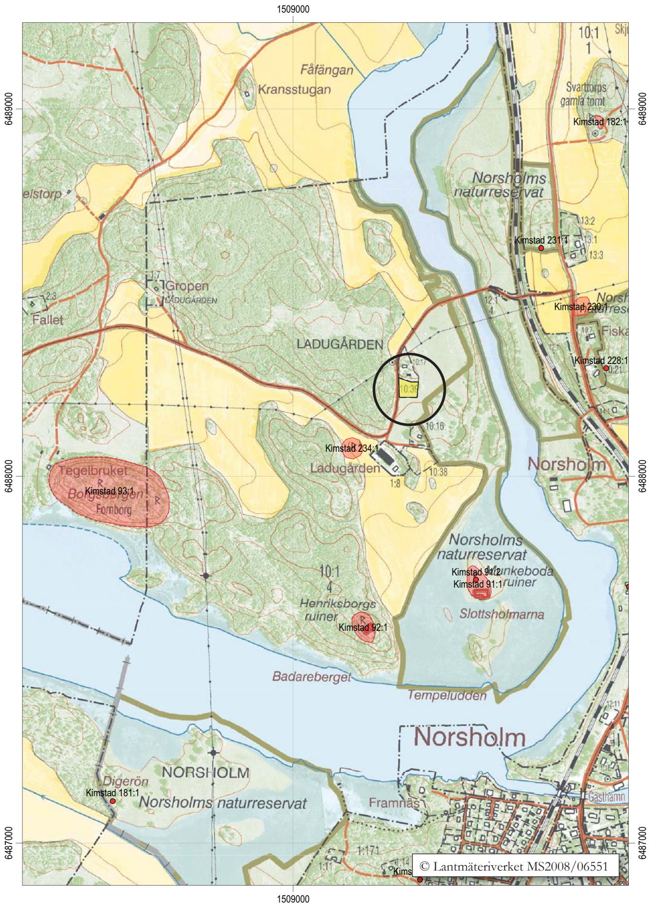
Figur 2. Utdrag ur digitala Fastighetskartan med undersökningsområdet markerat. Skala 1:10 000.