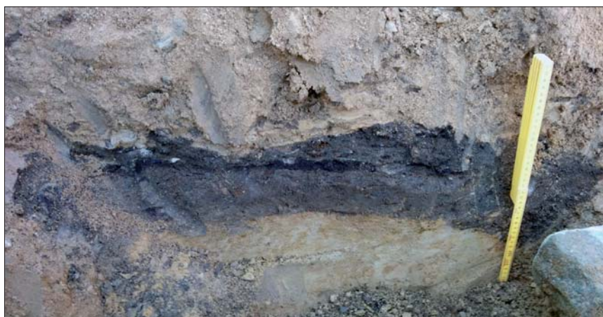
Figur 4-5. Foto profil 1 (överst) och 2.