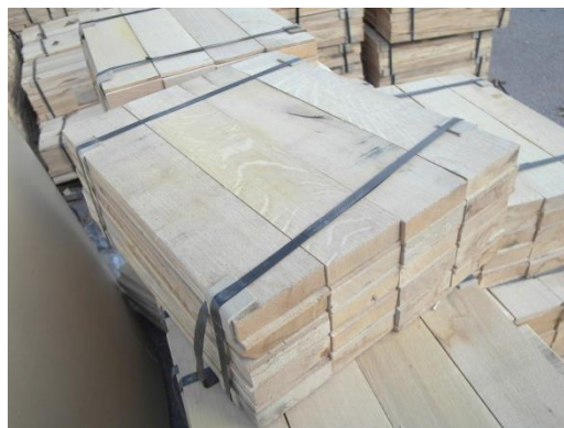
Det nya ekspån.