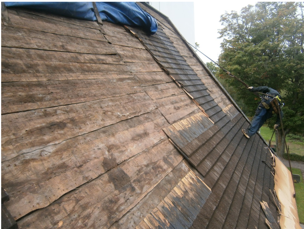
Avrivning av det äldre spånet pågår.