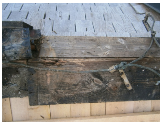
T v: lagning av taktrons med nytt furuvirke. T h: trasig taknock, som byttes ut.