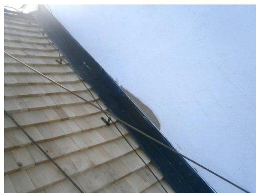
T v: läggning av nytt spån på befintlig taktron. T h: putsläggning vid anslutningen till tornet.