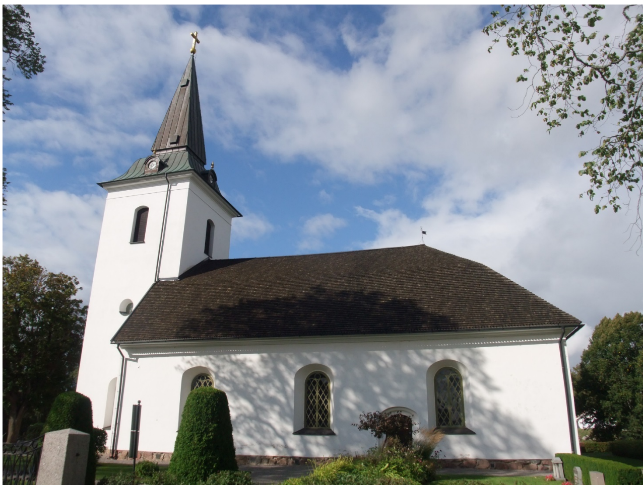
Sya kyrka från söder.

En kyrka uppfördes troligen på 1200-talet i Sya. Den ersattes 1774 av den nuvarande kyrkan. Delar av den medeltida kyrkans murverk kan ingå i den norra muren. Kyrkan är uppförd i gråsten och har ett rektangulärt långhus med rakt avslutat kor i samma bredd. Sakristian ligger på norra sidan, med ingång från koret. Tornet i väster avslutas med en låg koppartäckt, klockformad huv med hög spira. Tornet och sakristian byggdes 1863. Huvudingången är genom tornet. Ytterligare en portal finns i söder. Kyrkans fasader är slätputsade och avfärgade i brutet vitt. Långhuset har en gustaviansk karaktär med sitt kraftiga och spåntäckta tak, medan tornhuv och spiran mer speglar sin tids arkitektur. Även invändigt har kyrkan en gustaviansk karaktär med bl a den kraftiga taklisten och det välvda brädtaket.