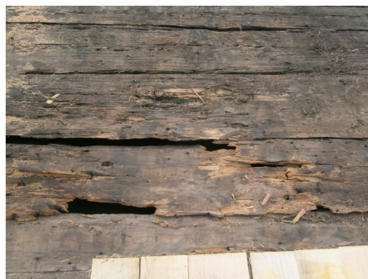
Skador i taktron.