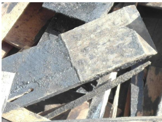
Bortrivet takspån av sågad ek.