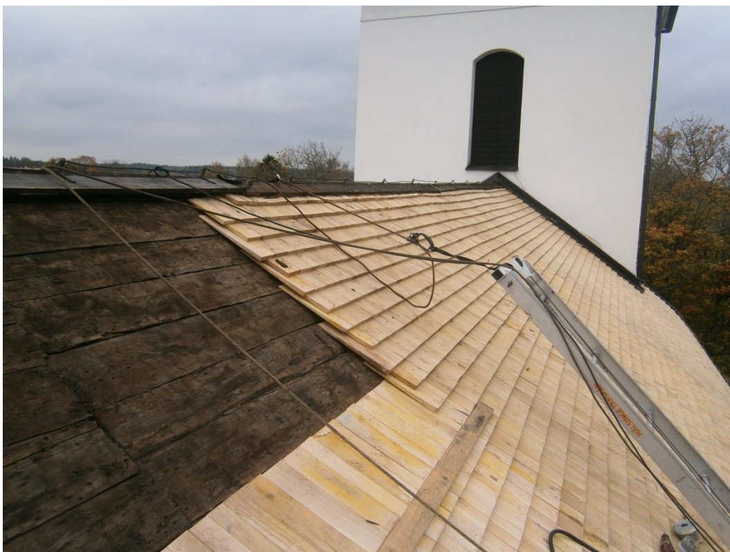
Spånläggning pågår.