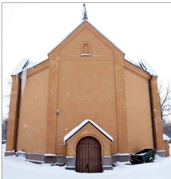
Gravkapellet från norr. Foto Östergötlands museum 2010.