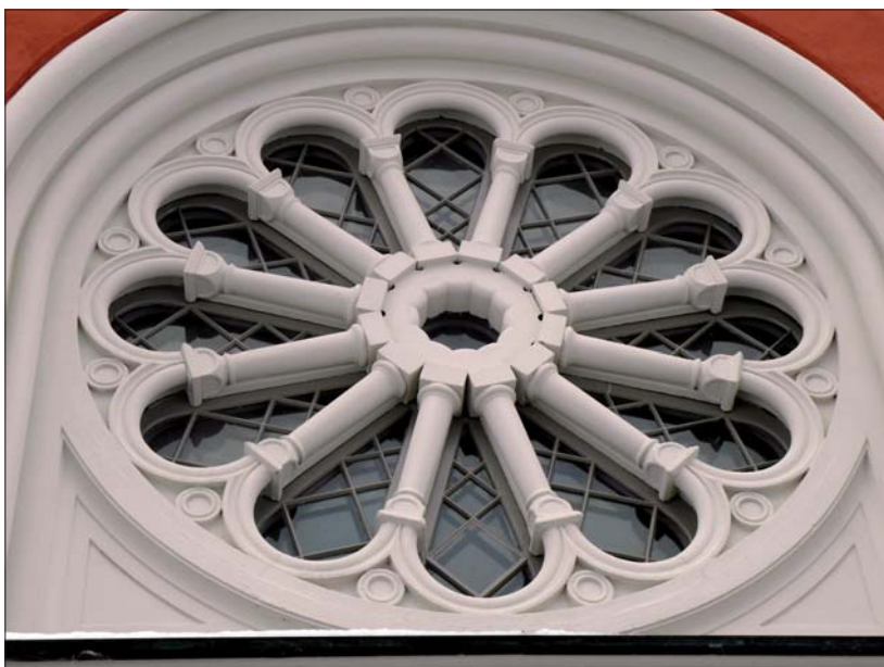
Rosettfönstret efter ommålning.