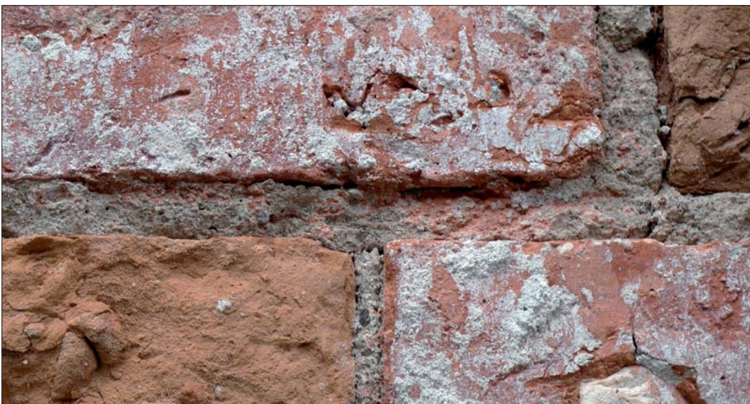
Exempel på röda färgspår på murfog.