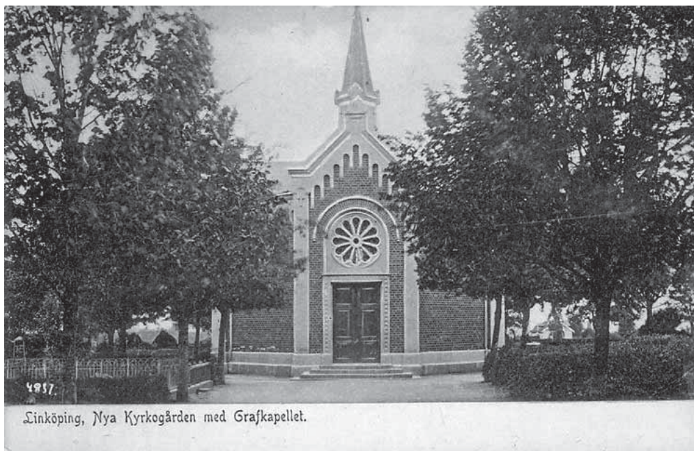
Gravkapellet från söder år 1900.

från början. Fasaden avslutas upptill av en profilerad putsad takfot. Taket är korsformat och skivtäckt med falsad kopparplåt och kröns med en kopparklädd lanterninliknande spira. Spiran avslutas med ett förgyllt kors och en äldre typ av förgyllda kors kröner lanterninens gavlar. Ståndrännor och stuprören med böjda vinklar är av koppar.