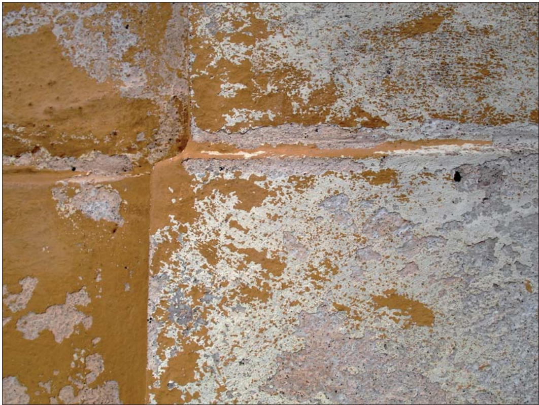
En ljusare gul kulör som kunde ses på flera ställen på fasaden.