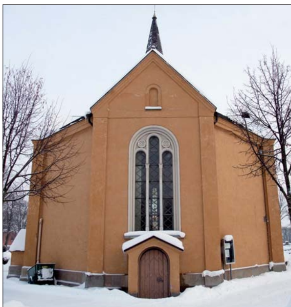
Gravkapellet från väster. Foto Östergötlands museum 2010.