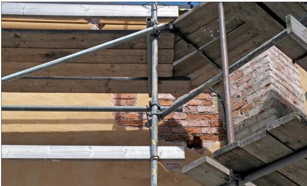
Ett skadat parti i anslutning till takfoten har huggits upp. Dessutom högs all puts bort på hörnlisenerna.