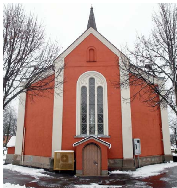
Kapellet från väster.