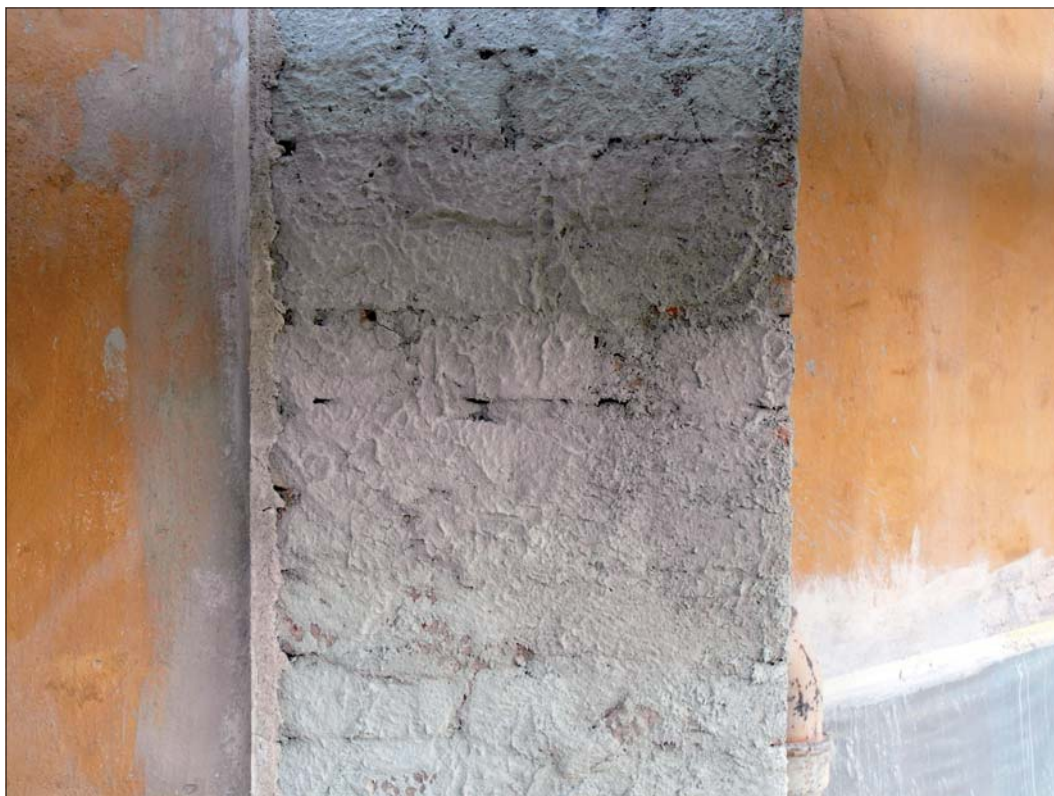
Grundning av lisen.

Skadorna var mest omfattande på lisenerna och där slogs all puts ner. Underlaget bedömdes vara lite sämre här än på murverket i övrigt och därför godkändes användande av KC-bruk i botten. (Telefonsamtal med Länsstyrelsen 2014-08-21.) I övrigt användes Webers lagningsbruk och finbruk med luftkalk, dolomit och natursand. Fasaderna förvattnades och eftervattnades enligt Webers rekommendationer.