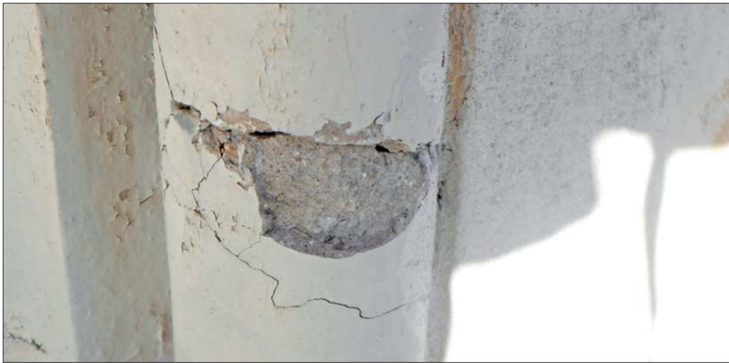
Skada på rund list i fönstrens masverk.