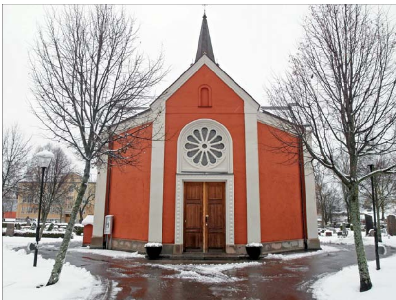
Kapellet från söder efter renovering.