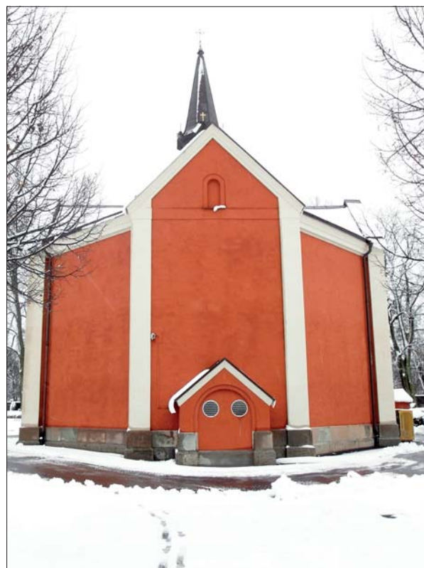
Kapellet från norr.