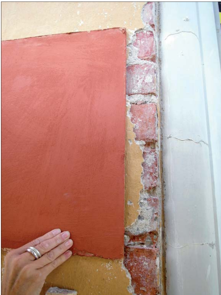
Uppmålat färgprov på den röda kulören. Intill provbitens nedre del finns några av de färgspår som provmålningen ut- gick från.