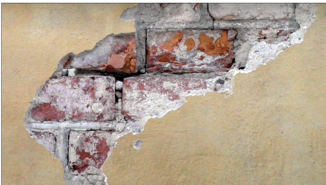
Exempel på rundfog.

Byggnadshistoriska iakttagelser eller erfarenheter gjorda under arbetet. Bortsett från att all puts togs ner från lisenerna, blottades murverket enbart i samband med en del skador. På ett ställe i öster syntes en rundfog utan färgspår. Den kan tyda på ett ursprungligt fasadutseende med ett bart tegelmurverk. På flera ställen fanns dock inte en sådan fog, men däremot spår av röd färg på murfogen och även på en del tegel. En tolkning är att rundfogarna har blivit dåliga och slagits ner. I samband med detta avfärgades hela fasaden röd.