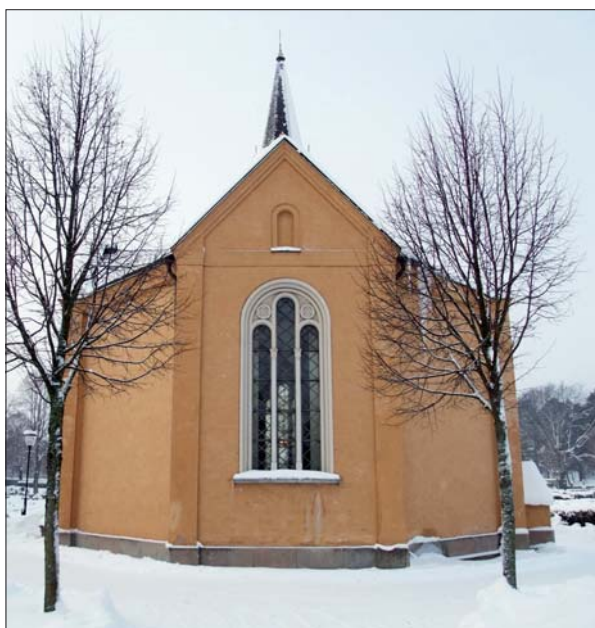
Gravkapellet från öster. 2010.