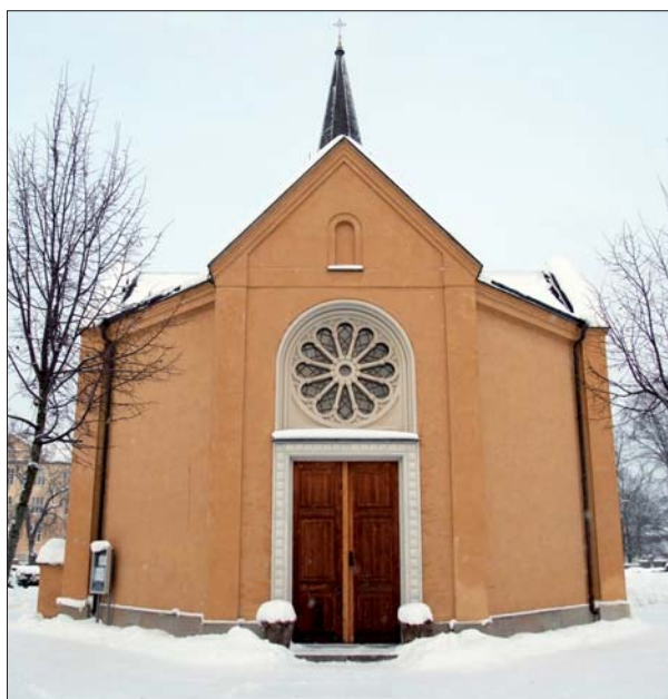
Gravkapellet från söder. Foto Östergötlands museum 2010.

Gravkapellet ligger centralt på Norra griftegårdens äldre del, placerat i mittaxeln som på andra sidan Malmslättsvägen övergår i Södra griftegårdens mittaxel. Det åttkantiga gravkapellet är uppfört i en våning med källare. Det korsformade taket och fyra utskjutande sidor med gavelfronton ger en något korsformad exteriör. Kapellet har en stomme av tegel och fasaderna är slätputsade och var innan fasadrenoveringen avfärgade i guldockra. Sockeln av ett skift räfflad kalksten vilar på en grund av fogade grovhuggna och avfasade granitstenar. Fasaderna saknar dekor, men i de fyra gavelröstena finns en rundbågig nisch. Nischerna verkar inte ha funnits