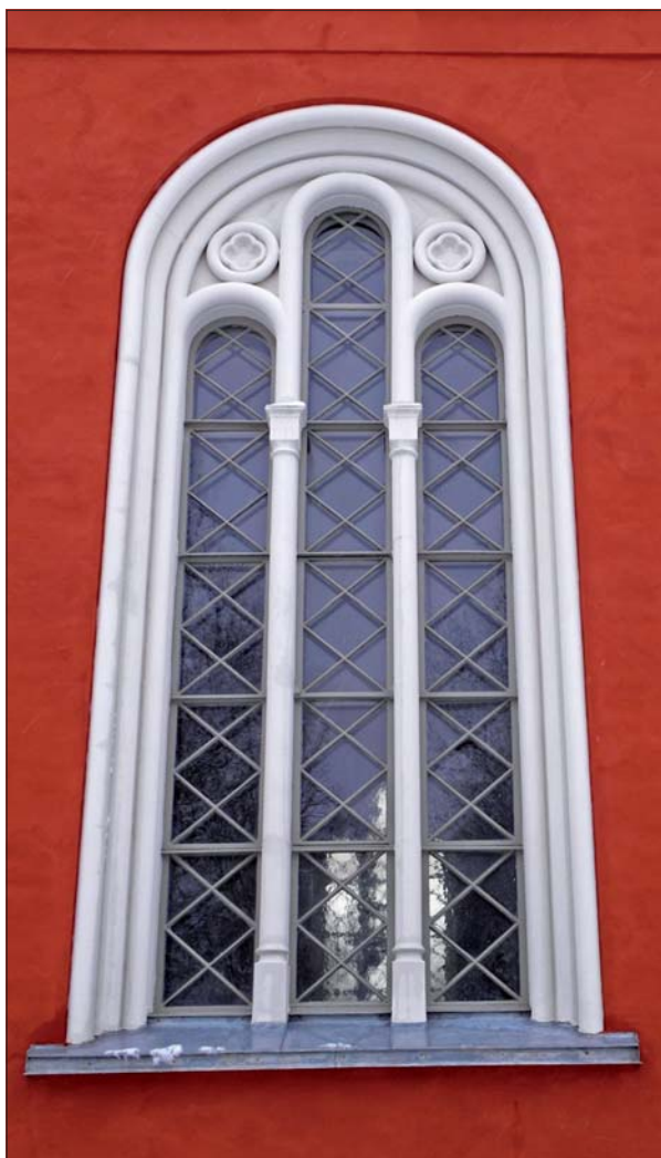
Fönster i öster.

Östergötlands museum har deltagit som antikvariskt medverkande och kan godkänna arbetet ur antikvarisk synpunkt.