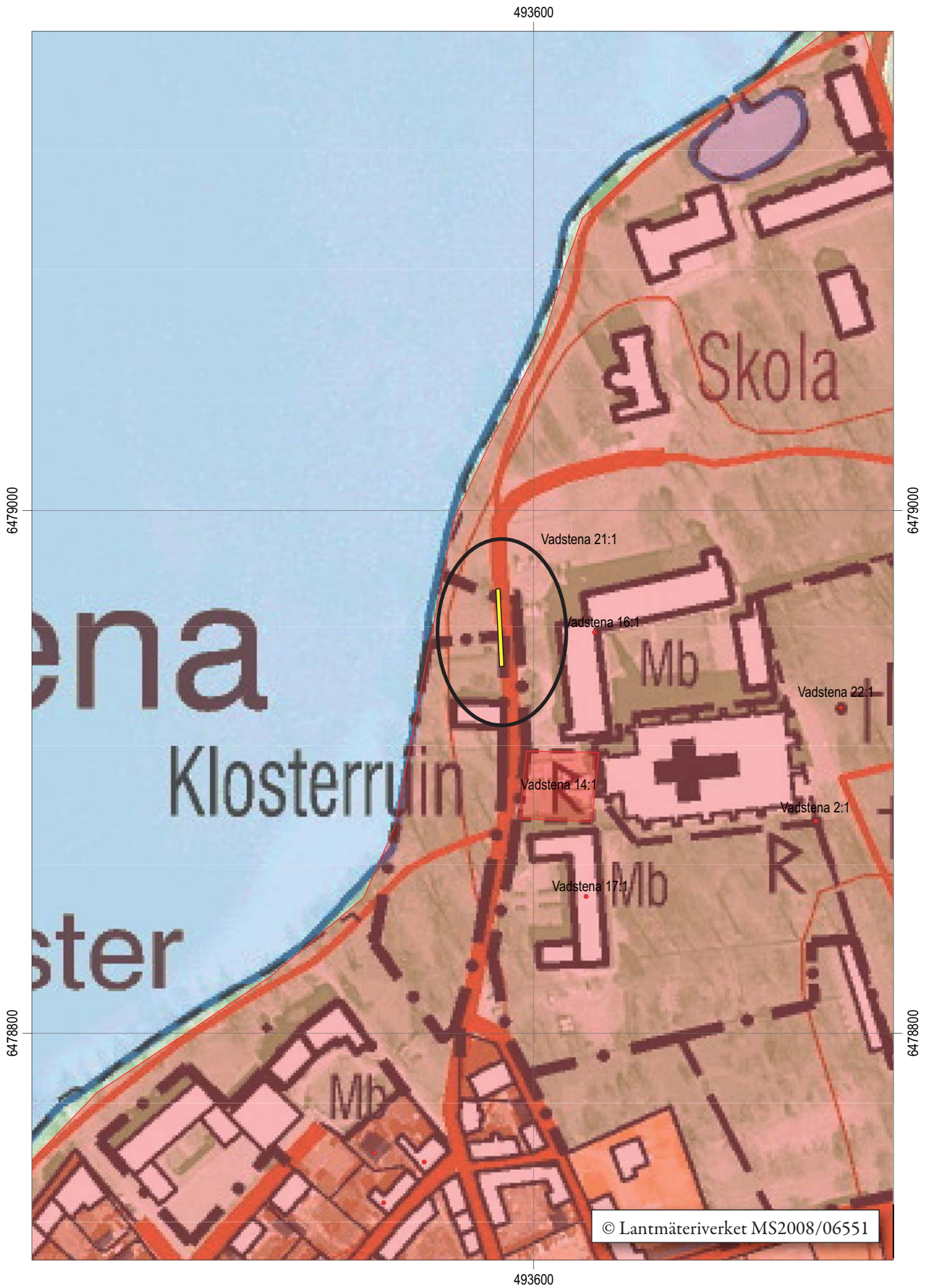
Figur 3. Utdrag ur digitala Fastighetskartan med det aktuella schaktet markerat. Skala 1:2 000.