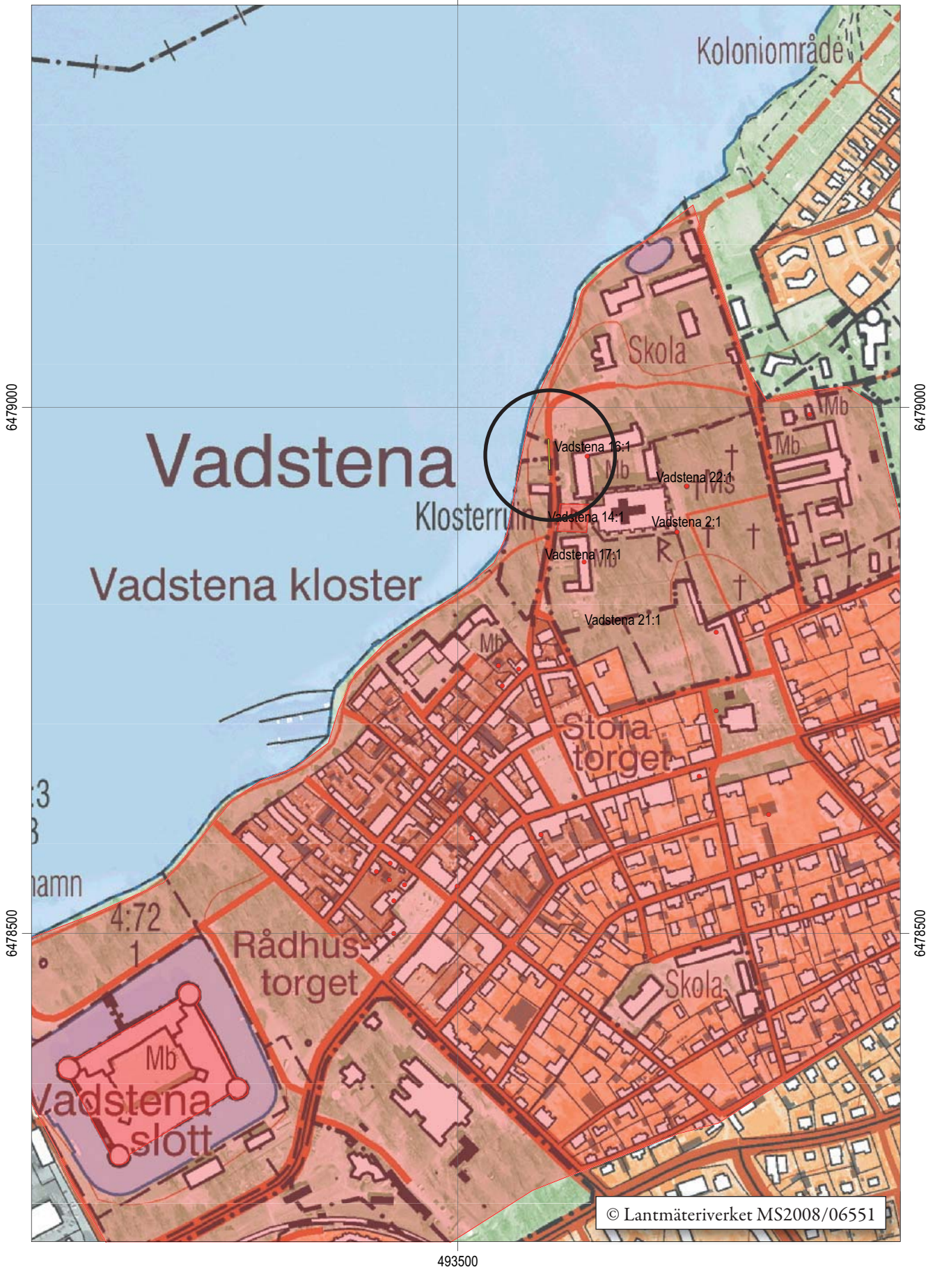
Figur 2. Utdrag ur digitala Fastighetskartan med undersökningsområdet markerat. Skala 1:5 000.