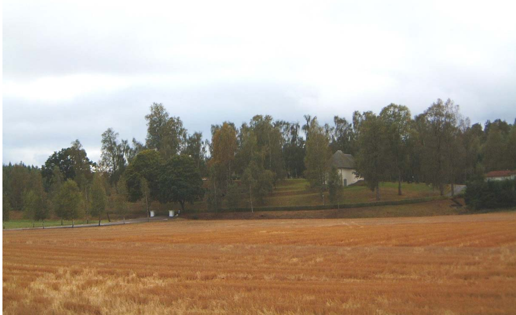
Gusums begravningsplats från nordväst. Foto Östergötlands museum 2002.

Begravningsplatsen i Gusum ligger ca 700 m söder om Gusums kyrka. År 1941 uppfördes ett gravkapell som ersättning för en äldre träbyggnad. Kapellet var ritat av Kurt von Schmalensee, stadsarkitekt i Norrköping. Det byggdes till med en ny entrédel 1982, ritad av byggnadsingenjör Ture Jangvik. Han har även ritat klockstapeln som uppfördes 1973 strax söder om gravkapellet. Kapellets fasader är putsade och avfärgade i brutet vitt. De kraftiga och valmade takfallen är klädda med svarta skifferplattor. Fasaden är mycket enkel med en fönstergrupp om tre spetsbågiga fönster i söder. Interiören präglas av de polerade kalkstensgolven och det höga, brädklädda taket i ceremonisalen.