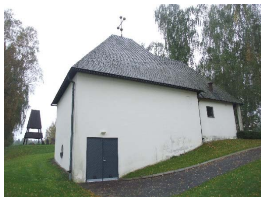
Gusums gravkapell från sydöst och nordöst. Foto Östergötlands museum 2002.