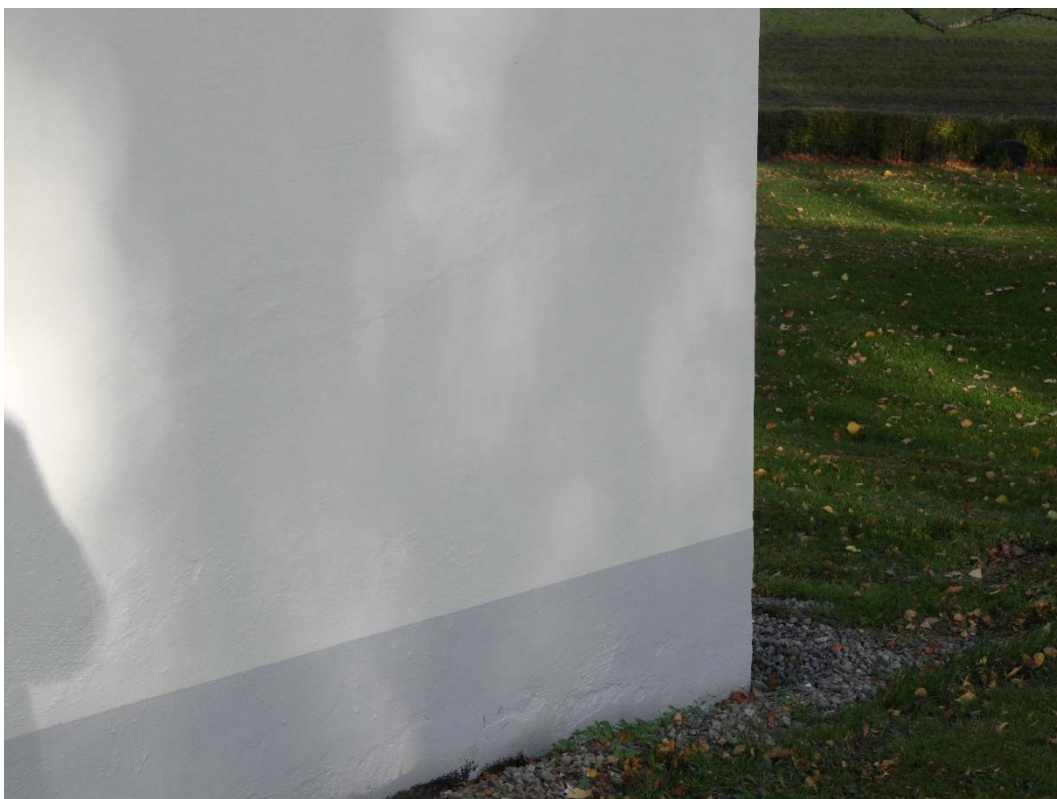
Detaljbild efter fasadrenovering.