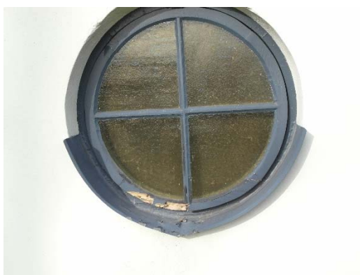
T v: Lagningar på östra fasaden. T h: Lagning och målning av fönstret i östra fasaden görs 2016.