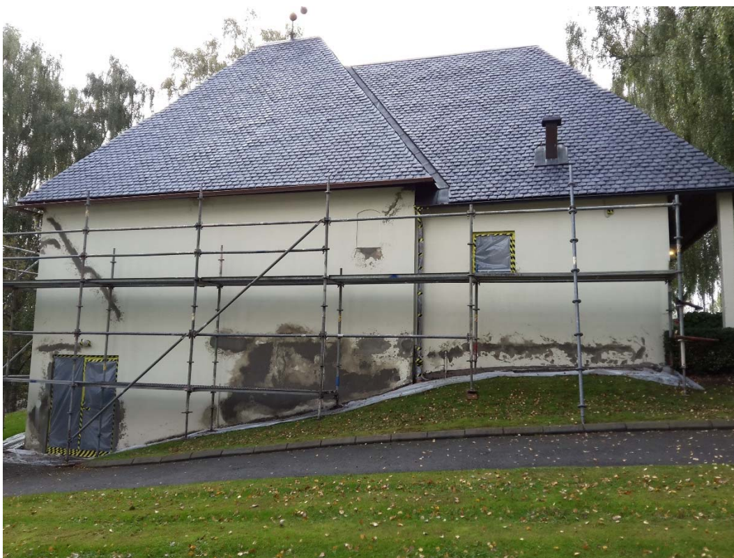
Lagningar på norra fasaden.