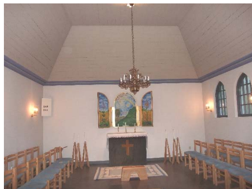
Gusums gravkapell från nordväst och ceremonisalen. Altartriptyken är målad av Märta Afzelius, som är mest känd som en mycket framstående textilkonstnärinna, men som även arbetade i andra tekniker. Foto Östergötlands museum 2002.