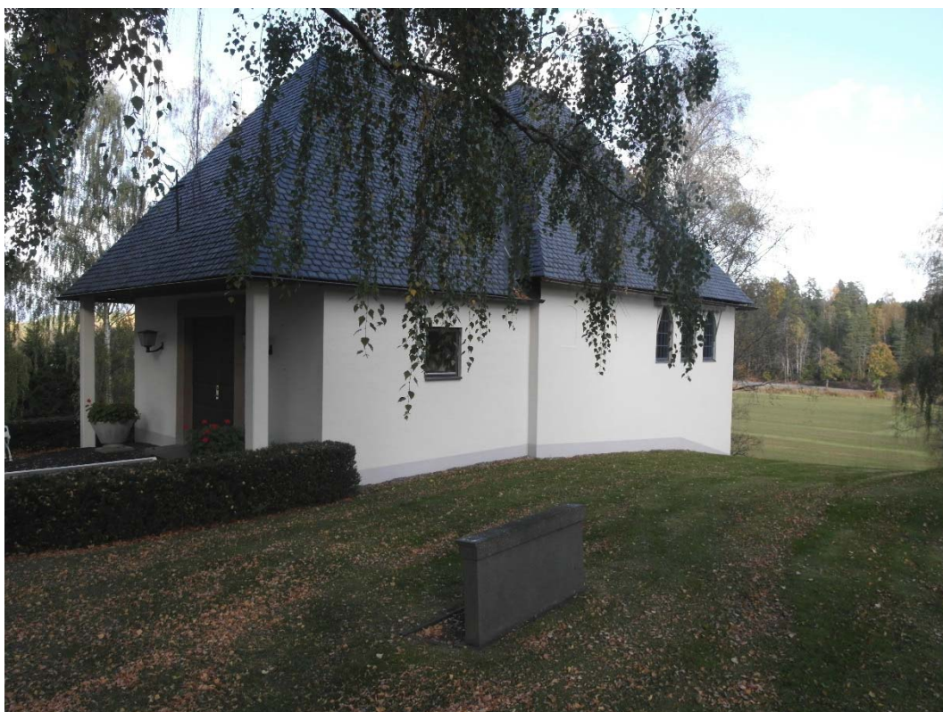
Gravkapellet från sydväst efter fasadrenovering.