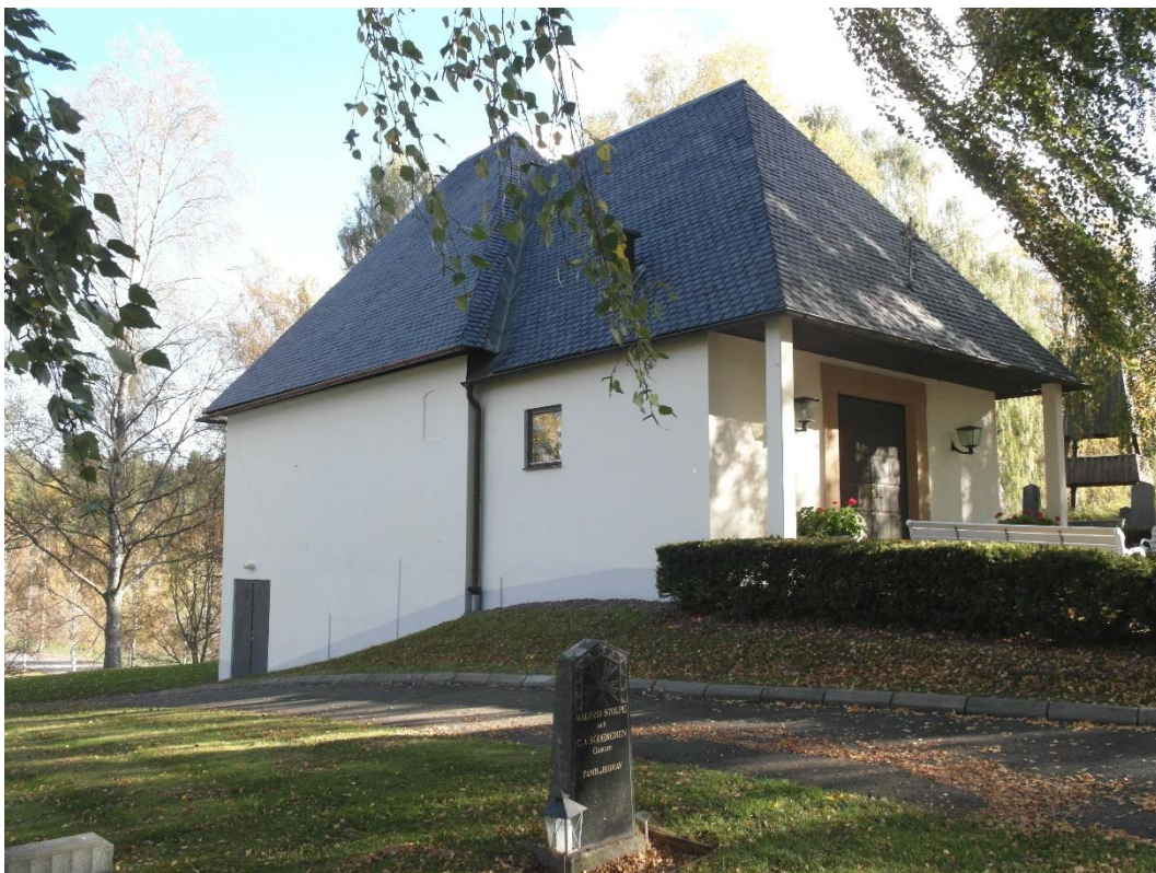
Gravkapellet från nordväst efter fasadrenovering.

projektet och västra delen av byggnaden är uppförd på 1980-talet accepterades att man använde akrylatfärg. Vid en större fasadrenovering ska dock en annan färgtyp användas.