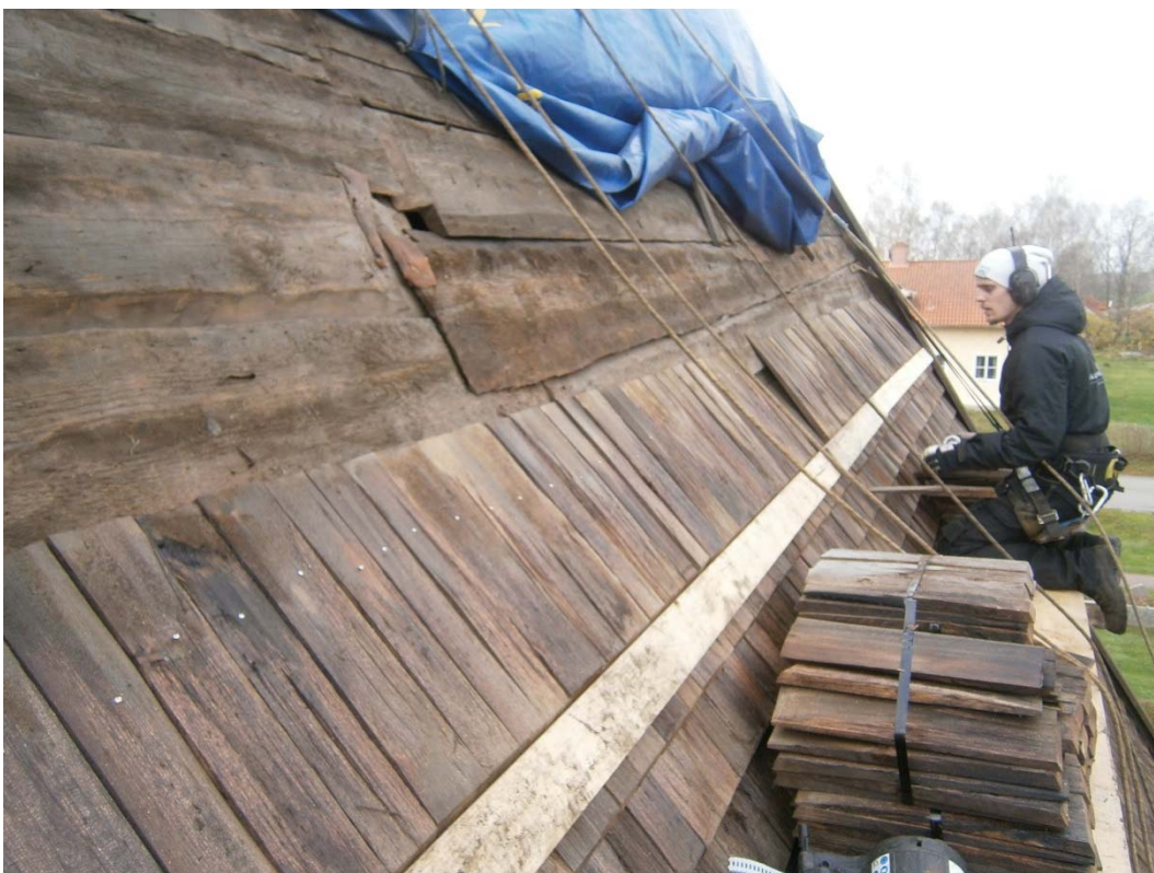
Läggning av takspån på norra sidan.