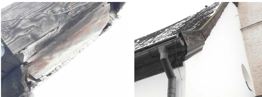
En trasig del av den profilerade takfoten ersattes av en nytillverkad del.

Taktäckningen har genomförts i enlighet med Länsstyrelsens tillstånd och Östergötlands museum kan godkänna utfört arbete ur kulturhistorisk synpunkt.