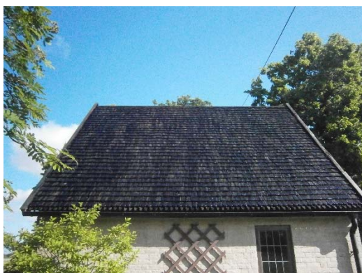
Gravkapellet tjärades.