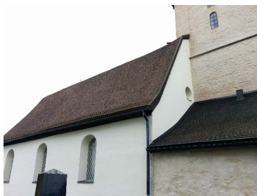
Nytjärade takfall på kyrkans norra sida.