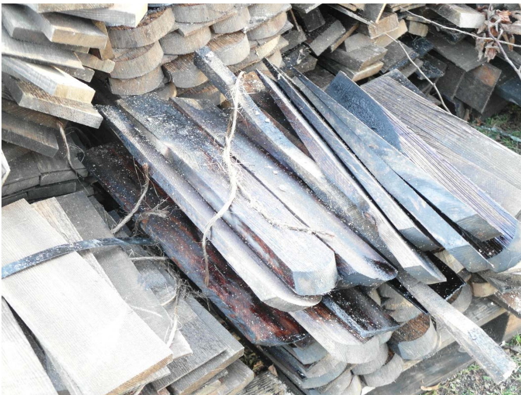
Spjälkade furuspån med avfasad framkant. En av de nedre spånraderna har uddformade spån.

Långhusets båda takfall och korets tak har täckts med spjälkade furuspån. I takfallets brytning ligger ett par lager med något konvexa spån, för att undvika framtida brott på helt flata spån. Skadade delar av taktrönan har ersatts med nytt furuvirke. Skadade takfotsbrädor har bytts liksom en profilerad del av takfoten på norra sidans västfasad. Nya åskledarfästen har monterats.