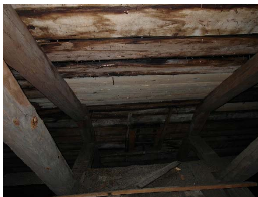
Utbytt del av takfoten. Utbytt del av taktron.