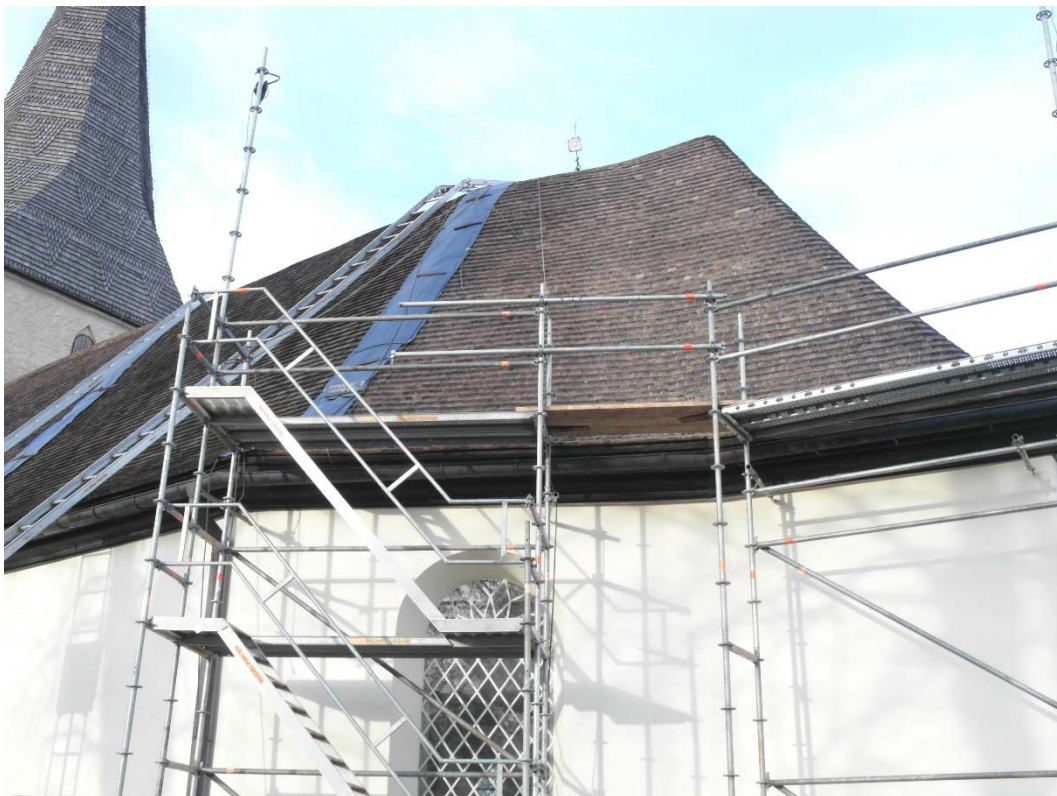
Arbete pågår på södra sidan.

Befintliga takspån var sågade furuspån med rak framkant. Nytt spån är, liksom beslutat, spjälkat furuspån men med fasad framkant. Entreprenören gjorde under tecknad uppmärksam på detta på ett tidigt stadium. Spånleveransen fanns dock redan på plats, arkivstudier om Viby kyrka, genomgång av litteratur om spånläggning och kontakt med länsstyrelsen gav inga uppgifter som motiverade ett antikvariskt ställningstagande mot fasad framkant.