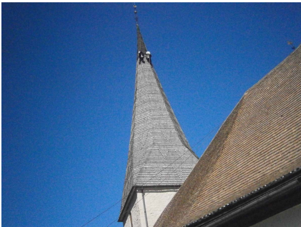
Tjärning av tornet.

Östergötlands museum genom antikvarie Anita Löfgren Ek.