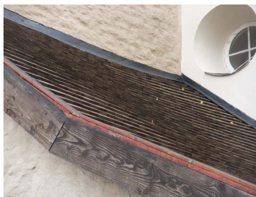
T v: Viby kyrka från nordväst. T h: på tornets sidobyggnader lades sågat furuspån 2011. Foto Östergötlands museum 2011.