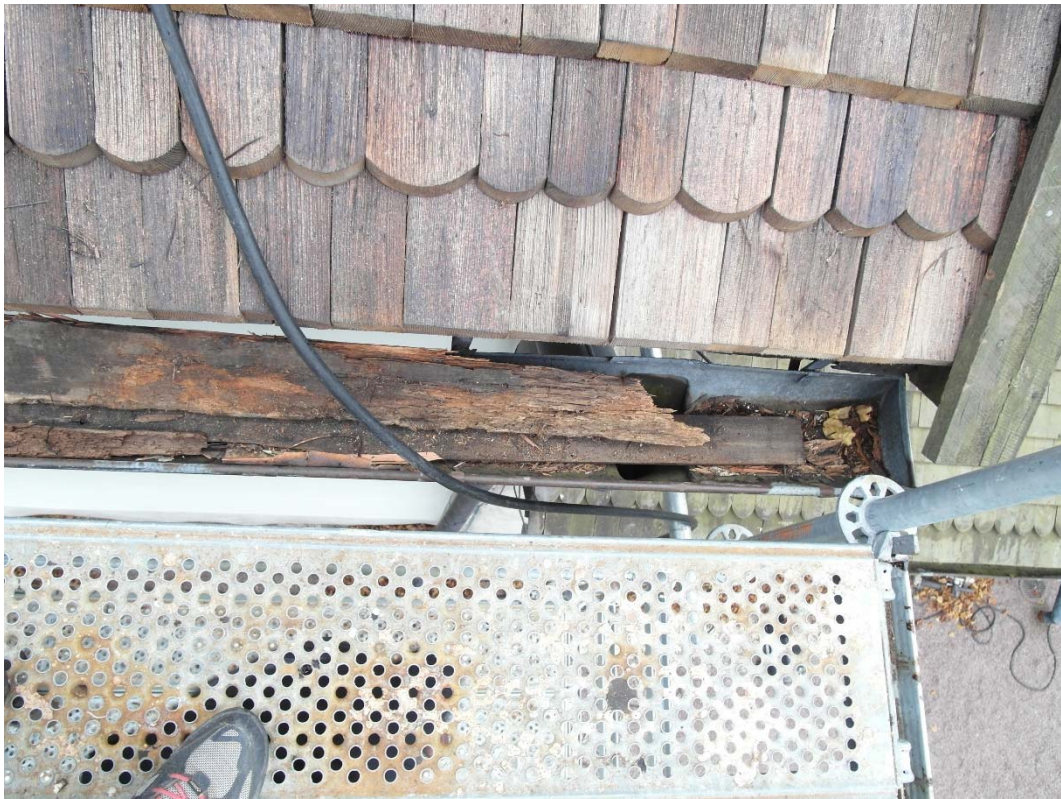
Trasig takfotsbräda som ligger i hängrännan på takets norra sida. Nytt spån är lagt.