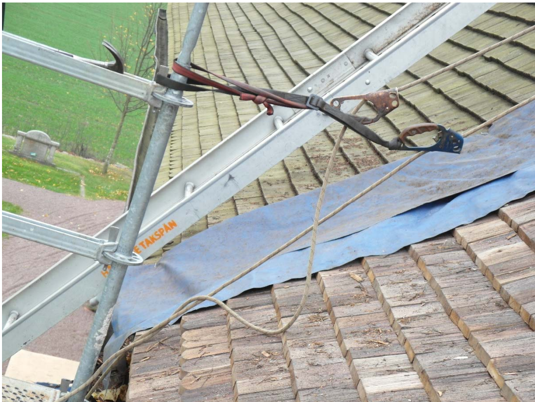
Möte mellan nylagt spån och äldre spån.