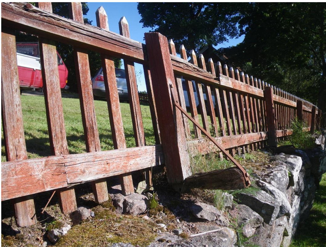
Staketet var mycket rötskadat och stolparna var helt lösa där metallfästen är borta eller där klamparna var rötskadade.

Tingshuset ligger på en höjd med en uppbyggd stenterrass mot väster. Terrassen kantas av ett falurött spjälstaket. Virket var rötskadat och infästningar var lösa varför staketet lutade kraftigt och var farligt för besökare. Varningsskyltar sattes upp för att förhindra olyckor innan arbetet slutfördes.