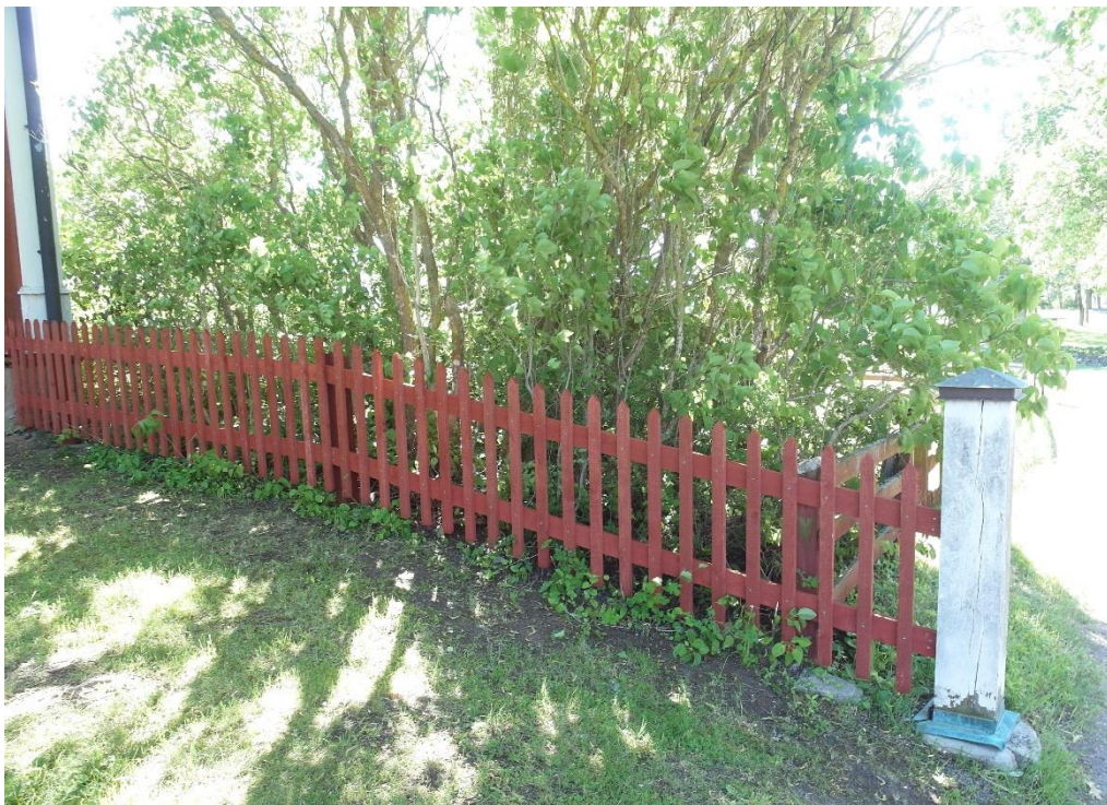
Det nya staketet mellan Tingshuset och infarten.