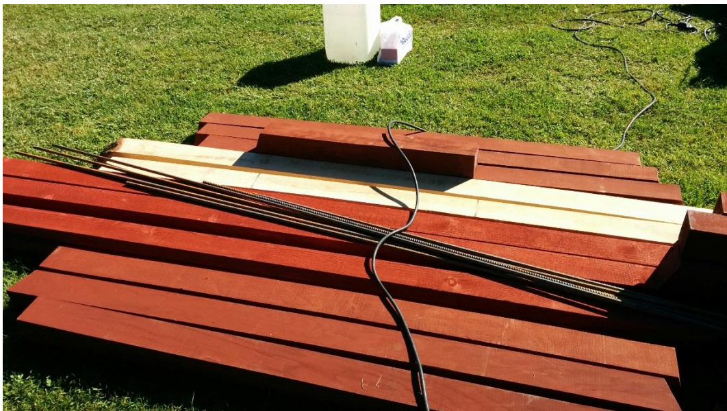
Virket är målat med röd slamfärg, även den sidan som är dold av stolpar och spjälor.