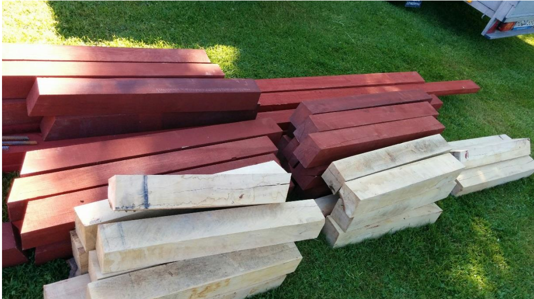
Virket till staketet är på plats.