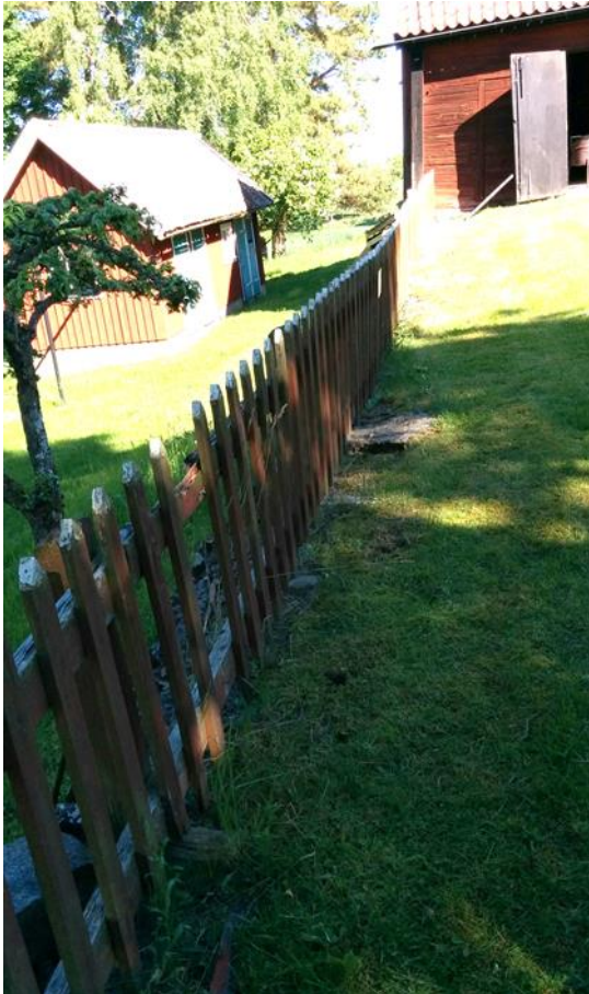
Staketet var rötskadat och saknade flera spjälor.