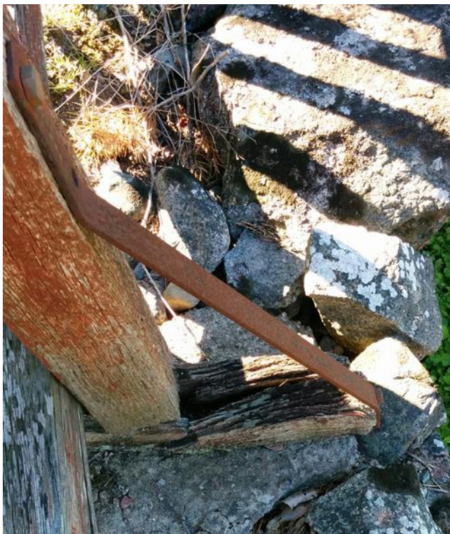
Rötskadad klamp av ek.