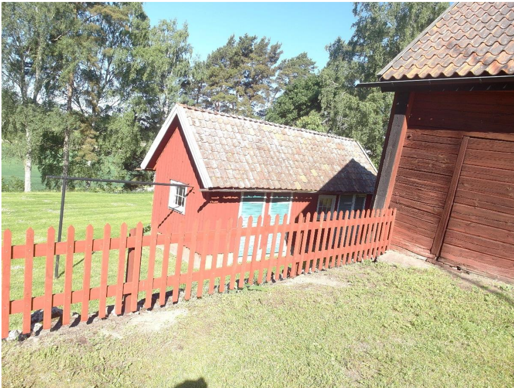
Det nya staketet, sett från gårdsplanen.