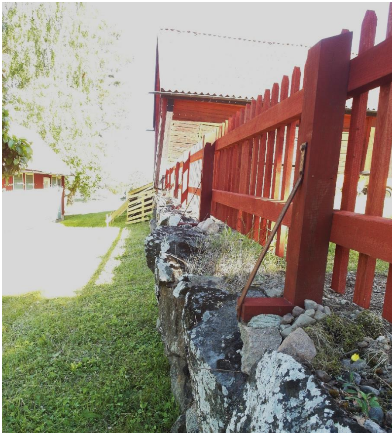
Staketet med nytt material men med återanvända järn.