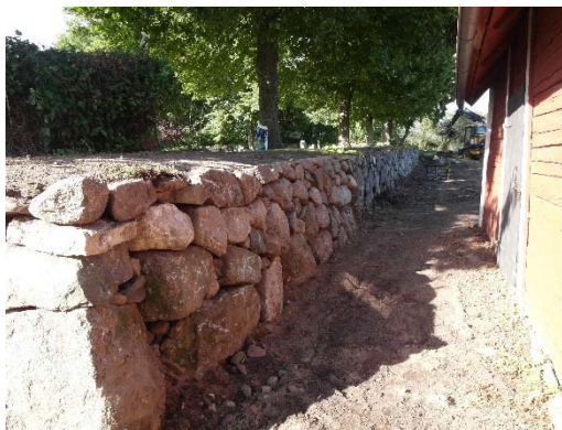
Den södra murens östra del är lagd med ett mer varierat stenmaterial och övergår i östra muren, som i vissa partier är lagd med obearbetad sten.

Den östra stödmuren är ca 1,5 - 2,0 m hög, mer oregelbunden och innehåller partier med obearbetad sten och partier med kluven sten. Norra muren är till största delen en fullmur, ca 1,3 m bred och består av stora obearbetade och kluvna stenblock med en del spår efter skjutsöm. Murhöjden avtar mot väster där muren övergår till en stödmur. Den äldsta bogårdsmuren finns kvar i den norra kyrkogårdsmuren. (Bogårdsmurar i Linköpings stift. 2004)