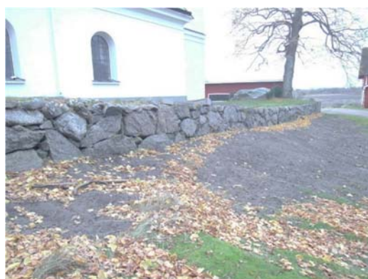
T v: Del av norra murens insida efter omläggning. T h: norra murens östra del, där muren har övergått till stödmur.