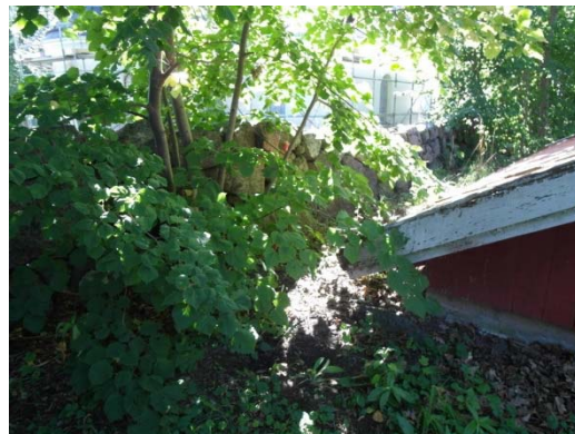
Fotografierna visar insidan respektive utsidan av norra muren innan reparation. Källaren utanför muren hör till det f d ryttmästarebostället.