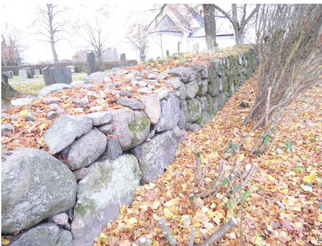
Norra murens östra del efter omläggning.