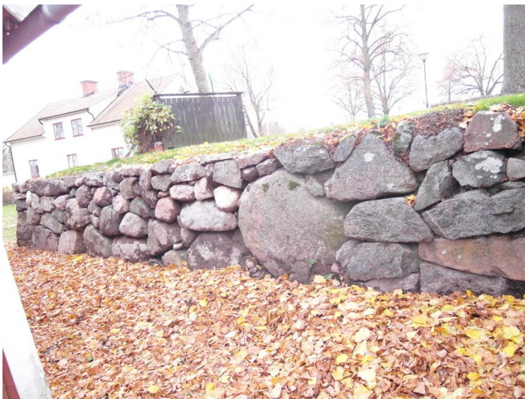
Östra murens södra del efter omläggning.

Östergötlands museum genom antikvarie Anita Löfgren Ek.