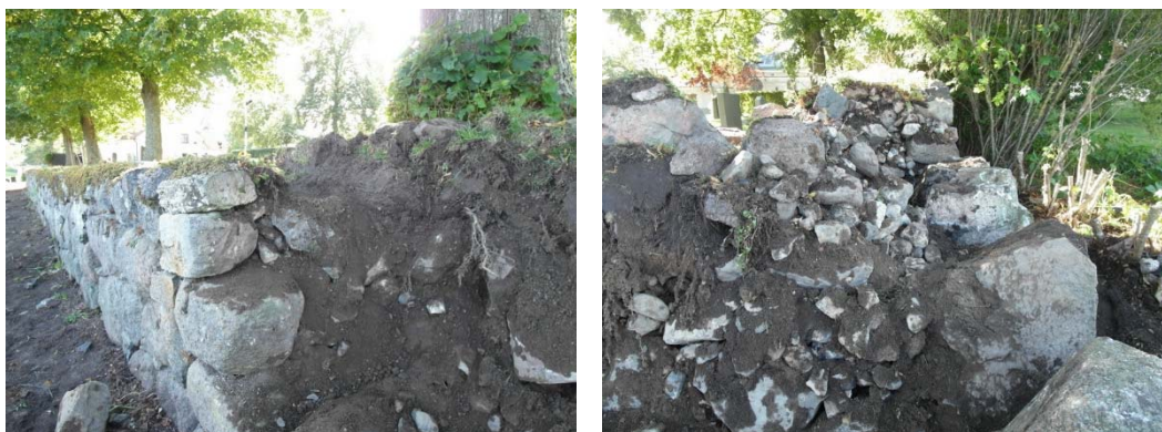
Nordöstra murhörnet mot söder, respektive väster.

Där stödmuren har plockats ner lades ett lager makadam, 32/64, som dränerande material. I de tekniska föreskrifterna anges fraktionen 16/32, men entreprenören har valt att gå upp i storlek. En geoduk skiljer makadam från bakomliggande jord.