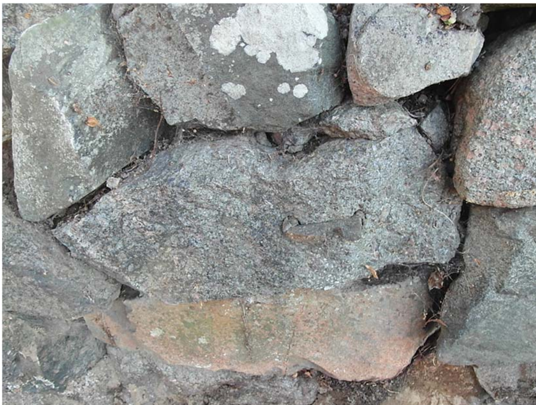
Stenen i den östra muren är återanvänd och har tidigare troligen suttit i en grindöppning.