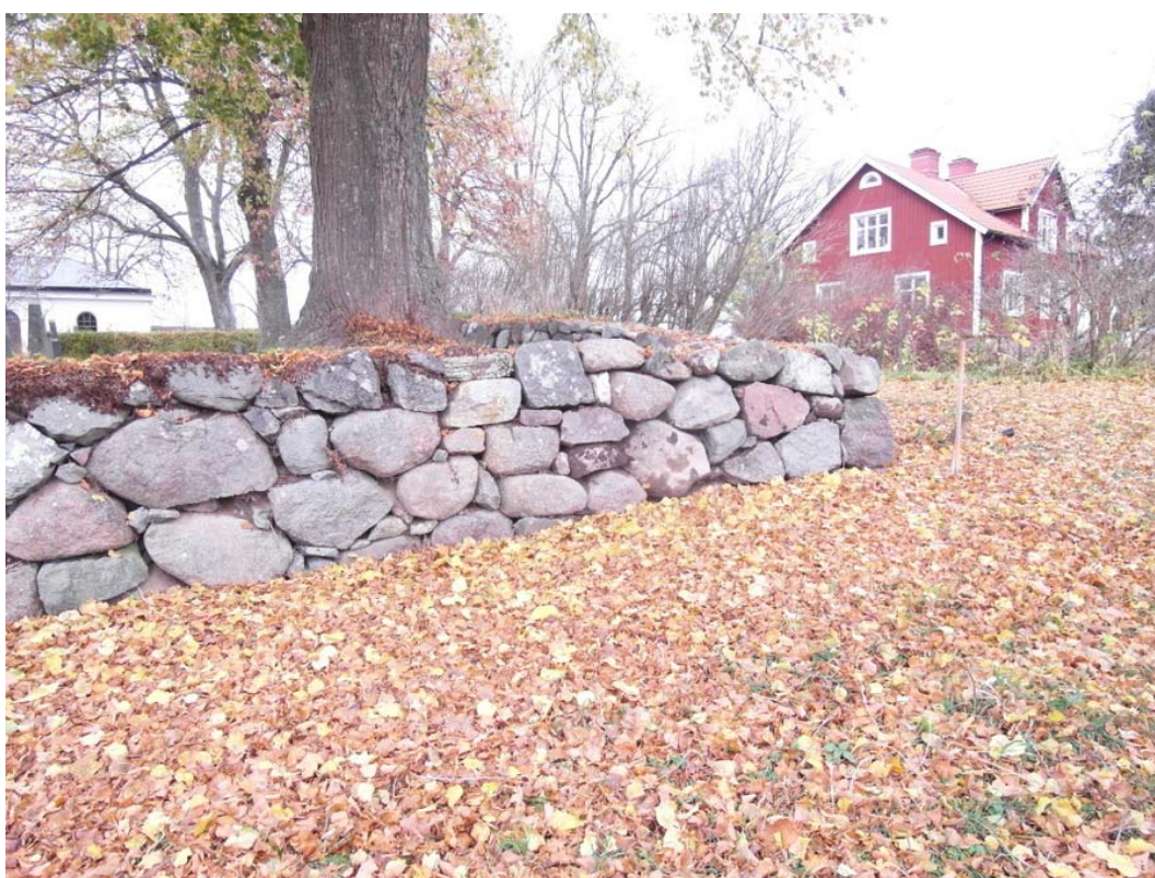
Östra murens norra del. Här är själva murhörnet omlagt.