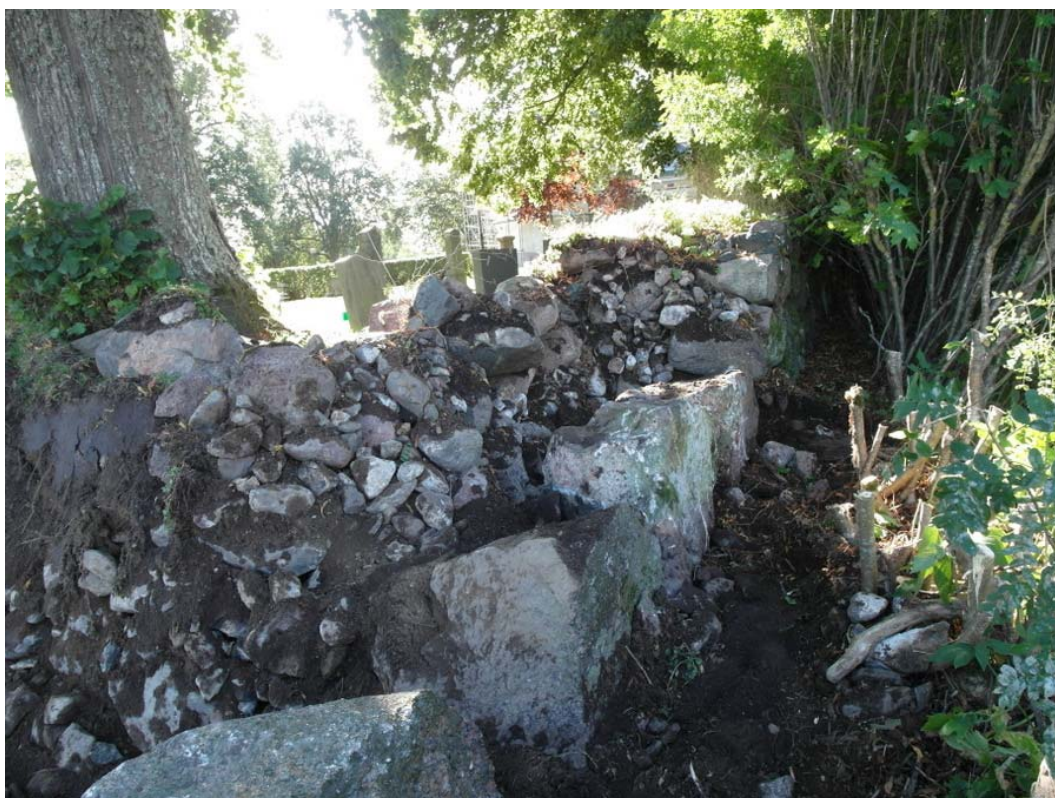
Sträcka N1, norra muren närmast nordöstra hörnet. Muren är en skalmur med en kärna av jord och småsten. I nordöstra hörnet övergår muren till en stödmur, se foto ovan.