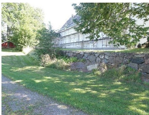
T v: Norra murens östra del från insidan. Det är en fullmur med enstaka stenar med skjutsöm. T h: Norra murens västra del från utsidan. Här är muren en stödmur med större andel kluven sten än i östra delen.