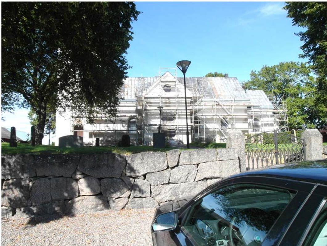
Södra murens västra del är uppbyggd som den västra muren. I bilden syns en sten med klyvsöm.