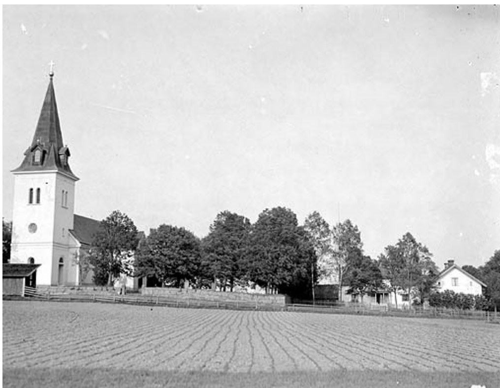
Östra Hargs kyrka och kyrkogård från väster.

Östra Hargs kyrka och kyrkogård ligger i det öppna landskapet söder om sjön Roxen, ca 1 mil nordöst om Linköping. Söder om kyrkogården ligger flera skolbyggnader och norr om kyrkogården ligger Hargs flera ryttmästareboställe.