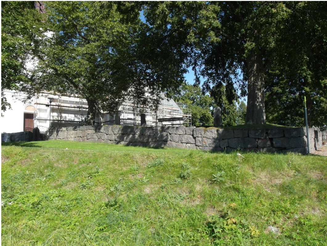
Västra murens södra del med kluven och bearbetad sten.