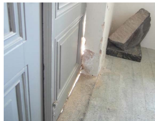
T v: Gången från västra grinden är kantad med murar i fallande höjd. Murarna är lagda med bearbetad gråsten och kalkstensskivor. T h: Innanför torningången står ett runstensfragment som hittades i bogårdsmuren på 1940-talet.