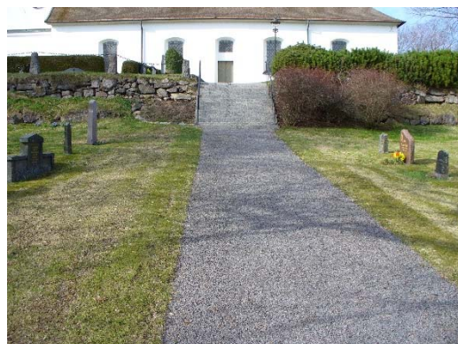
T v: Ingången till bisättningsrummet i södra muren. T h: Den södra huvudgången leder fram till kyrkans södra ingång.