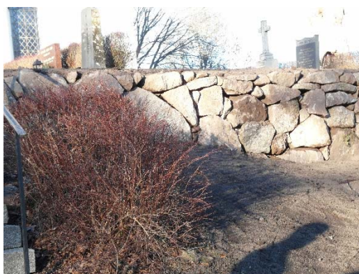
Huvudmur och stödmur efter omläggning.