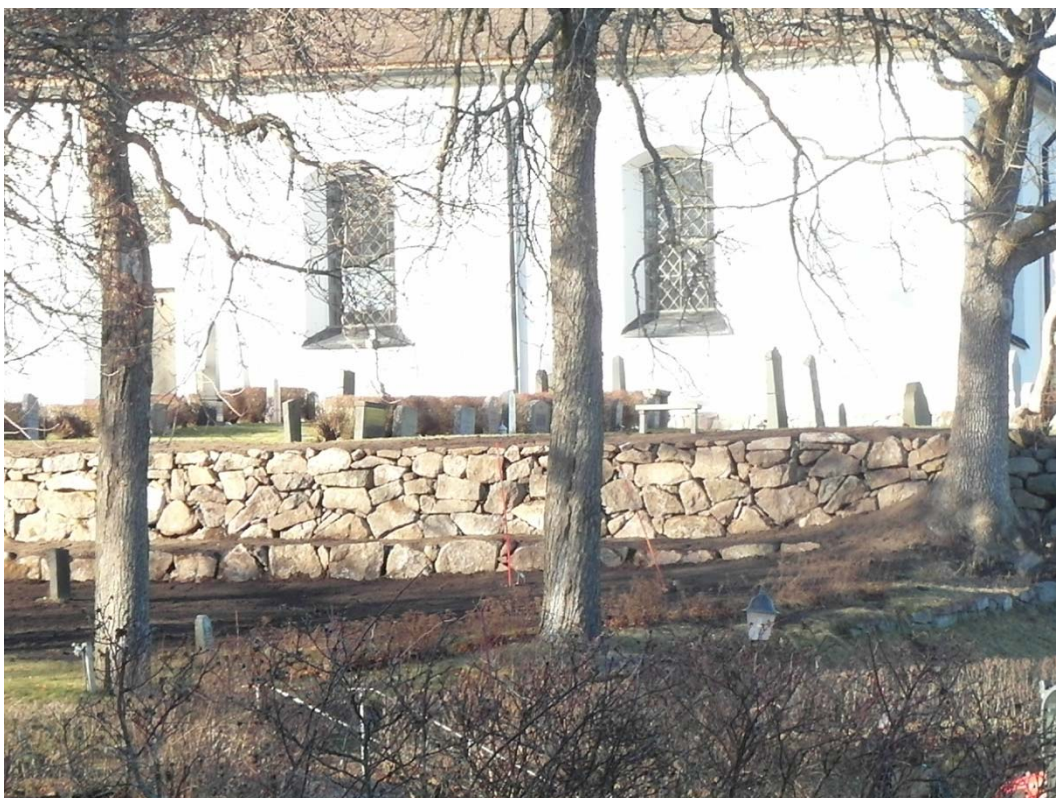
Muren efter omläggning.