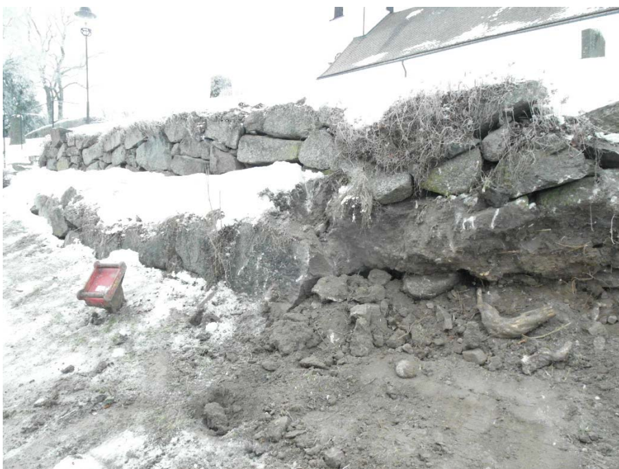
Södra muren öster om trappan. Delar av stödmuren ligger ännu kvar under snön.

Den södra muren har plockats ner mellan södra trappan och sydöstra murhörnet. Även stödmuren framför huvudmuren plockades ner på samma sträcka. Bakom