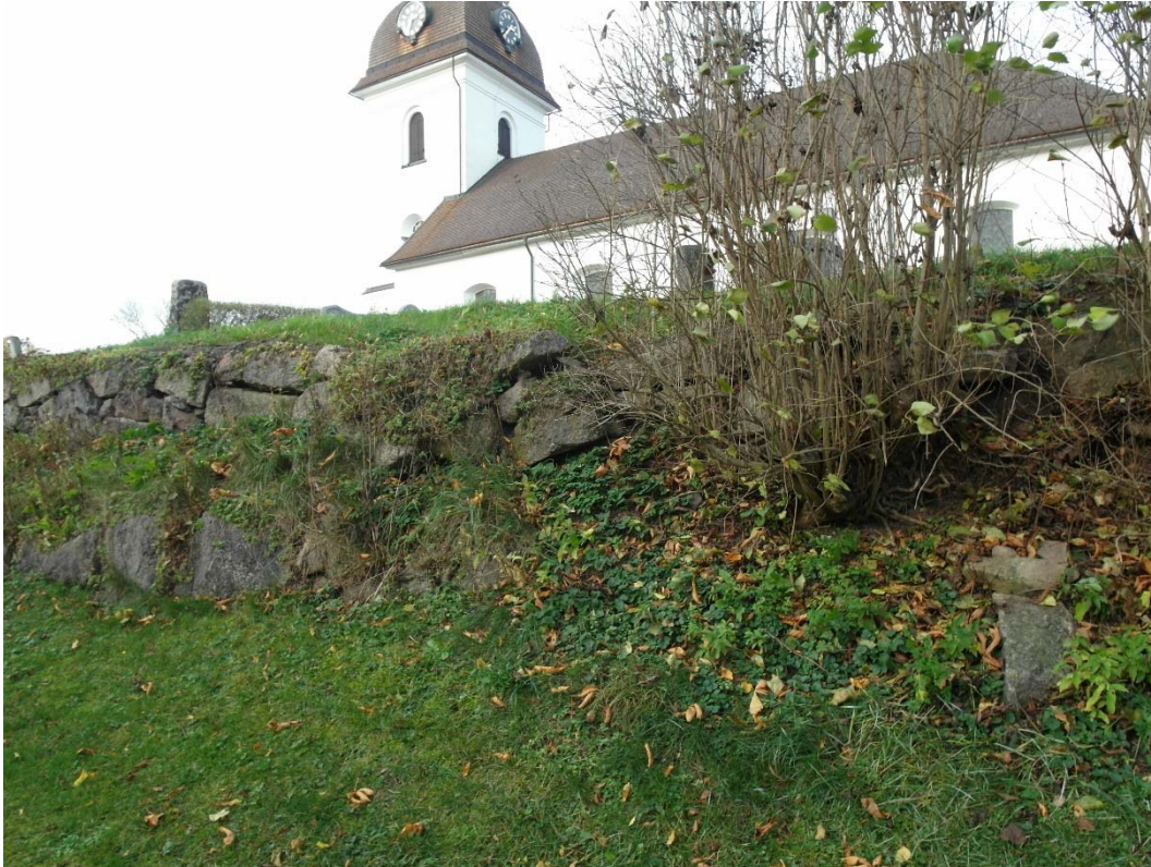
Södra muren hade delvis rasat i östra delen. På bilden syns även stenar som hör till den lägre stödmuren. Foto Östergötlands museum 2014.