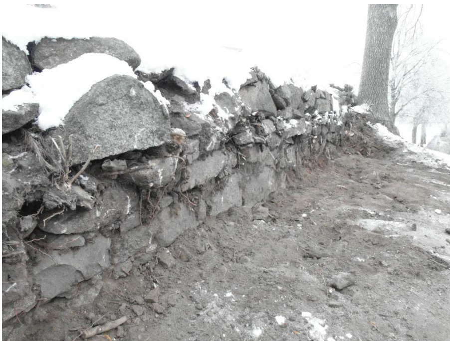
Den låga stödmuren har grävts bort. Man ser tydligt att murverket i murens lägre delar ligger mer ordnat än i den övre delen.