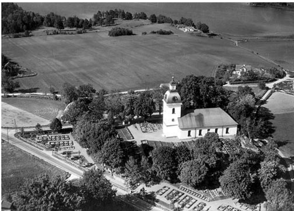
Flygbilden från 1961 visar Tjärstad kyrka från sydväst.

Tjärstad kyrka ligger på en höjd, ca 3 km sydöst om Rimforsa samhälle. Den äldsta kända kyrkan på platsen var en rundkyrka av sten. Den uppfördes sannolikt under 1100-talets andra hälft och är en av tre kända rundkyrkor i Östergötland. Rundkyrkan revs i samband med att en ny kyrka uppfördes på samma plats. Den nya kyrkan invigdes 1778, men tornet byggdes först ca 20 år senare.