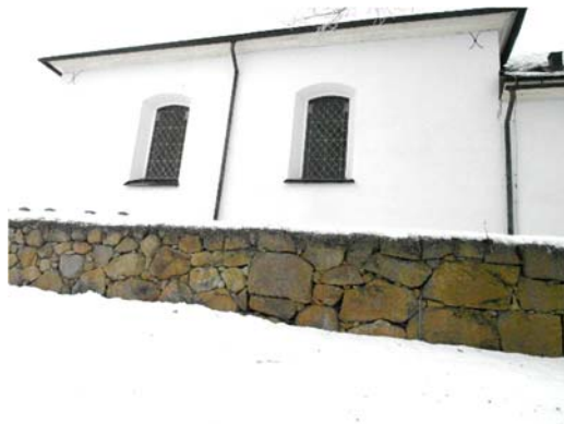
Den östra muren kan delas in i tre delar. T v: Längst i söder är muren uppbyggd av naturklivna stenar och därpå av mindre och rundare gråsten. T h: Den norra delen är uppbyggd av större klivna stenar.