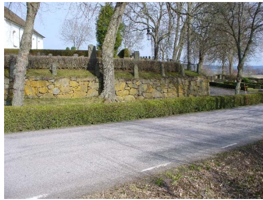
Norra respektive västra muren. På den västra mursträckningen syns en avgränsning med pollare och kätting, som sedan fortsätter på södra muren fram till trappan.