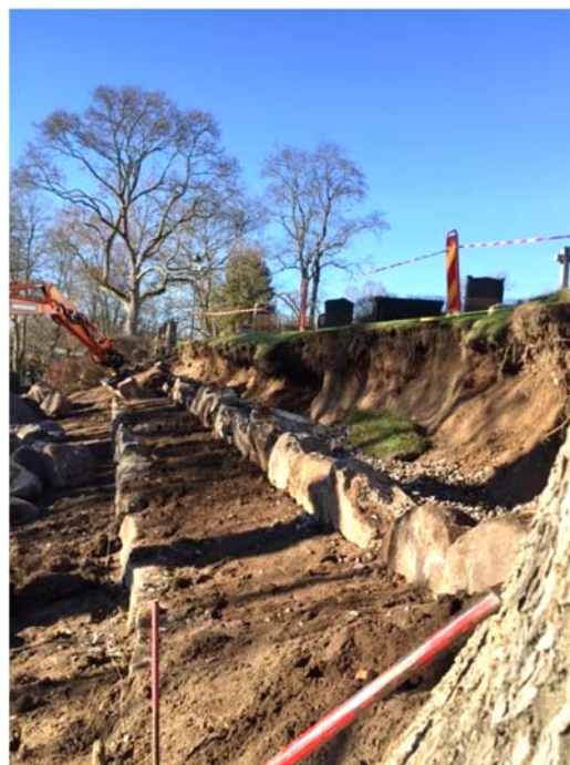
Nytt fyllnadsmaterial läggs bakom ytermanteln på både stödmur och huvudmur. Överst i stödmuren läggs ett lager jord.