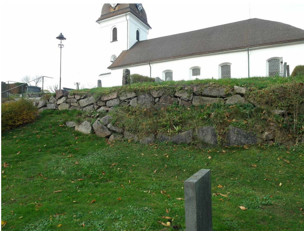
Renoveringen har gällt den södra murens östra del. Framför huvudmuren ligger en lägre stödmur.