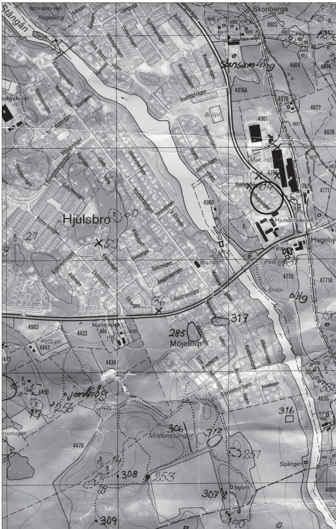
Figur 2. Utdrag ur Ekonomiska kartans blad 085 48 (8F 4i Blästad) med undersökningsområdet markerat.