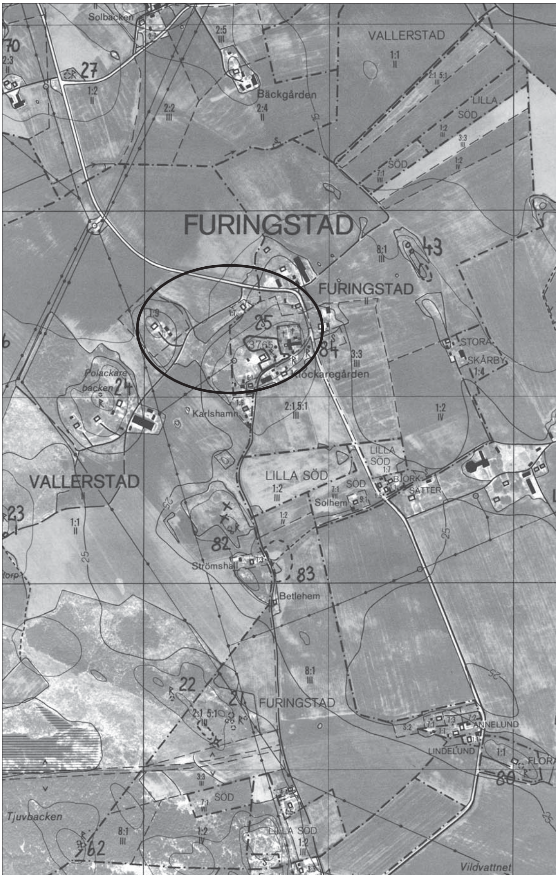
Figur 2. Utdrag ur Ekonomiska kartans blad 086 86 (8G 8g Furingstad) med undersökningsområdet markerat.