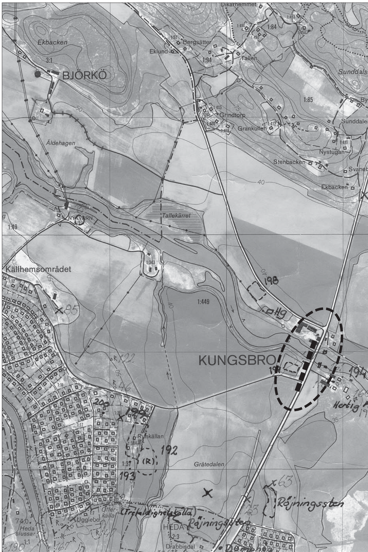
Figur 2. Utdrag ur Ekonomiska kartans blad 085 76 (8F 7g Ljungsbrosjön) med undersökningsområdet markerat.