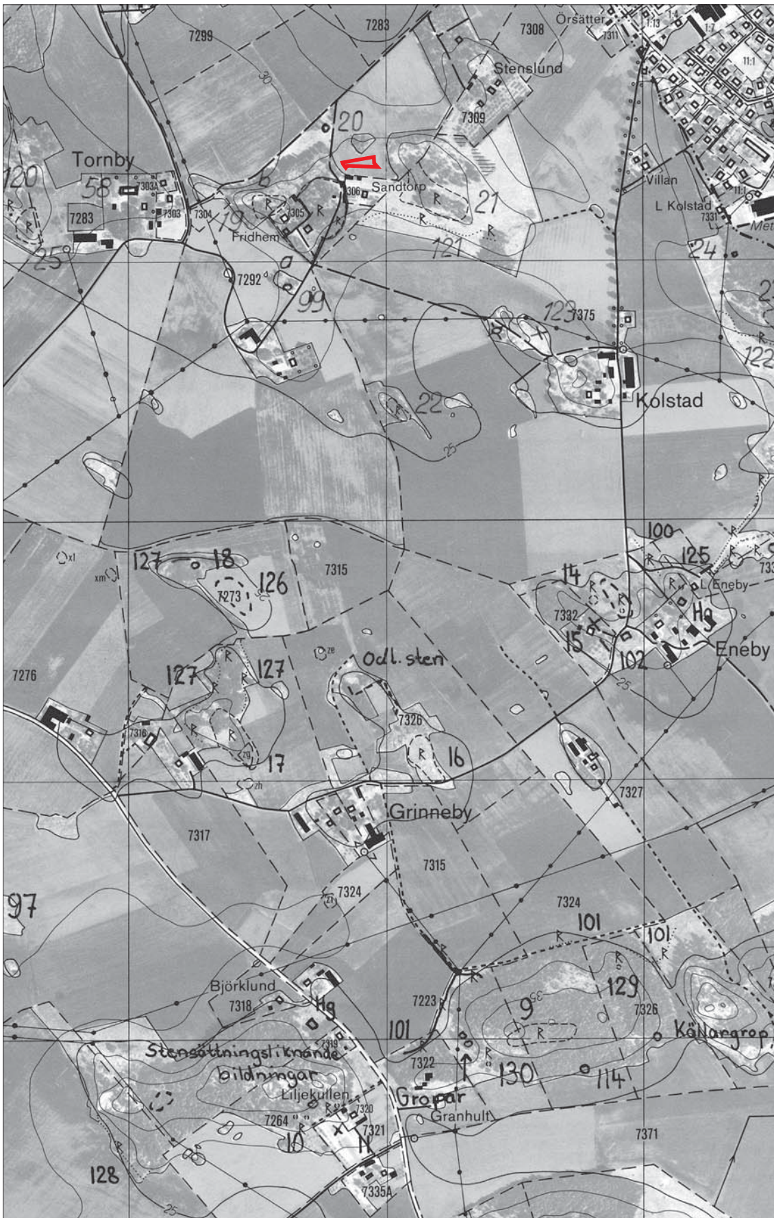
Figur 2. Utdrag ur Ekonomiska kartans blad 086 85 (8G 8f Styrstad) med utredningsområdet markerat.