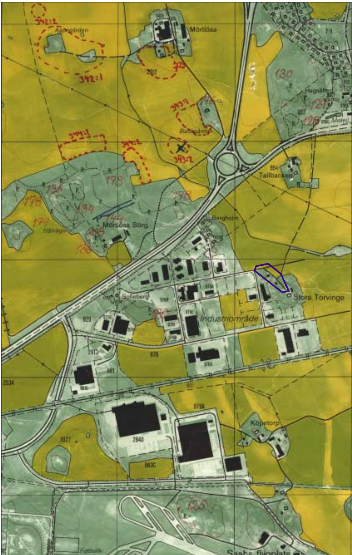
Figur 2. Utdrag ur Ekonomiska kartans blad 085 58 (8F5i Tannefors) med utredningsområdet markerat.