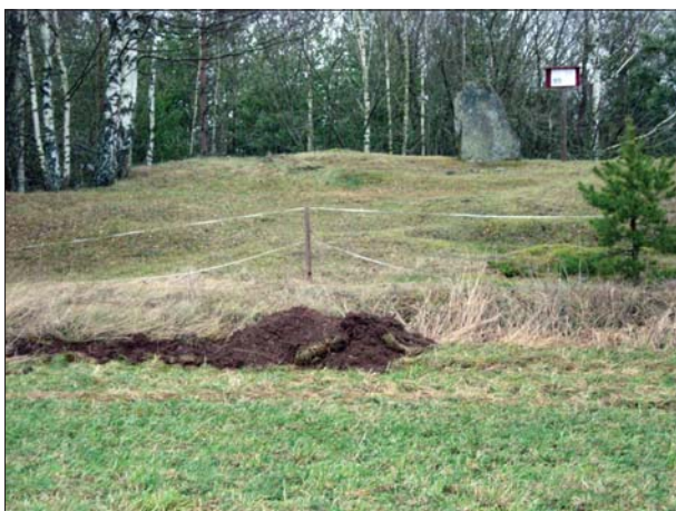
Figur 3. Schakt intill runstenen RAÄ 7.

I nära anslutning till den planerade byggnationstomten finns ett flertal kända fornlämningar. Dessa utgörs av en runsten (RAÄ 7) och ett gravfält (RAÄ 9) som består av 21 runda stensättningar och en rest sten(?).