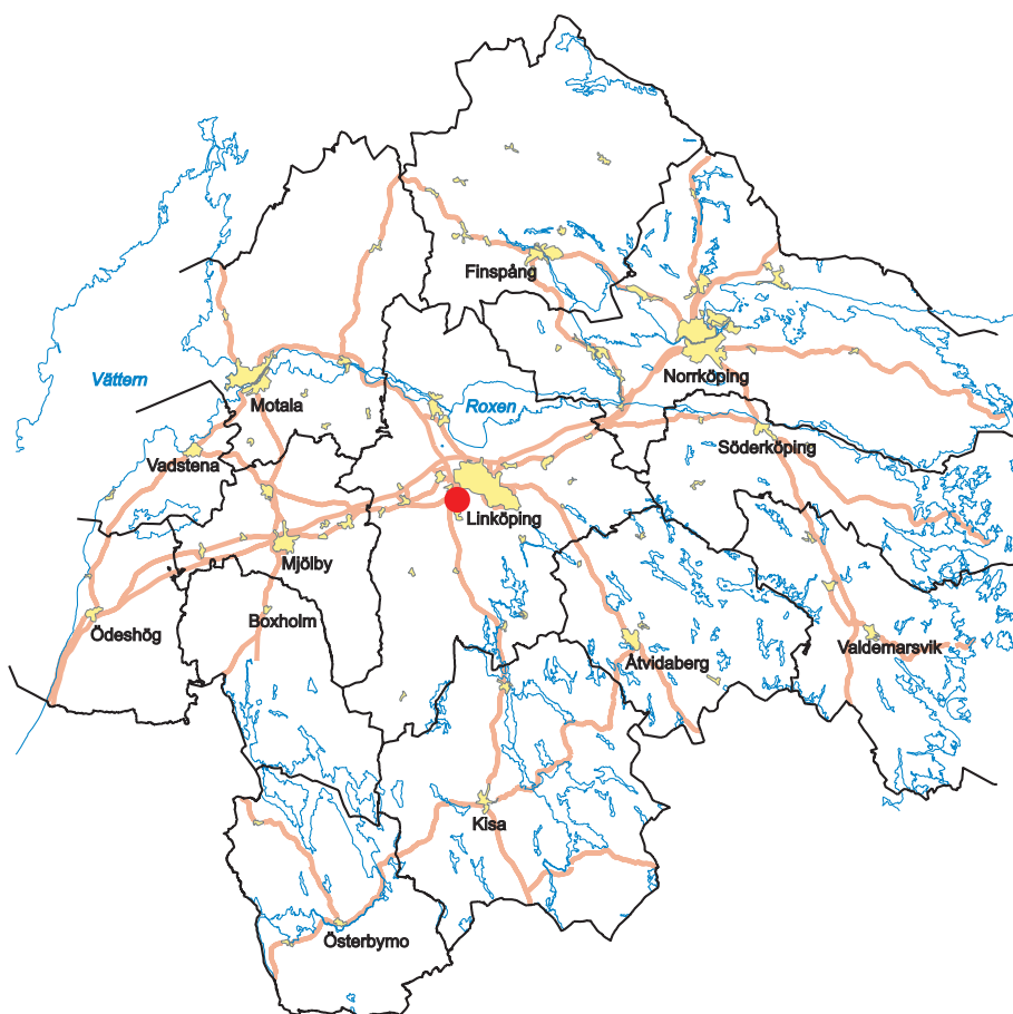
Figur 2. Utdrag ur Fastighetskartan. Skala 1:5 000.