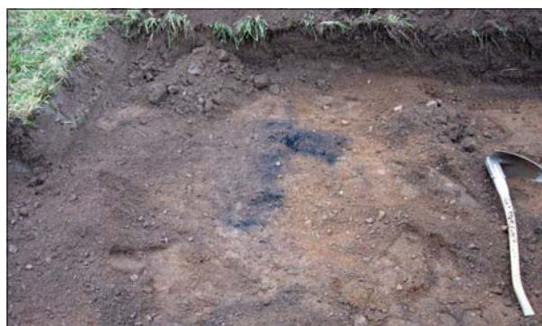
Figur 4. Hårdbotten (anl 1).

Inga ytterligare fornlämningar påträffades. Det arkeologiska arbetet är därmed avslutat.