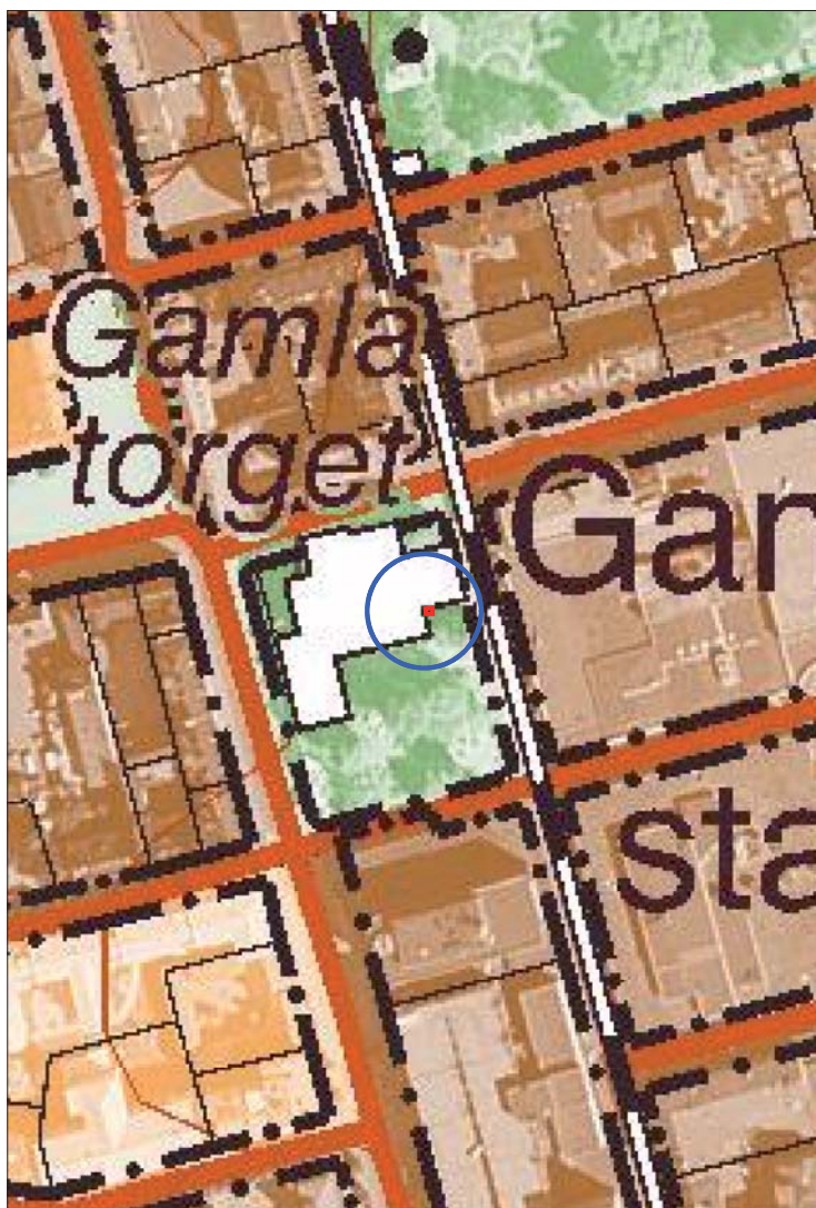
Figur 4. Schaktplan. Skala 1:2500

Den antikvariska kontrollen genomfördes i samband med schaktningen. Schaktet dokumenterades på en översiktsplan och genom beskrivning.