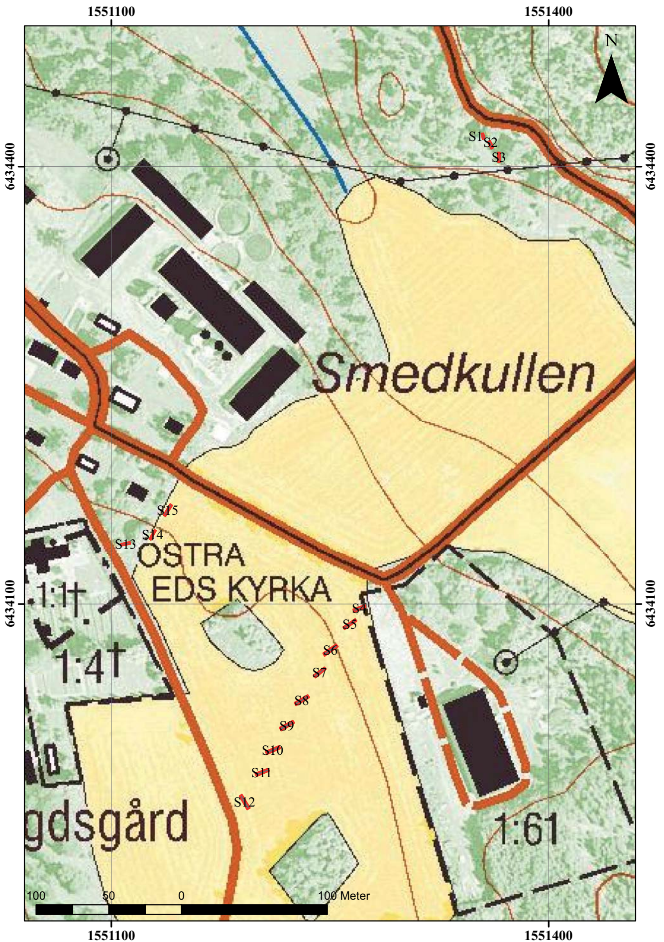
Figur 3. Översiktsplan över det aktuella området med söschakten S1-S15 markerade.