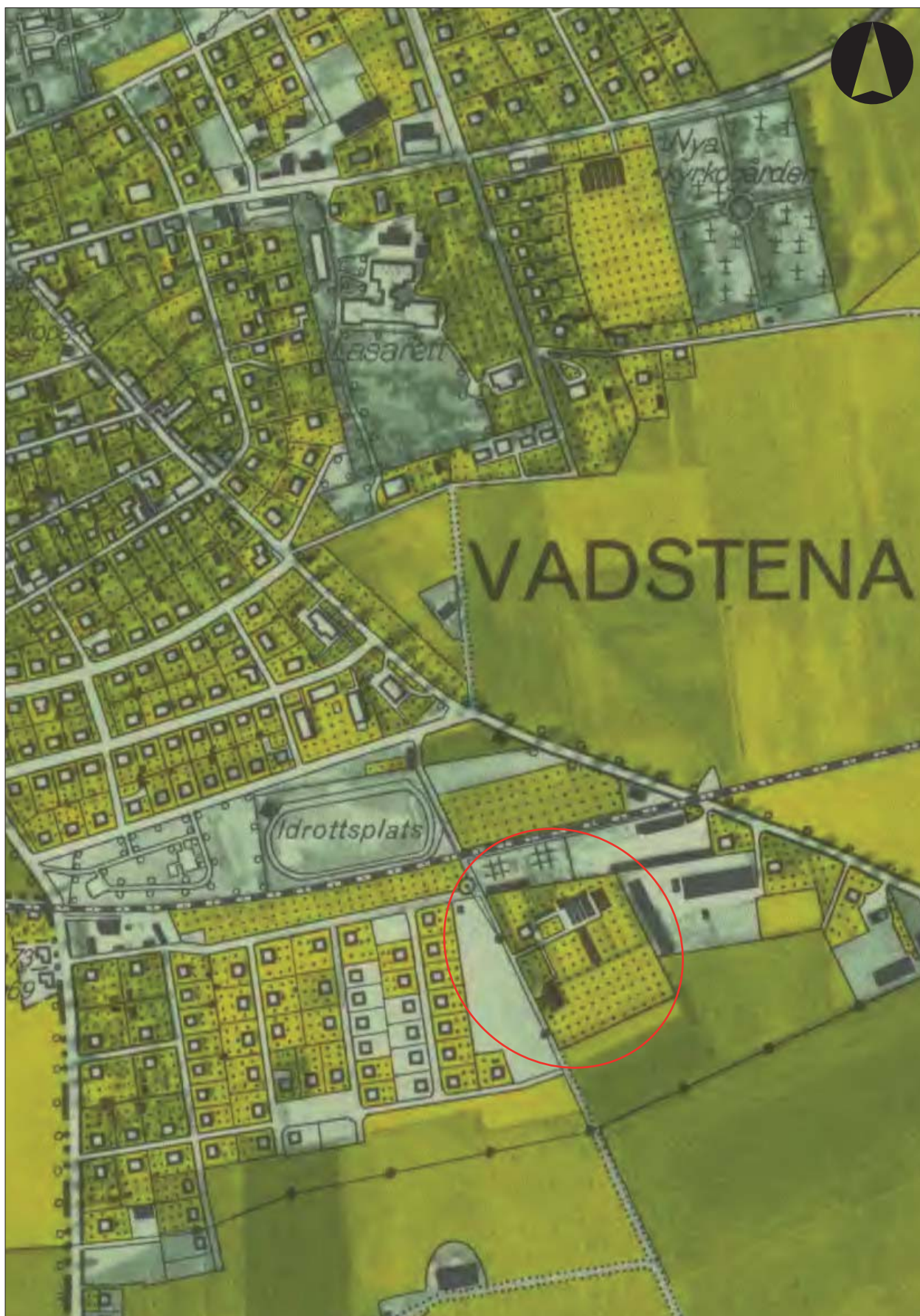
Figur 3. Utdrag ur Ekonomiska kartan från 1948 med utredningsområdet markerat.