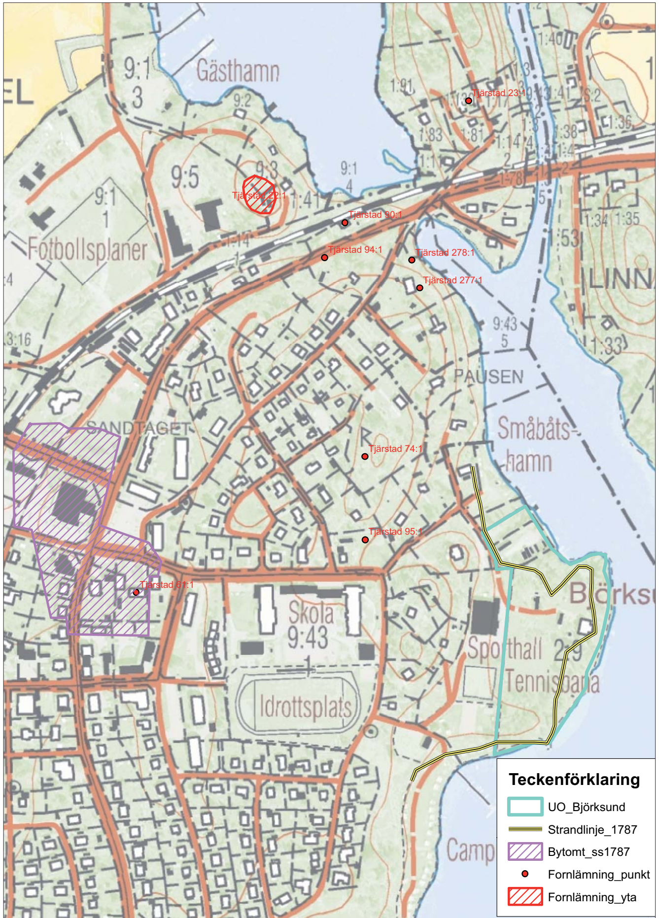
Figur 3. Översiktskarta över utredningsområdet med aktuella lämningar markerade. Skala 1:4 000