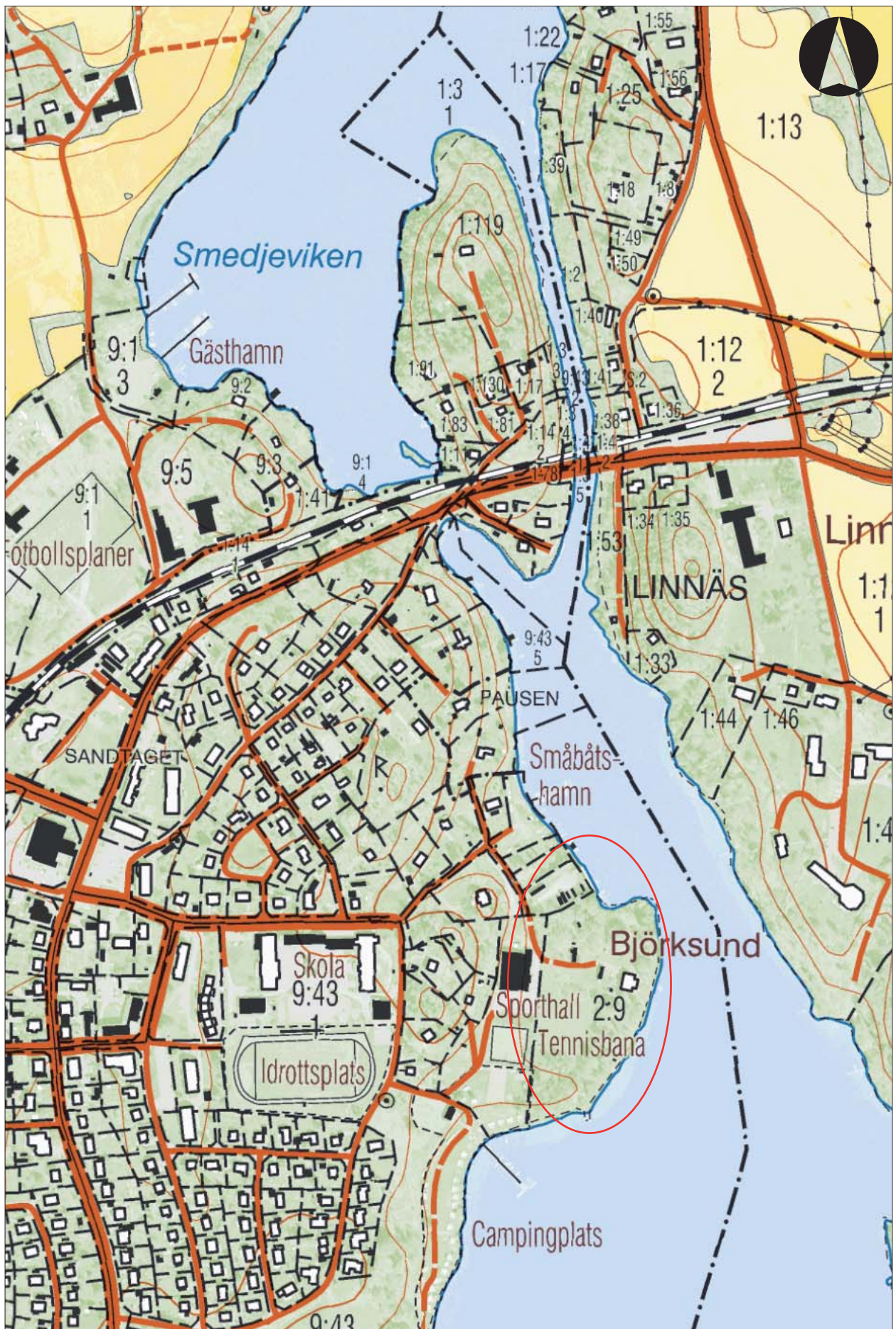
Figur 2. Utdrag ur digitala Fastighetskartan med utredningsområdet markerat. Skala 1:5 000.