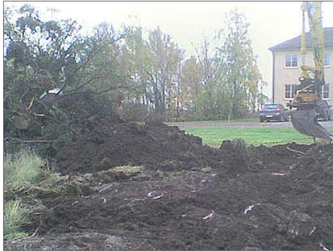
Figur 4. Frilagda berghällar nedanför RAÄ 159, mot S.