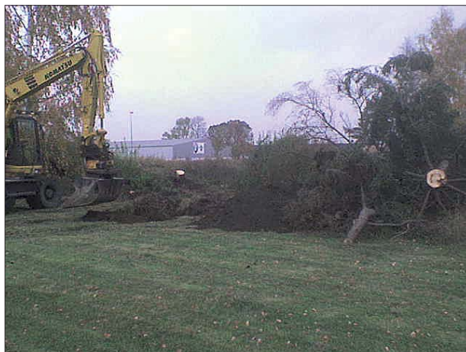
Figur 6. Den stormfällda granen som täckte undersöknings- ytan intill skålgropshällen kapades i mindre bitar innan schaktning kunde genomföras. Foto mot N.