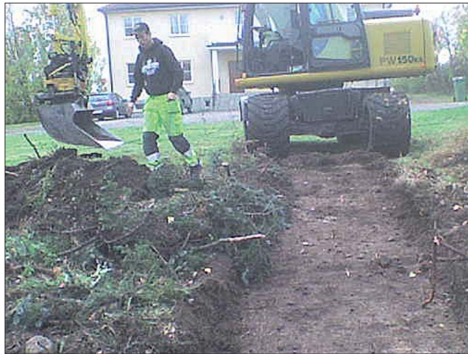
Figur 5. Det sydvästliga mindre schaktet. I bakgrunden grusplanen och "Direktörsvillan", mot S.