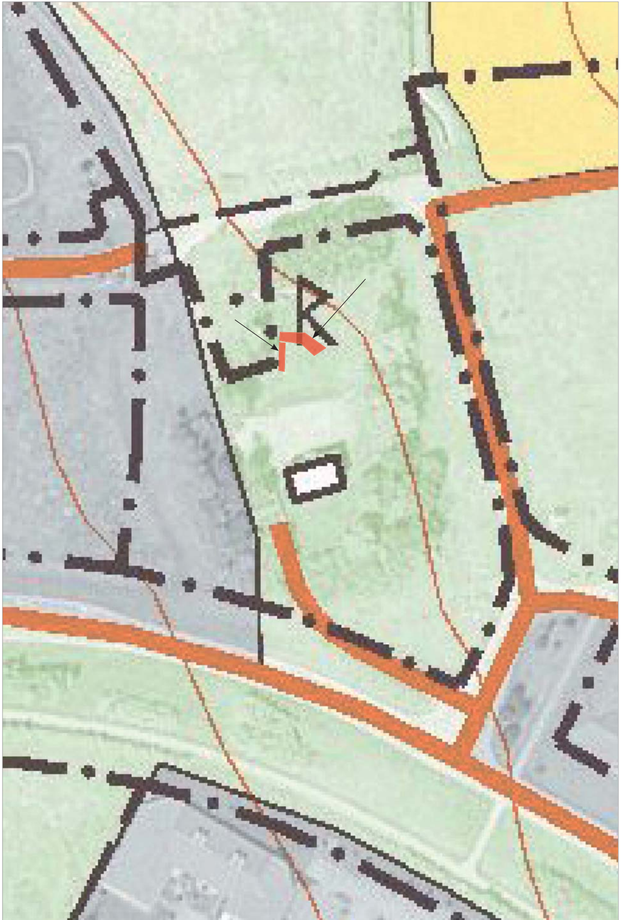
Figur 3. Utdrag ur digitala Fastighetskartan med schakten markerade. Skala 1:1 000