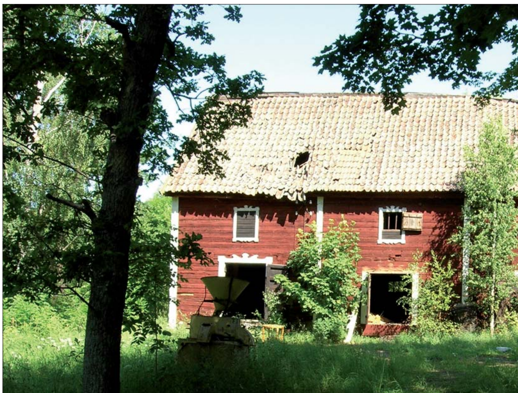
Figur 3. Den aktuella magasinsbyggnaden sedd från söder.