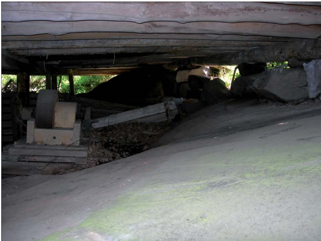
Figur 5 och 6. Vid undersökningen kontrollerades hällarna under magasinsbyggnaden.