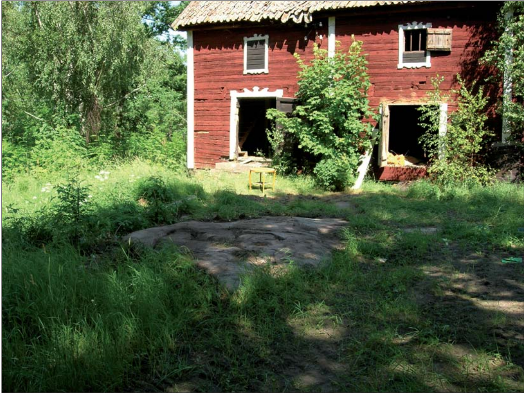
Figur 7. Flera hållar var även synliga framför magasinsbyggnaden.