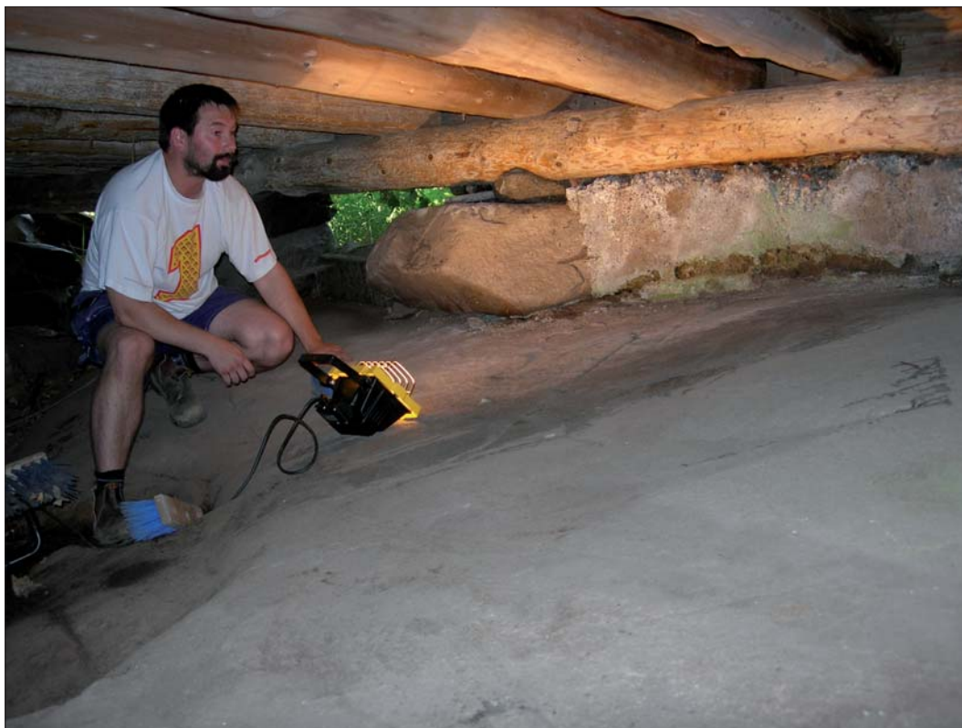
Figur 4. Rengöring av hållen och belysning med släpljusteknik.

Ortnamnsregistret http://www.sofi.se/ortnamnsregistret