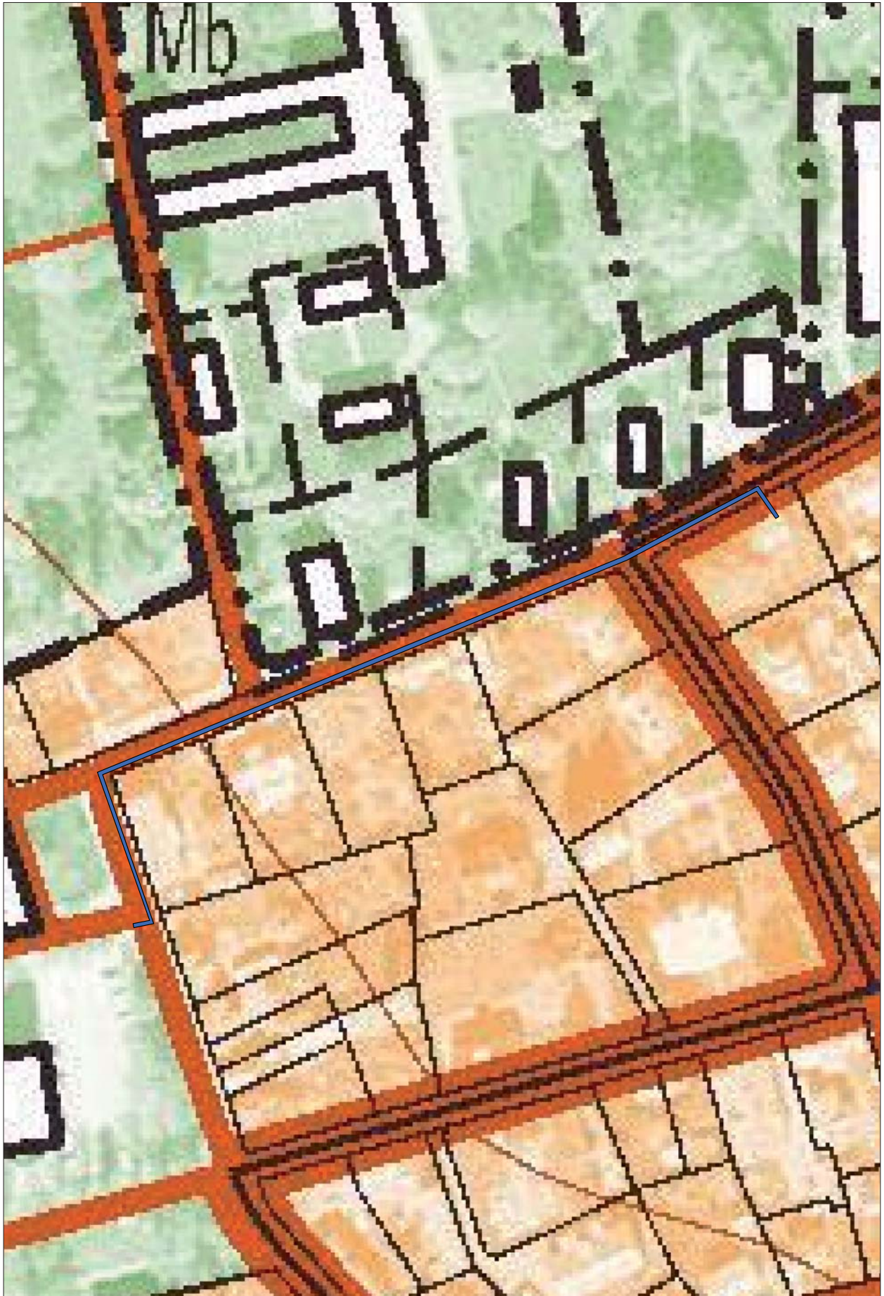
Figur 3. Utdrag ur digitala Fastighetskartan med aktuell schaktsträcka markerad.