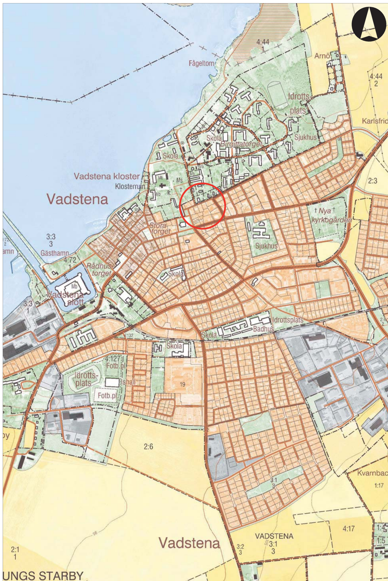
Figur 2. Utdrag ur digitala Fastighetskartan med undersökningsområdet markerat. Skala 1:10 000.