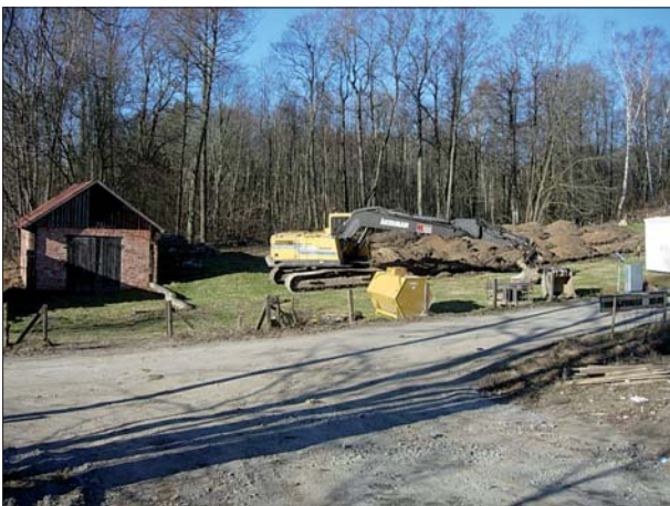
Figur 3. Schaktning.

En stor del av fastigheten täcks av RAÄ 86 (område med skogsbrukslämningar). Fornlämningen utgör en yta inom vilken minst tre kolgropar iaktogs vid odling på 1930-talet. En av dem sägs ha innehållit slagg. Vid inventeringen 1979 noterades svart och kolhaltig jord i ett öppet trädgårdsland. Det har rätt ovisshet om lämningarna härrör från förhistorisk järnframställning eller är spår från den ovannämnda smedjan.