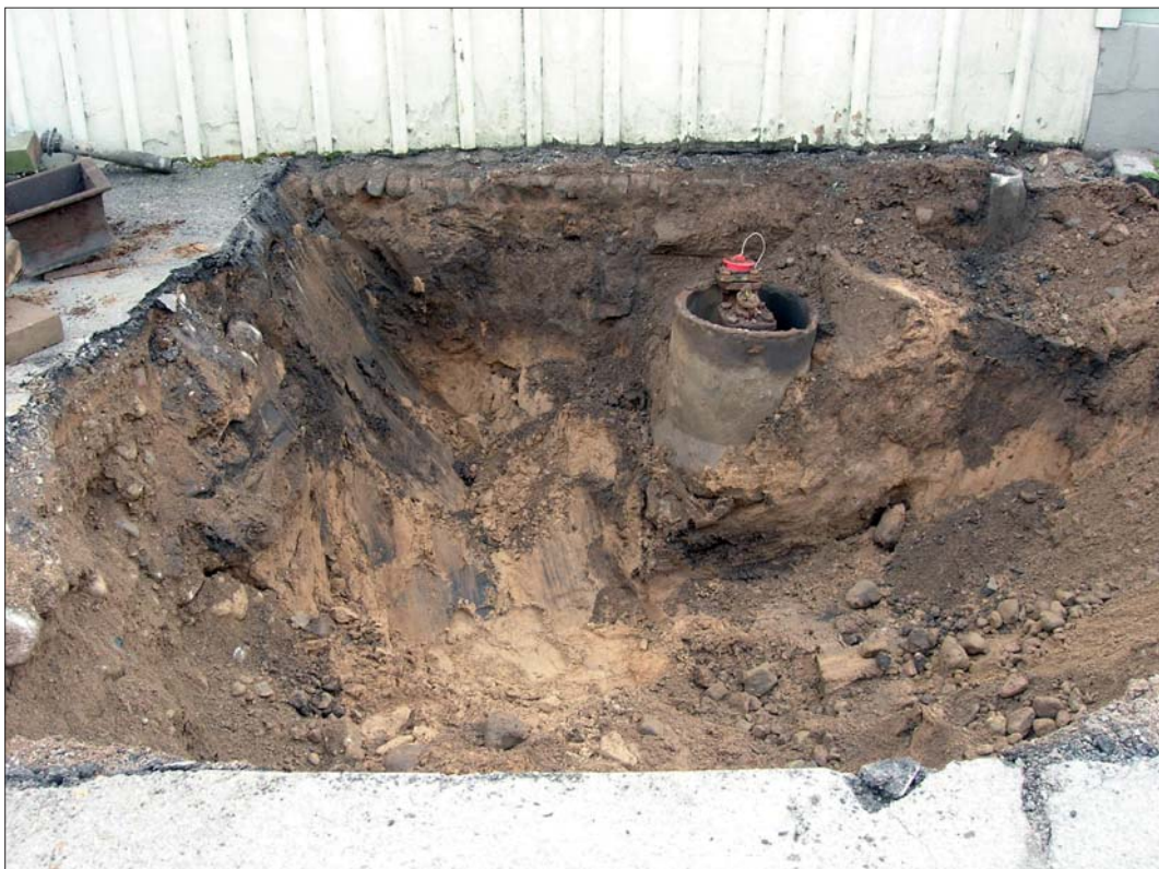
Figur 5. Schakt 2 vid Vistenagatans västra del.