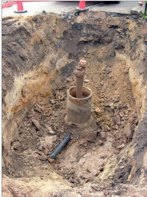
Figur 4. Schakt 1 vid Vistenagatans östra del.