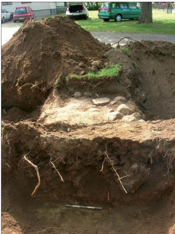
Figur 6. Den delvis raserade muren sedd från öster. Muren slutade tvärt i öster och uppvisade inga tecken på att ha vikt av längs tomtgränsen.