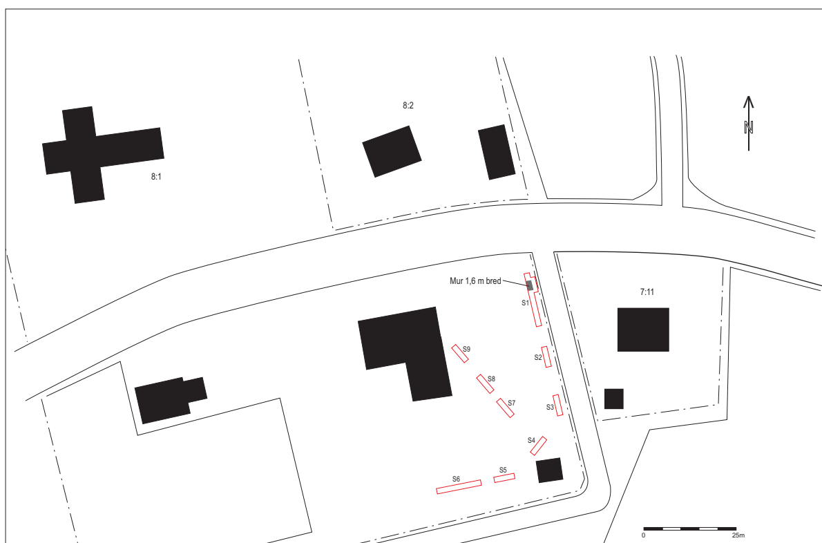
Figur 4. Folkskolans tomt med de nio sökschaktens lägen på gårdsplanen markerade.

Spår av fragmenterat kalkbruk på toppen av muren hör sannolikt samman med det raseringslager innehållande kalkbruk och tegel som överlagrade murens krön. Det är dock tveksamt om detta lager har något att göra med muren eftersom det snarare gav intrycket av att ha blivit deponerat på platsen på så