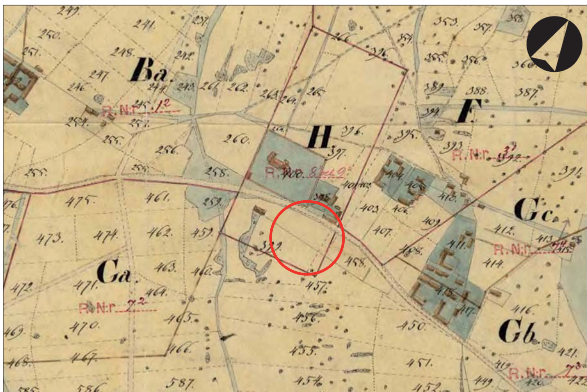
Figur 3. Laga Skifteskarta över Hagebyhöga från år 1845. På denna karta finns ännu ingen bebyggelse söder om vägen eftersom folkskolan byggdes först under 1800-talets senare hälft. Undersökningsområdet är markerat med rött.

På norra och västra sidan om kyrkogården breder idag åkermarken ut sig. Söder om kyrkan ligger folkskolan, småskolan och lärarbostaden, vilka alla är från 1800-talets senare del. Sydväst om kyrkan ligger också en handelsträdgård med växthus, faluröda bostadshus och ekonomibyggnader. Dessa byggnader ligger på den plats där kungsgården kan ha legat. Här kan även den medeltida kyrkbyn ha legat, men platsen kan ha varit bebodd redan under förhistorisk tid, så som lämningarna i det omgivande kulturlandskapet indikerar. Spår av äldre bebyggelse kan därför förekomma inom exploateringsområdet i form av exempelvis stolphål och härdar. Även förhistoriska och/eller medeltida kulturlager kan förekomma inom området i anslutning till den äldre bebyggelsen.