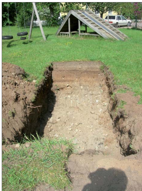
Figur 7. De flesta sökschakt inom undersökningsområdet saknade helt spår av mänsklig påverkan. Schakt 4 sett från sydväst.