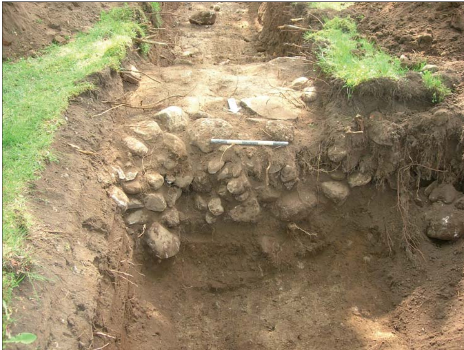
Figur 5. Den delvis raserade muren i schakt 1 sedd från norr. Muren var byggd i en naturlig sluttning och var därför högre på utsidan än på insidan.