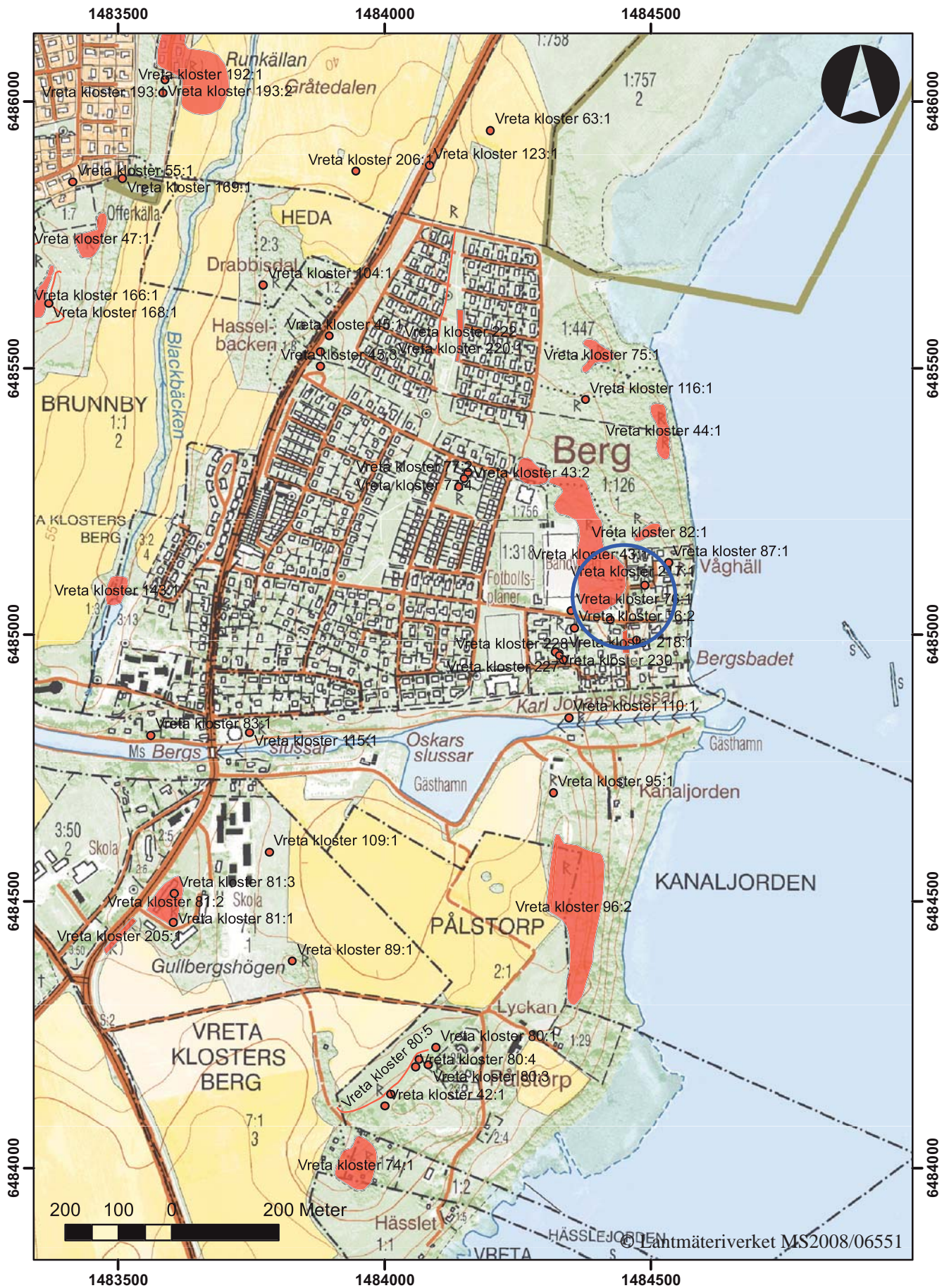
Figur 2. Utdrag ur digitala Fastighetskartan med undersökningsområdet markerat. (blått) Skala 1:10 000.