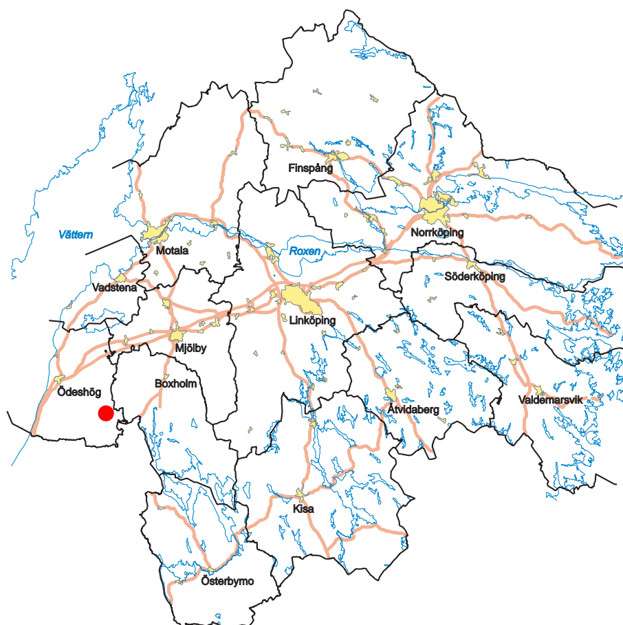
Figur 2. Utdrag ur digitala Fastighetskartan med utredningsområdet markerat med röd streckad linje. Skala 1:10 000.