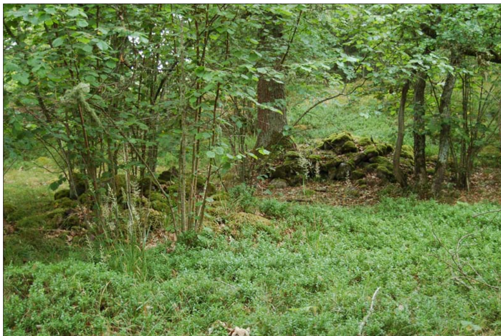
Figur. I Danskeängen finns mindre röjda ytor med röjningsrösen.