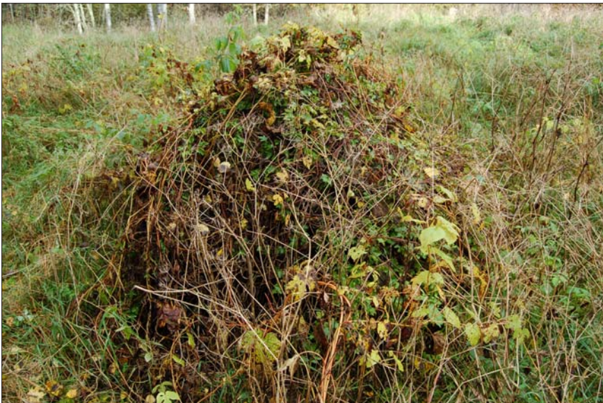
Figur 6. Humlesnår växande på gamla platsen för Ålabäcken (ÖLM 2).