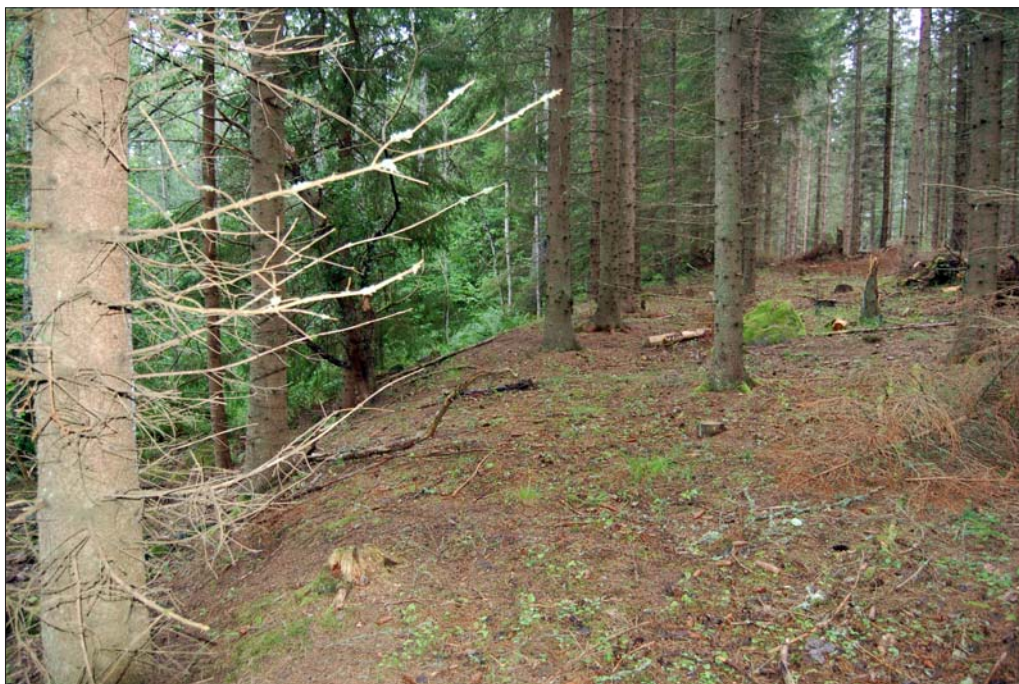
Figur 8. Den kraftiga terrasskanten i V, på den övergivna åkern (ÖLM 3).

Inom området finns flera mindre röjda ytor med omgivande röjningsrösen. I detaljplaneområdet för den planerade bebyggelsen finns igenlagd åkermark, medtagen på den Ekonomiska kartan, 7E 9i Trehörna, från 1948. Även denna åkermark finns med på Häradskartan (1881). Några äldre belägg har inte framkommit i kartmaterialet.