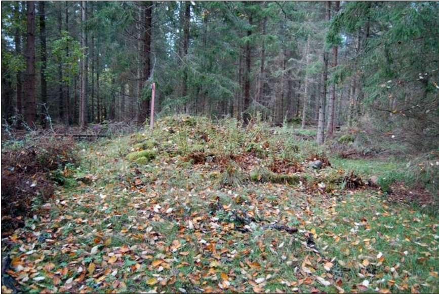
Figur 5. Grunden efter torpet Fridhem, från Ö (Trehörna 77:1).