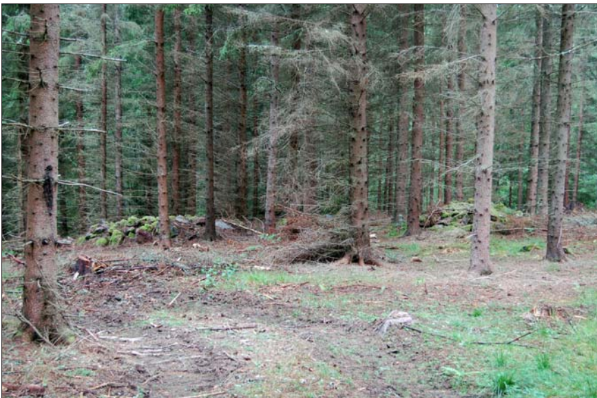
Figur 7. Røjningsrösen på den igenplanterade åkern vid Fridhem (ÖLM 3).