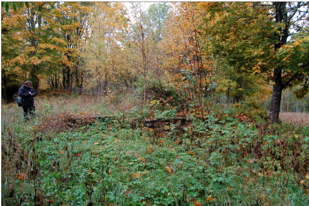
Figur 4. Grunden efter torpet Ålabäcken, taget från N.

Utredningen kommer även att ge förslag på vidare antikvariska åtgärder inom de områden där forn- och kulturlämningar är belägna inför en kommande exploatering.