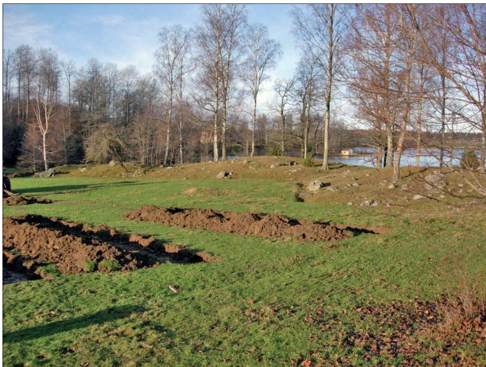
Figur 3. Den planerade tomtmarken var belägen i hagmark intill sjön Regnarens södra strand. Sökschakt i förgrunden. Från öster.

Efter utförd arkeologisk förundersökning gjorde Östergötlands länsmuseum bedömningen att den planerade exploateringen kunde utföras som planerat.