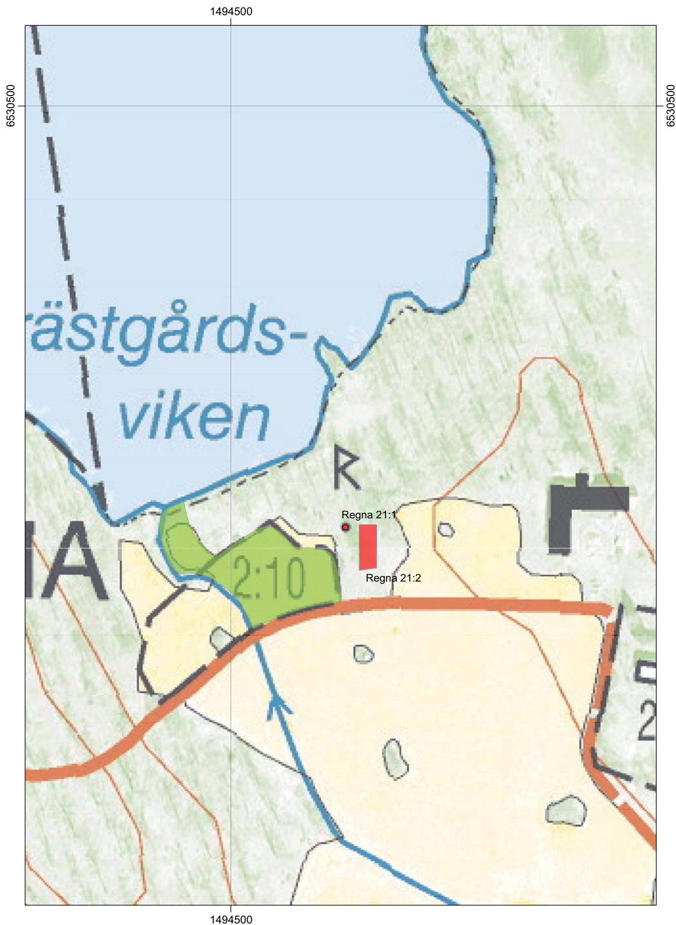
Figur 4. Utdrag ur digitala Fastighetskartan (9F6i) med förundersökningsområde (grönt) och omgivande fornlämningar (rött) markerade. Skala 1:2 000.