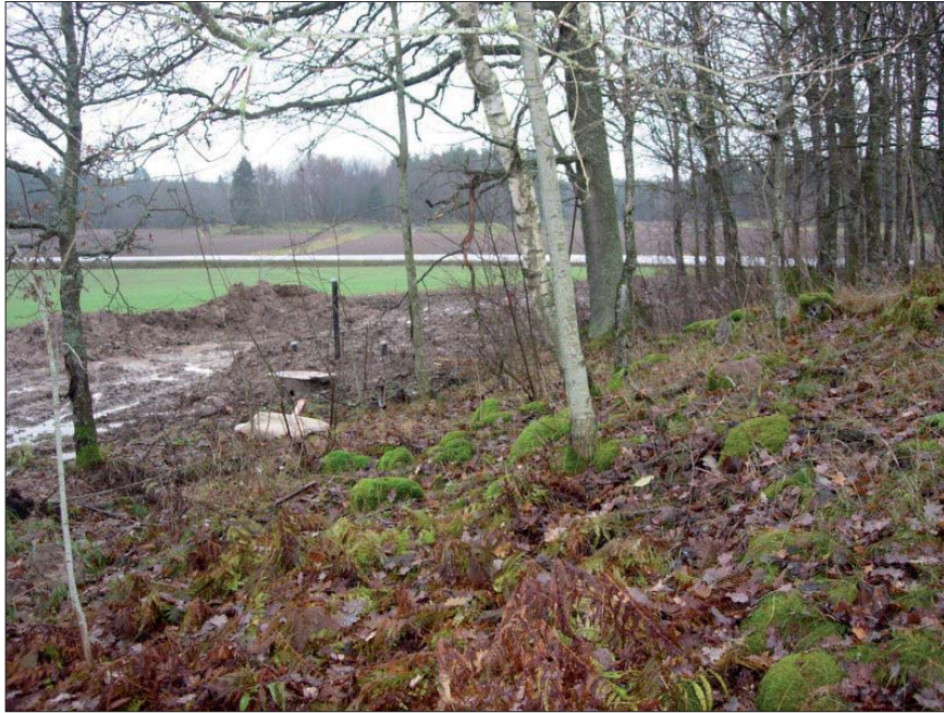
Figur. 6. Avloppsanläggningen i bakgrunden, nedanför höjden där RAÄ 141 ligger. Fornlämningen skymtar t h i bilden. Från nordväst.