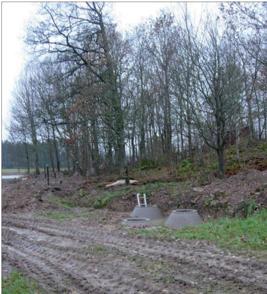
Figur. 5. Avloppsanläggningen i förgrunden, nedanför höjden där RAÄ 141 ligger. Från nordöst.