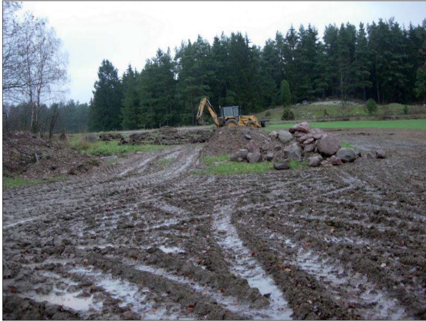
Figur. 4. Sökschaktning på åkerytan, där den planerade villan skulle uppföras. Från söder.