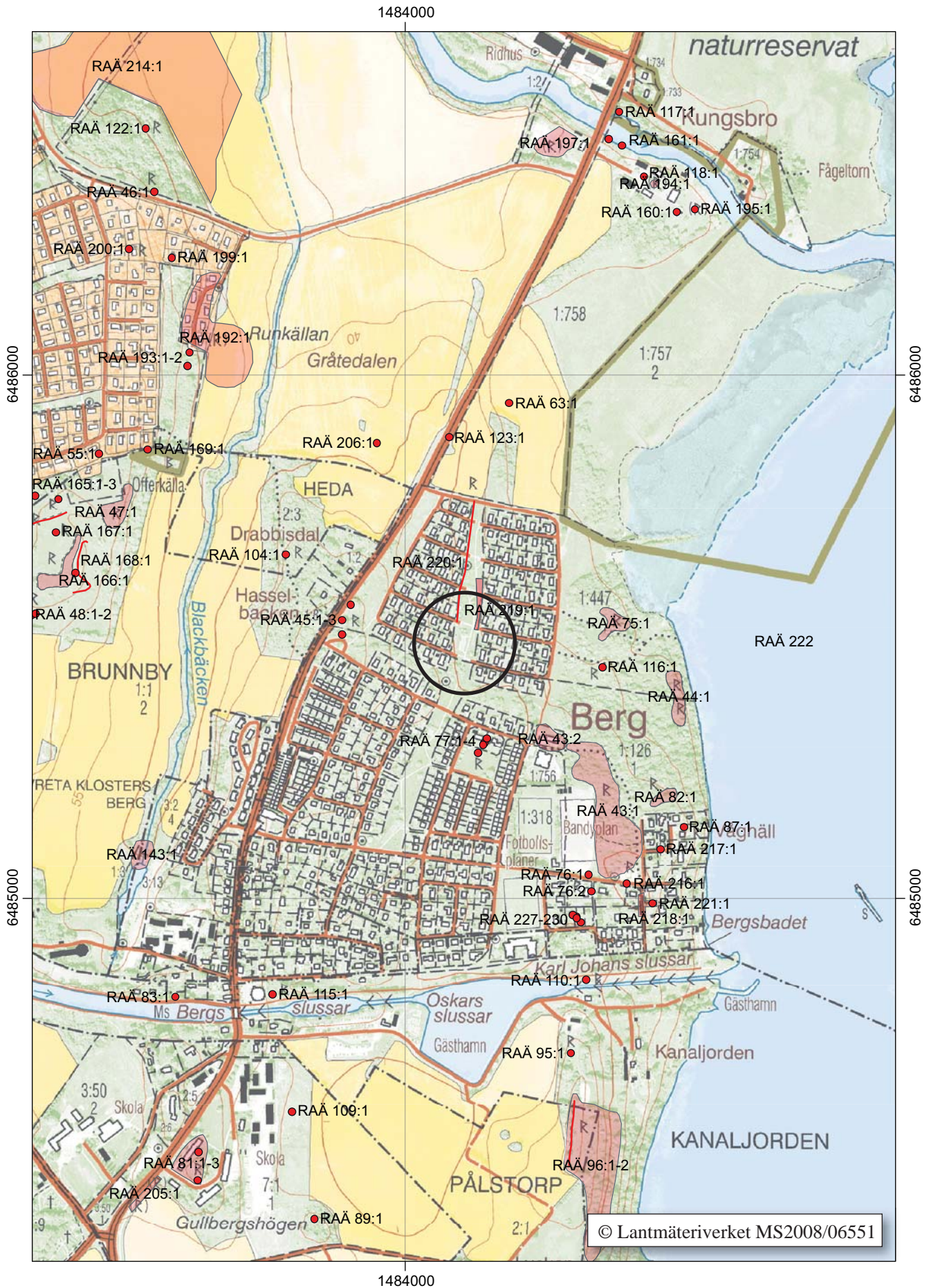
Figur 2. Utdrag ur digitala Fastighetskartan med undersökningsområdet markerat. Skala 1:10 000.