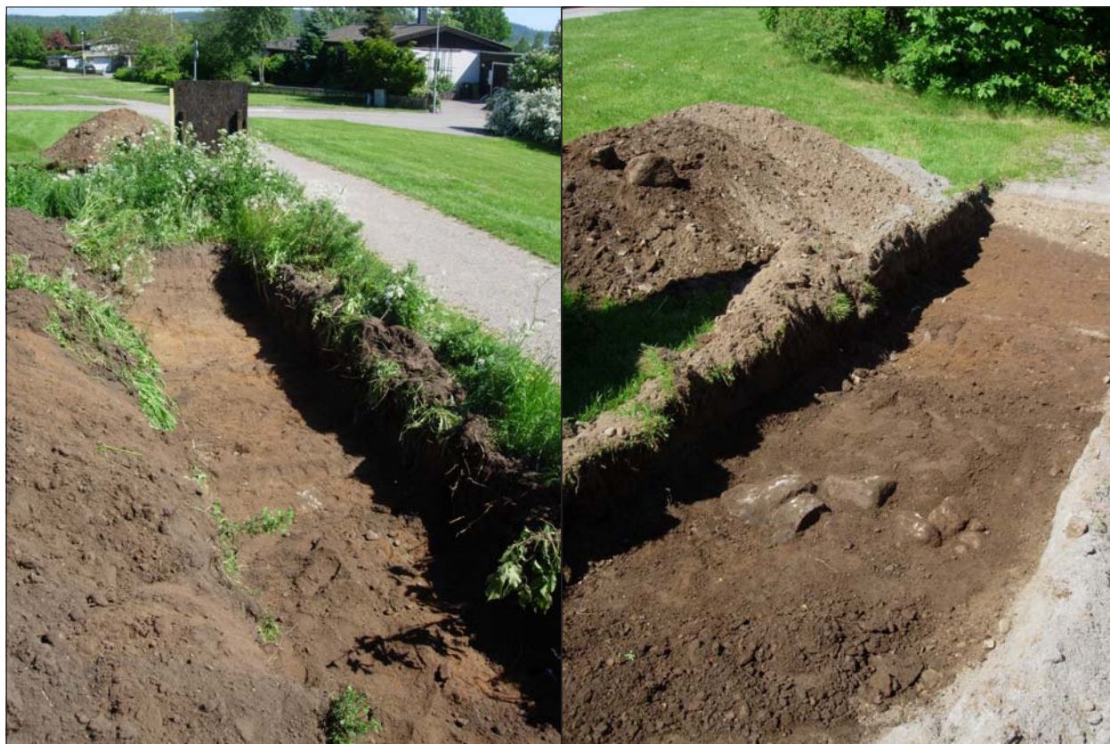
Figur 4. Schakt 3, mot nordost och stenansamling i schakt 7, mot sydväst.

Sju provschakt grävdes med en bredd av 1,6 m och en längd som varierade mellan 3 och 8 m. Djupet varierade mellan 0,45 m och 0,50 m. Två schakt grävdes i gångvägar inom lekparken och ett i gräsmattan strax intill en av dessa gångvägar. Under grusbeläggningen/grästorven framkom ett sättsandslager innehållandes en mängd mindre sten (runt 0,05 m i diameter). Sättsandslagret var i två av dessa schakt nedgrävt till den underliggande, rödgula, sandiga moränen som innehåller mycket sten i varierande storlek.