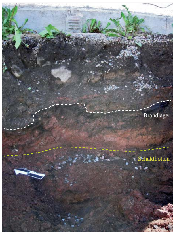
Figur 4. Brandlagret i undersökningsytans nordöstra del.

I den nordöstra delen av schaktet framkom en syllstensrad direkt under markytan. Syllstensraden låg placerad ovanpå ett mäktigt brandlager bestående av rödbränd sand med inslag av kol och sot. I botten av