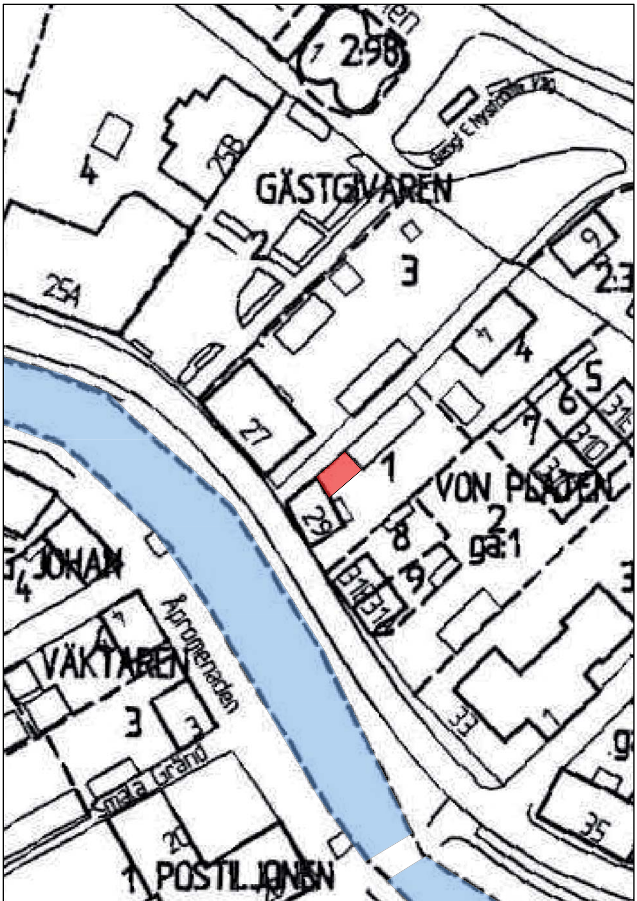
Figur 3. Utdrag ur Adresskartan över Söderköping, med undersökningsområdet markerat i rött. Skala 1:750.