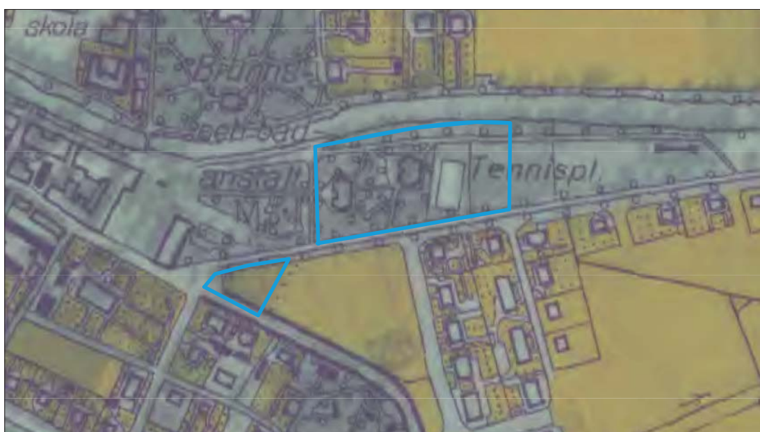
Figur 5. Utsnitt ur den äldre Ekonomiska kartan 1946, blad 8G6g Söderköping, med utredningsområdena markerade i blått. Skala 1:4 000.