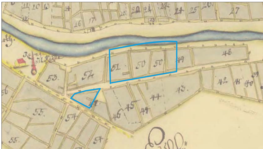
Figur 3. Rektifierat utsnitt ur ägomätning av Söderköpings stad 1701 (LMS D111-1:5) med utredningsområdena markerade i blått. Skala 1:4 000.