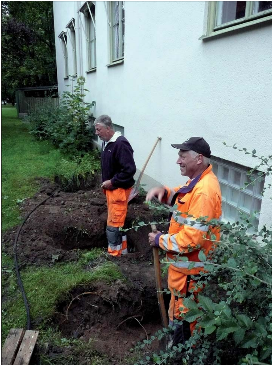
Figur 5. Schakten för trappfundament.