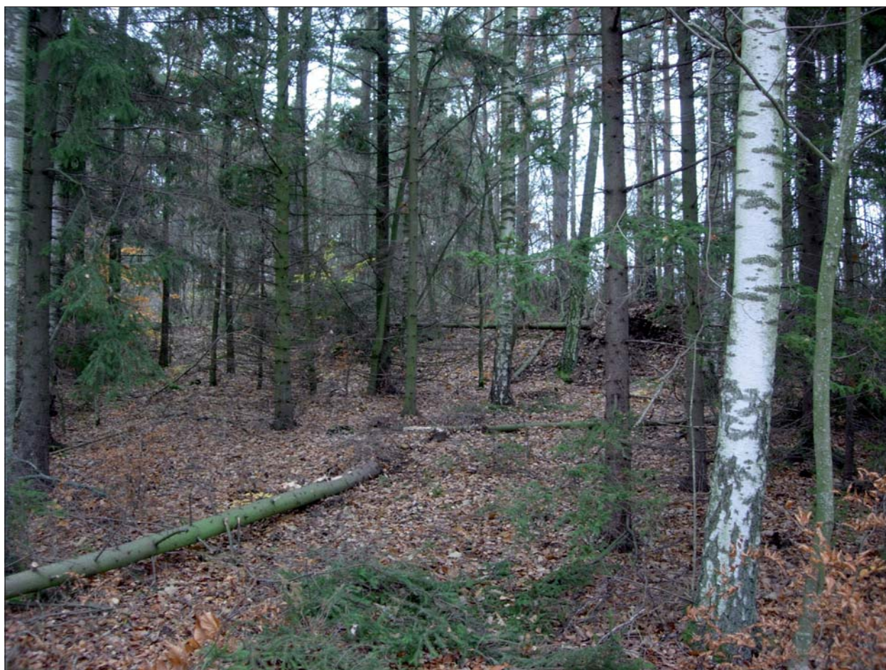
Figur 4. Den tänkta platsen för villan. Mot nordost.

Utredningens tredje moment utgjordes av en sökschaktsgrävning inom den planerade tomten. Samtidigt utfördes den arkeologiska förundersökningen genom sökschaktsgrävning längs sträckningen för den nya vägen.