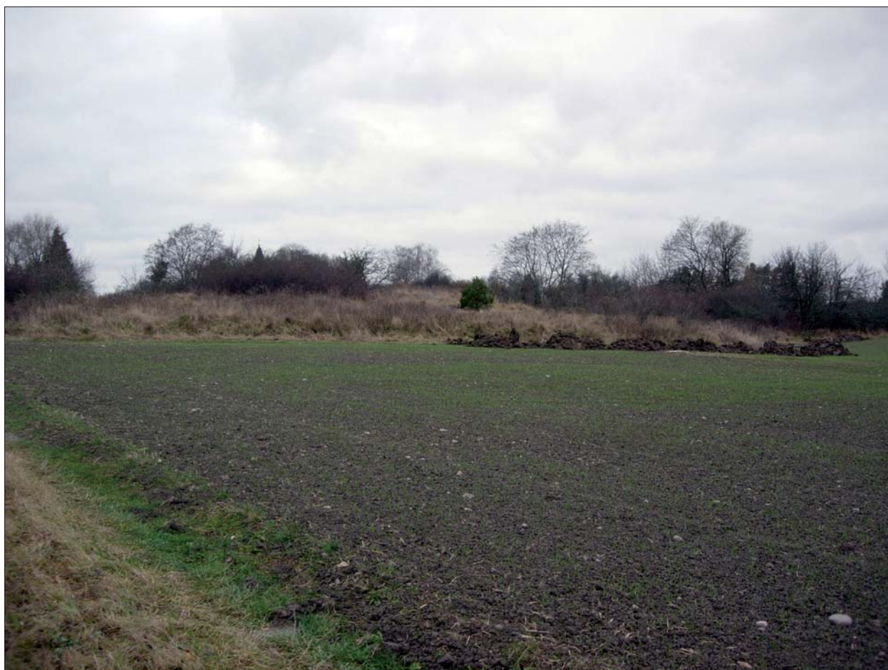
Figur 3. Fjucks gamla tomt i bakgrunden. Sökschakt för vägen. Mot väster.

Väster om den planerade villatomten, i betad hagmark, finns ett stensträngssystem (RAÄ 69:1) med en sammanlagd längd av ca 345 m.