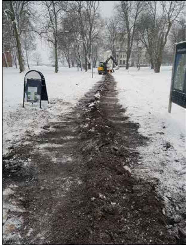
Figur 5. Schaktet igenlagt efter undersökning.