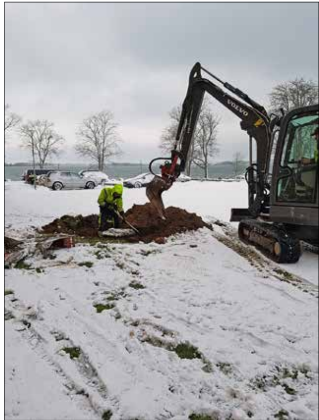
Figur 7. Schaktet vid palatset.