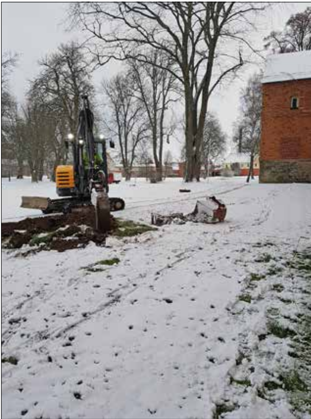
Figur 6. Schaktet vid palatset. Foto från SV, Helén Romedahl, ÖM.