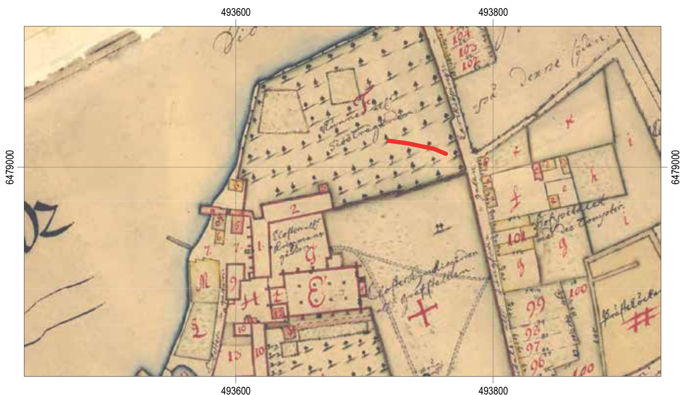
Figur 3. Undersökningsområdet mot bakgrund av 1705 års karta (LMA: D 121-1:3). Skala 1:3 000.

Troligen stod husen mer eller mindre oanvända från 1641 då delar av klosterbyggnaden revs och de återstående delarna av nunneklostret byggdes om till