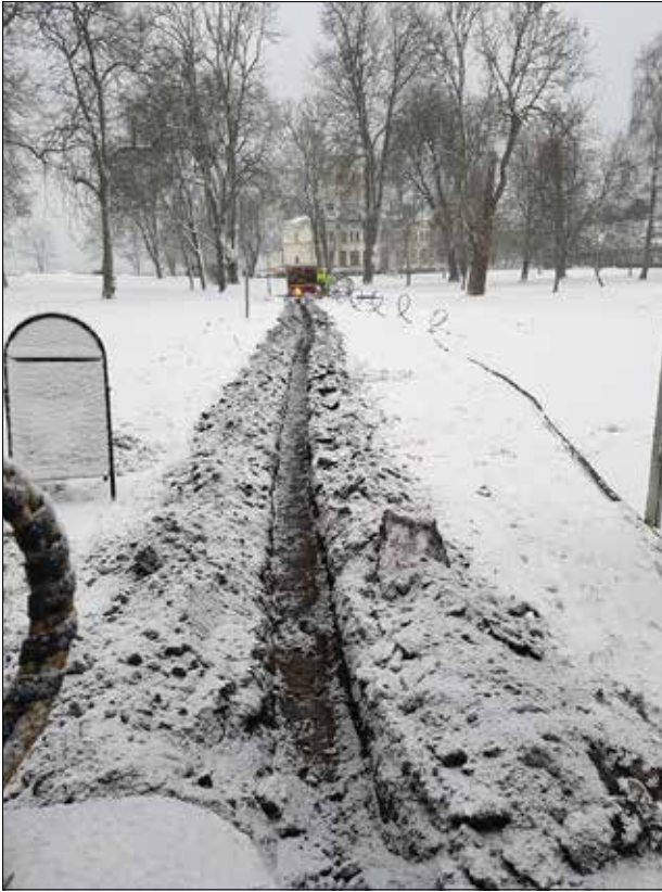
Figur 4. Schaktet i Örtagården.