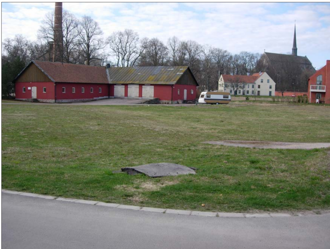
Figur 3. Översiktsbild mot SV över det aktuella området.

Syftet med den arkeologiska utredningen etapp 1 och 2, var att fastställa huruvida fast fornlämning kommer