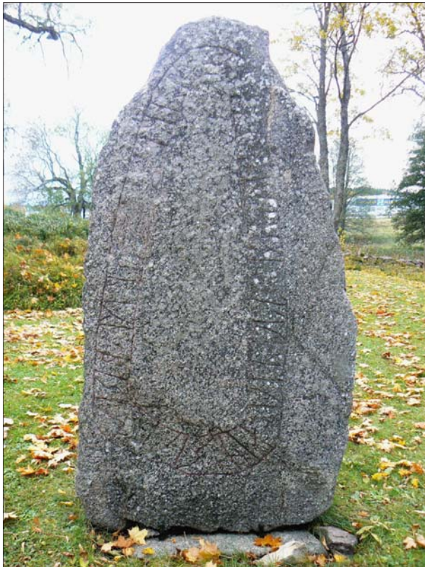
Figur 4. Sörbysten ÖGL 197. Runstenen på Sörby kyrkogård, ÖGL 197.

finns ett antal osäkra lämningar i form av rösen och stensättningar, RAÄ 92, 273 och 274. Området utgör en väl sammanhållen kulturmiljö som ingår i länsstyrelsens kulturminnesprogram (K51 Mjölby kommun). Vid en arkeologisk utredning 2005 (Lundberg 2006) genomfördes ett flertal sökschakt bland annat inom Sörby bytomts södra utkant. Vid detta tillfälle framkom flera förhistoriska anläggningar som givits egna nummer i FMIS, RAÄ 272, 277, 278 och 279.