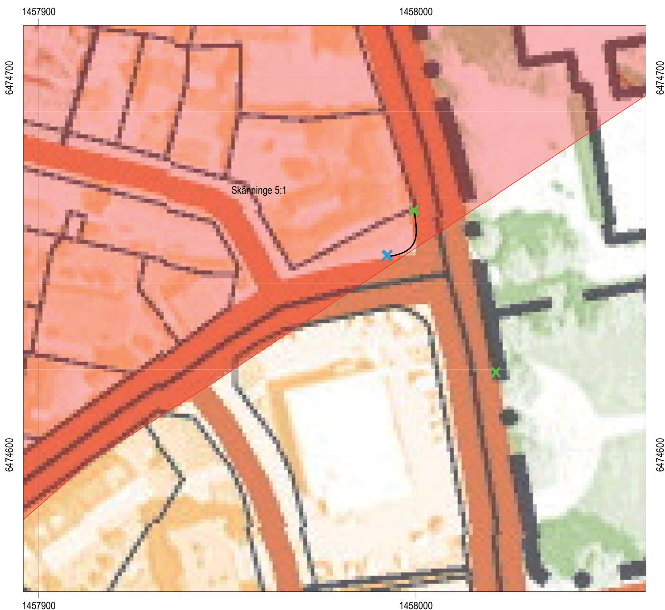
Figur 4. Utsnitt ut digitala Fastighetskartan, blad 8F4b, med arbetsföretaget markerat. Gröna kryss är nya lyktstolpar, blått kryss är stolpe som byttes ut, svart linje är kabelschakt. Skala 1:1000.

Om fornlämningar ändå framkom skulle dessa dokumenteras avseende karaktär och omfattning samt om möjligt dateras. Förundersökningens resultat var också avsedda att kunna ligga till grund för Länsstyrelsens fortsatta beslut i ärendet.