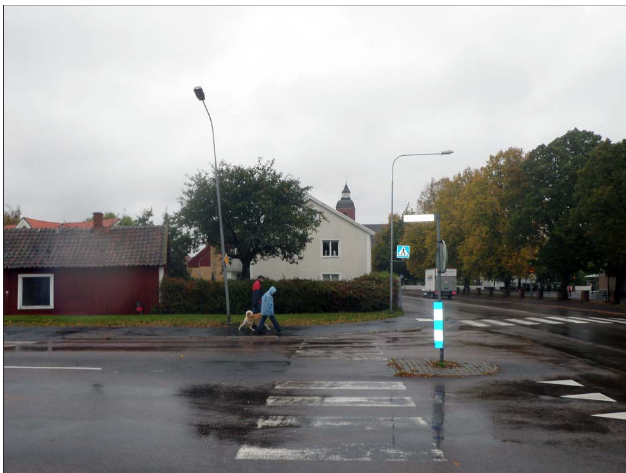
Figur 3. De nya belysningsstolparna i Mjölbygatan/Bjälbogatan en regnig dag i oktober 2010.

I samband med schaktningar för nya belysningsstolpar och tillhörande ledningar längs Mjölbygatan på sträckan Stora Vallgatan-Östra Kyrkogatan år 2000 genomfördes en arkeologisk förundersökning (Feldt 2001). Där konstaterades att kulturpåverkade lager börjar uppträda i höjd med Järnvägsgatan för att sedan öka i omfattning närmare stadens centrum. Stenläggningar påträffades i tre av schakten (schakt 3, 6 och 7) längs kvarteret Skrivaren 1. Kulturlagrens mäktighet längs sträckan varierade mellan 0,15 och 0,75 m. Bland fynden fanns en skärva medeltida stengods i schakt 2 i höjd med Rosenlundsskolan.