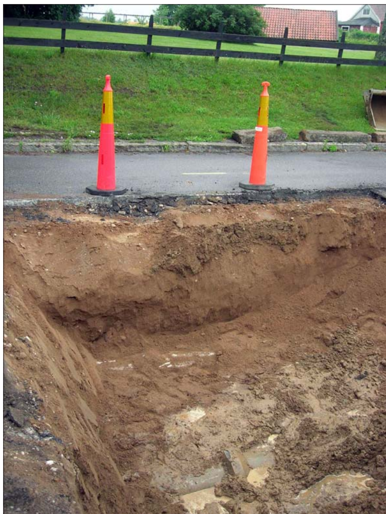
Figur 3. Sommaren 2007 uppstod en akut vattenläcka utanför Nunnestigen 13 (tjänsteanteckning Carlsson 2007). Endast fyllnadslager kom att beröras. Bilden togs vid detta tillfälle. I bakgrunden skyddstaket över källaren vid S:ta Ingridis kloster.

Wallenberg B. 1984. Grav under runhällar i Skänninge . Stockholm.