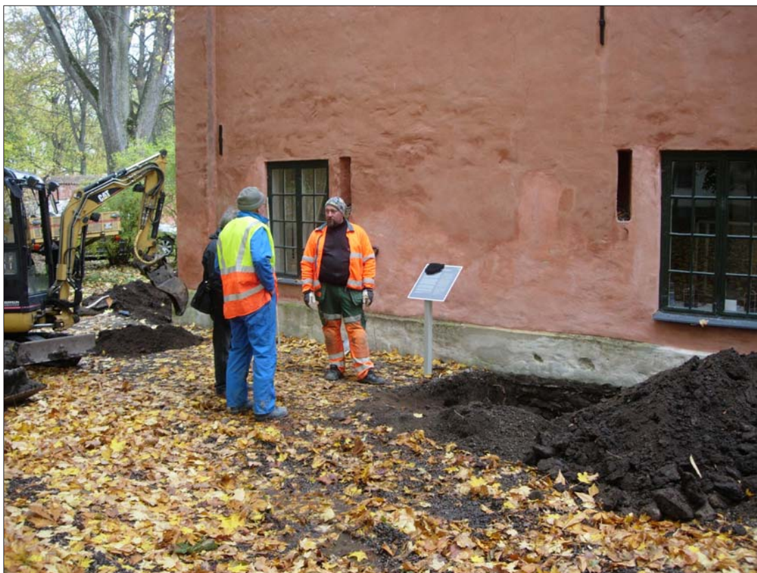
Figur 3. De två provgroparna längs Hospitalmuseets SSÖ fasad.

Ett hundratal meter söder om kungsgården låg sockenkyrkan S:t Per. Kring år 1830 revs den senmedeltida gotiska kyrkan men dess torn fick stå kvar. Idag ingår det i byggnaden Rödtorner (Hasselmo 1982). Rester efter en äldre romansk stenkyrka har påträffats vid flera arkeologiska undersökningar.