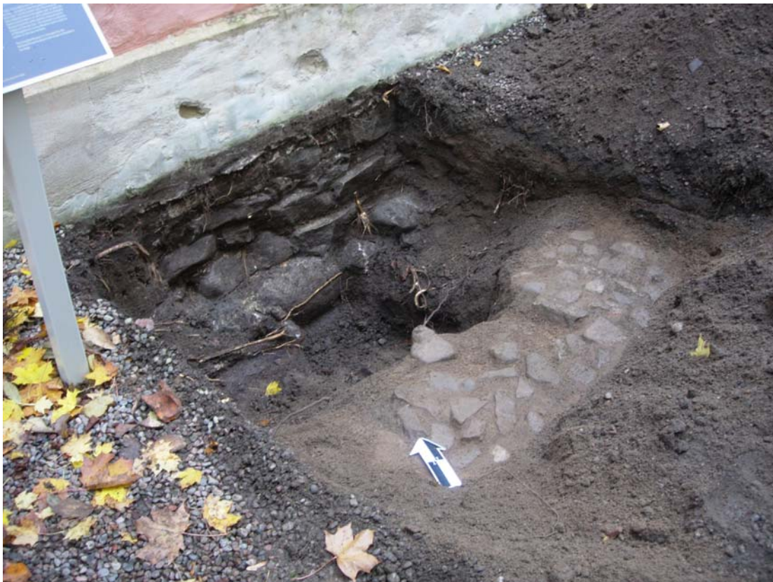
Figur 7. Provgrop 2 med stenbeläggning.

en endast följde muren lodrätt ner. Mellan grundmurens understa stenar och undergrundens lera kunde ett ca 0,15 m tjockt, grått kulturlager skönjas.