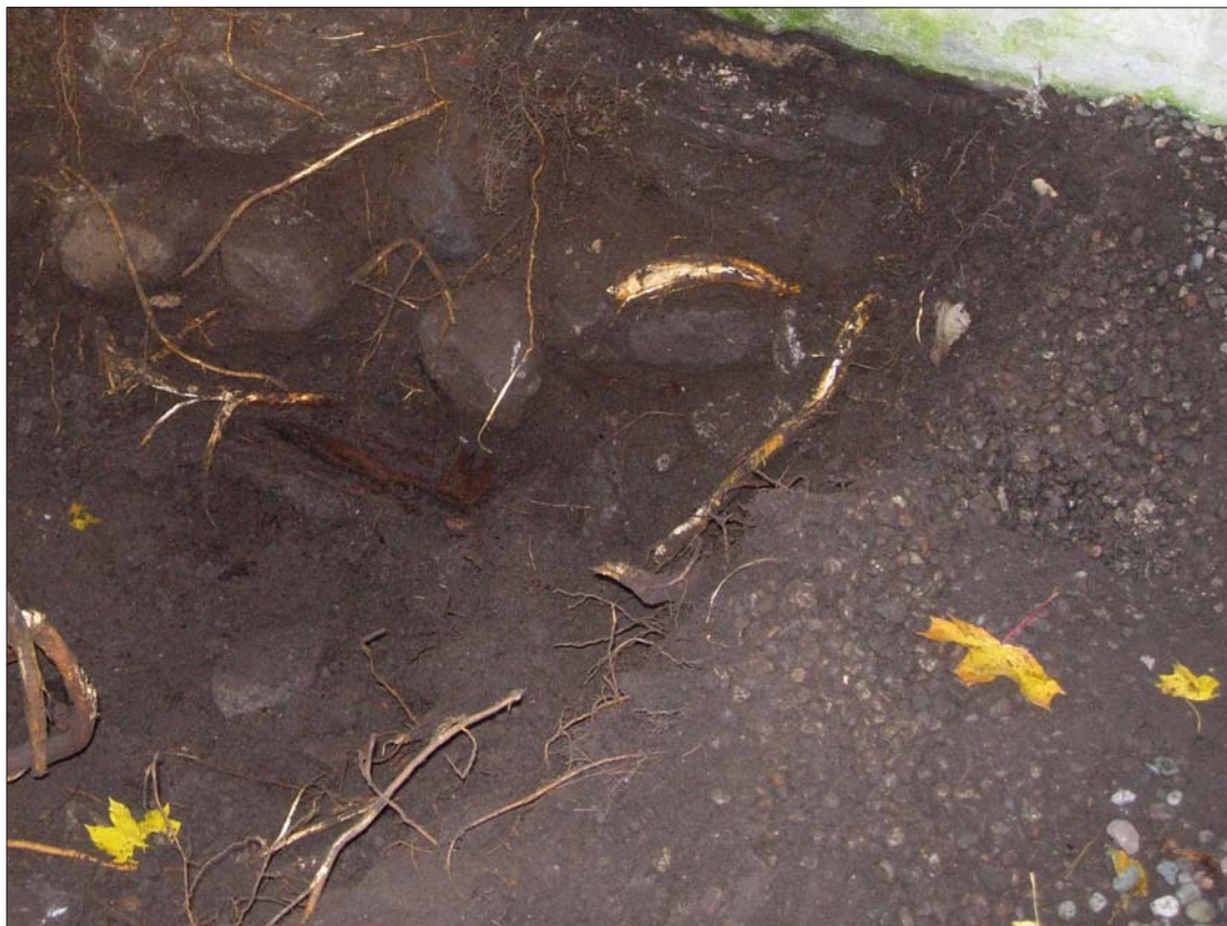
Figur 6. Provgrop 1 vid Hospitalmuseets SSV hörn.

Hospitalmuseets grundmur var här bättre konstruerad än i Provgrop 1, med jämnare stenstorlek och bättre passning. Vid 1,0 m djup framkom den beige-grå leran som är undergrund men ingen rustbäddskonstruktion kunde noteras. Möjligen är det så att rustbädden ligger mer centrerad under grundmuren och att den därför inte kan konstateras då schaktnings-