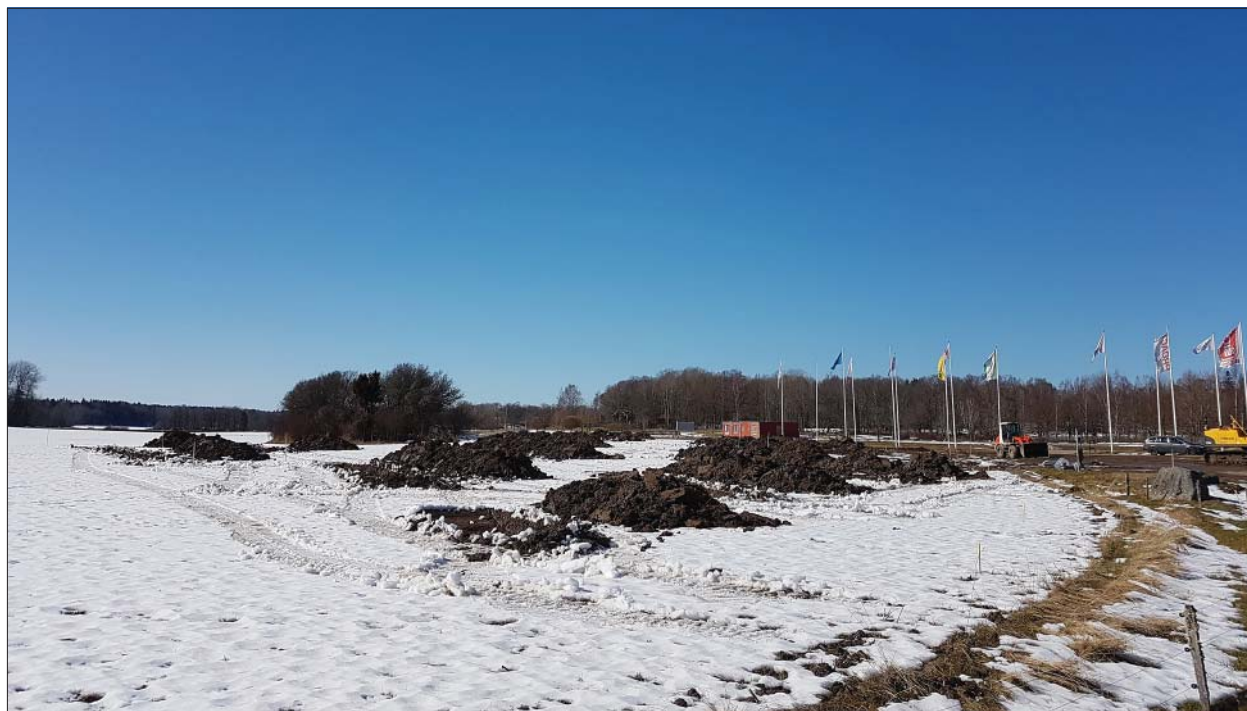
Figur 5. Översiktbild över utredningsområdet. Foto mot nordväst.

Ortnamnsregistret. Institutet för språk och folkminnen. http://www.sprakochfolkminnen.se/sprak/namn/ortnamn/ortnamnsregistret/sok-i-registret