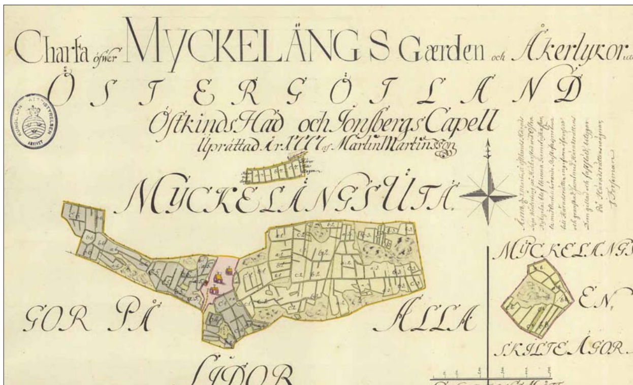
Figur 3. Möckeläng 1777 (LST akt D43-56:1).

Den forntida bebyggelseutvecklingen i området har behandlats i en uppsats i arkeologi vid Sthlms Universitet (Peterson 1991).