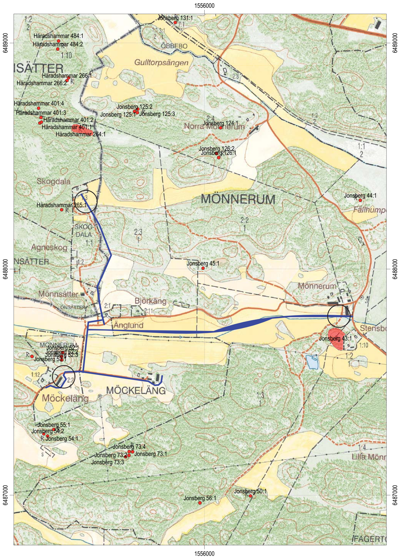
Figur 2. Utdrag ur digitala Fastighetskartan, blad 8H7b, med aktuell ledningssträcka markerad (blå) och de tre lokaler där sökschakt upptogs inringade. Skala 1:10 000.