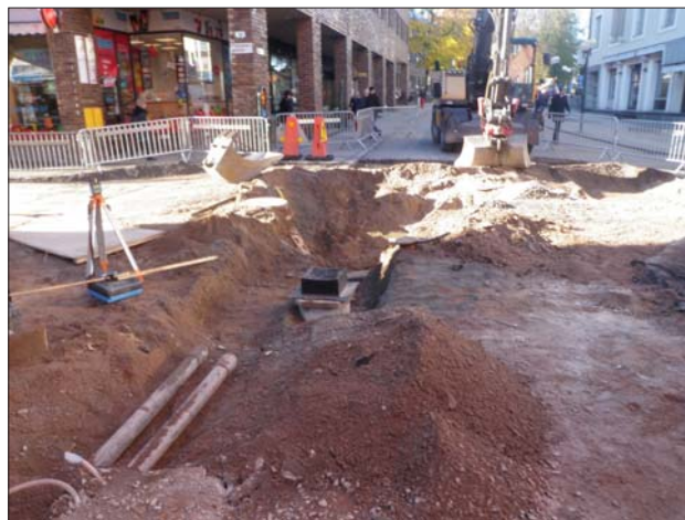
Figur 8. Korsningen Platensgatan-Ågatan uppgrävd.