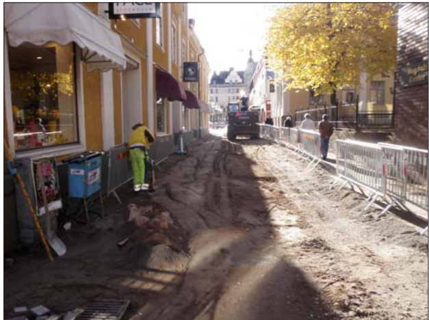
Figur 6 och 7. Hantverkaregatan och Platensgatan under arbetet.