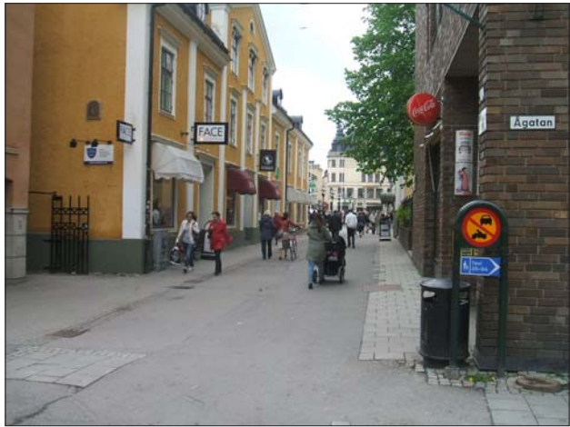
Figur 4 och 5. Hantverkaregatan och Platensgatan före ingreppen.