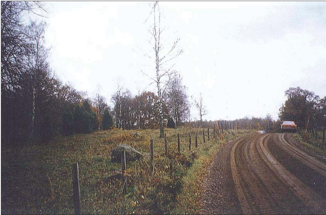
Figur 3. Värdefull hagmark invid Storängen öster om Sättra by och intill väg 511.