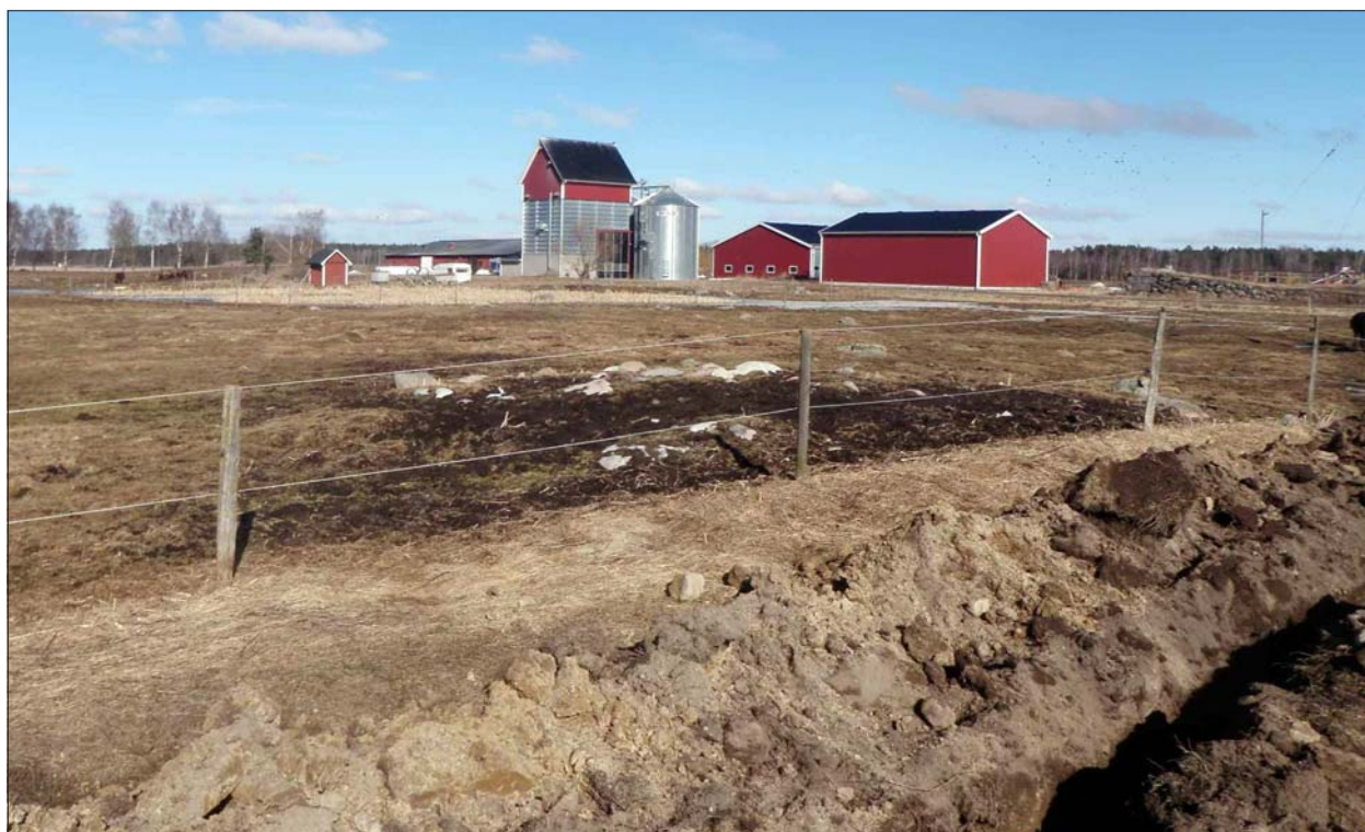
Figur 4. Schaktet löpte relativt tätt in på stensättningen RAÄ 97:1 (mörk jord och stenar). I bakgrunden Distorps ekonomibyggnader.

Undersökningen genomfördes som en antikvarisk kontroll, vilket i detta fall innebar att grävningen löpande