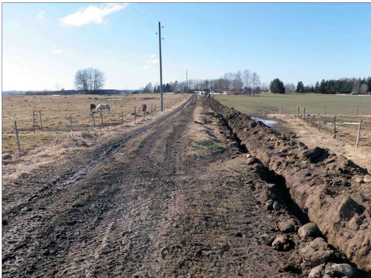
Figur 5. Schaktet sett från öster. Bortom hästarna ligger gravfältet RAÄ 96 och till höger anas torpet Åttingen.

Hörfors O. 2010b. Gärstadverken - ny återvinningscentral . Arkeologisk slutundersökning. RAÄ 332. Åby mellangård, stadsäga 8861. Rystads socken, Linköpings kommun, Östergötlands län. Rapport ÖLM 2010:105