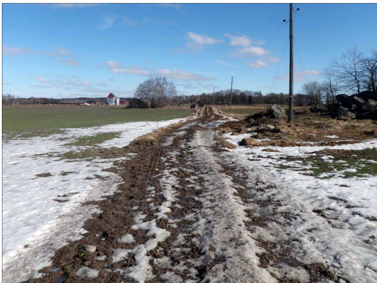
Figur 6. Schaktet sett från väster. Till höger syns RAÄ 92, med stolpen som skulle tas bort.